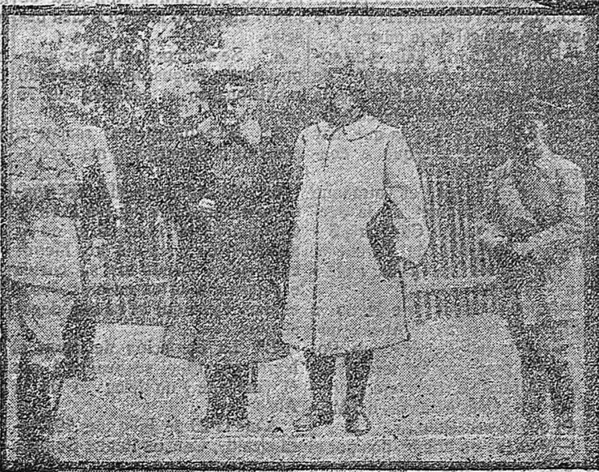
LOS GENERALES BERTHELOT Y REIAIEFF SALIENDO DEL CUARTEL GENERAL DEL EJÉRCITO RUMANO

El muerto, que no pudo ser identificado, aparenta unos veinticinco años y viste modestamente, presen-