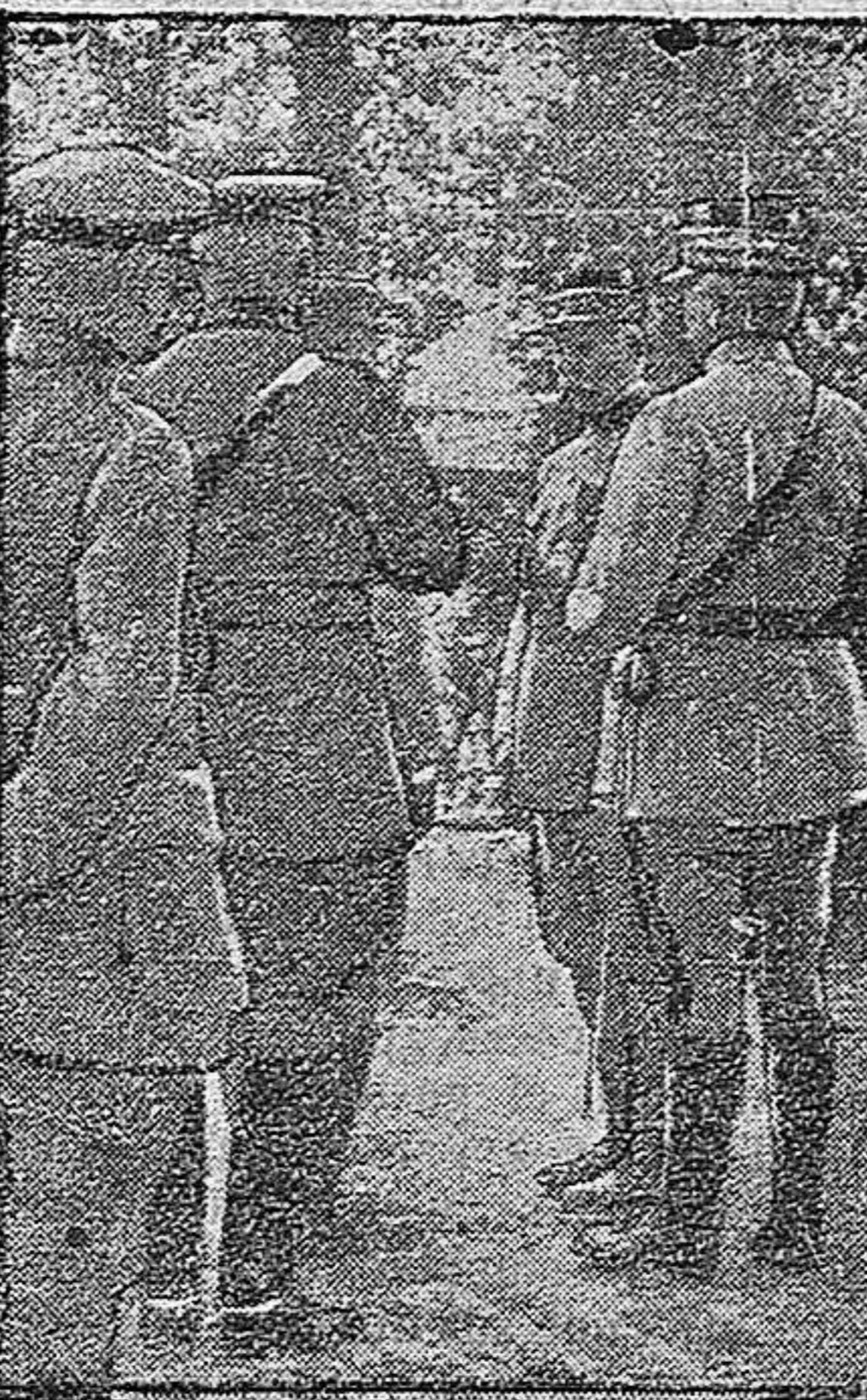
El general Petain visitando el cuartel general belga.

No obstante los obstáculos que se anteponen a esta necesaria obra, el alcalde hace gestiones por resolverlas favorablemente y ha ofrecido empezar dichas obras en breve plazo.