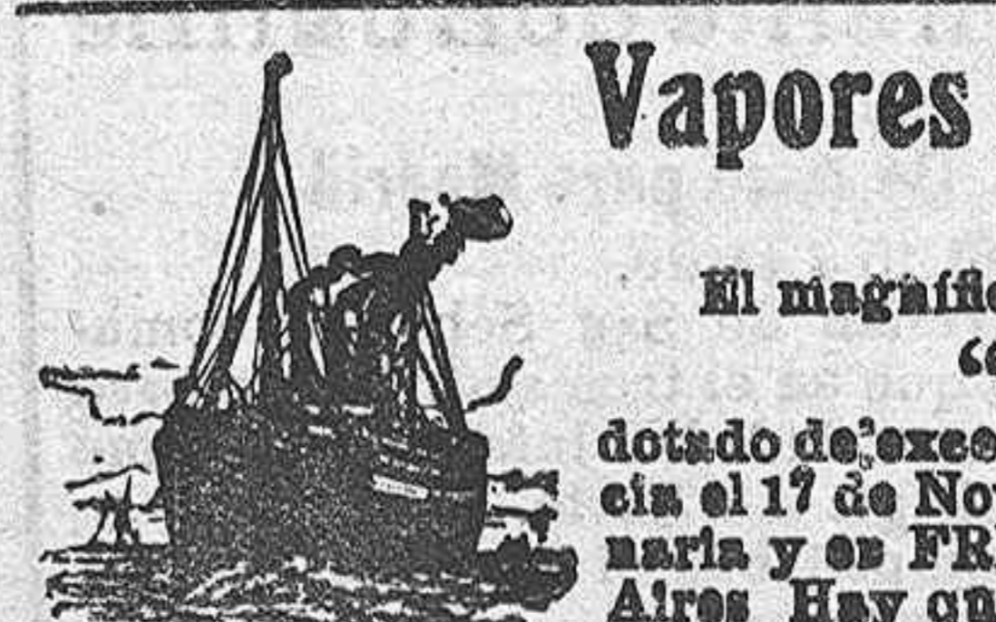
Vapores frigoríficos para Sud-América

Bajo la presidencia del General gobernador civil y con asistencia de los señores