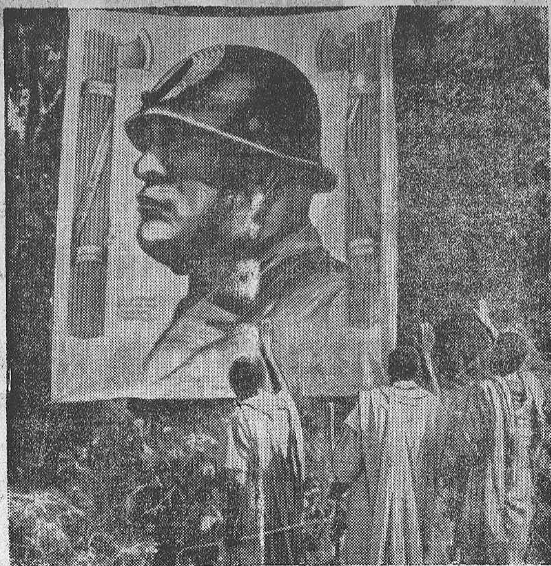
LA GUERRA EN ABISINIA

Gibraltar.—Durante el día de hoy, se han celebrado continuos ejercicios por los artilleros antiaéreos, disparando contra globos pequeños que dejaban aviones que volaban a una gran velocidad.