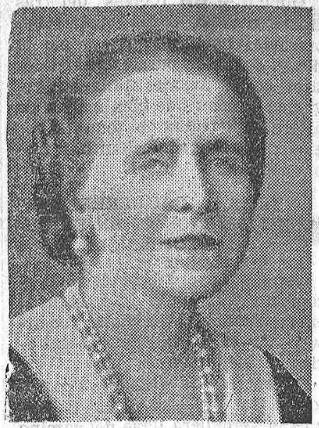
LA REINA VIUDA MARIA DE RUMANIA que cumplirá el 29 de octubre, 60 años de edad.