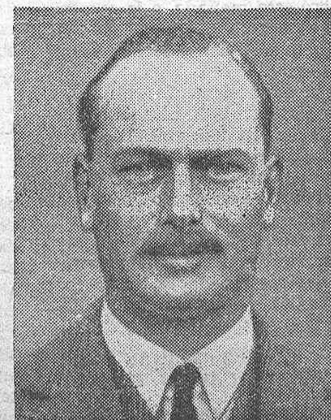
UNA BODA REAL EN INGLATERRA Príncipe Enrique de Inglaterra, (duque de Gloucester), tercer hijo del Rey Jorge, que contraerá matrimonio el día 6 de noviembre próximo con Lady Alice Scott, en Westminster Abbey