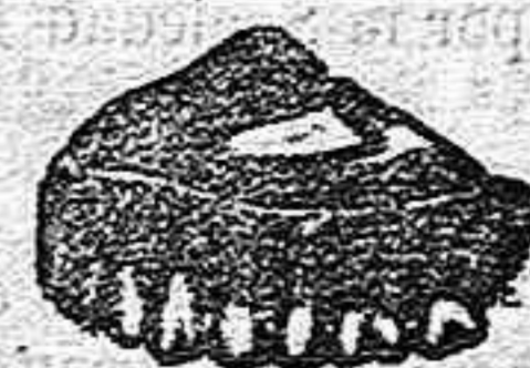
A LA HUMANIDAD DOLIENTE.

Precio del pasaje, 4 rs.—Id. caballería 6 id.