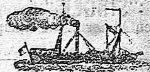
El nuevo y magnífico vapor Español TERESA.

Saldrá para ORAN todos los sábados á las 6 en punto de la tarde, admitiendo carga y pasajeros para dicho punto.