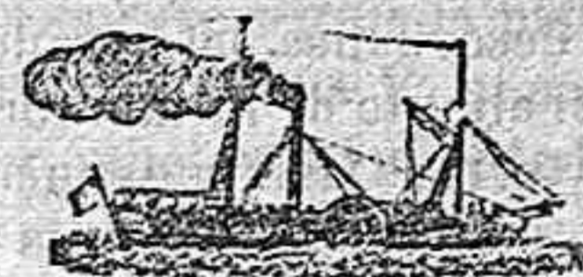
El nuevo y magnífico vapor Español TERESA.

Saldrá para ORAN todos los sábados á las 6 en punto de la tarde, admitiendo carga y pasajeros para dicho punto.