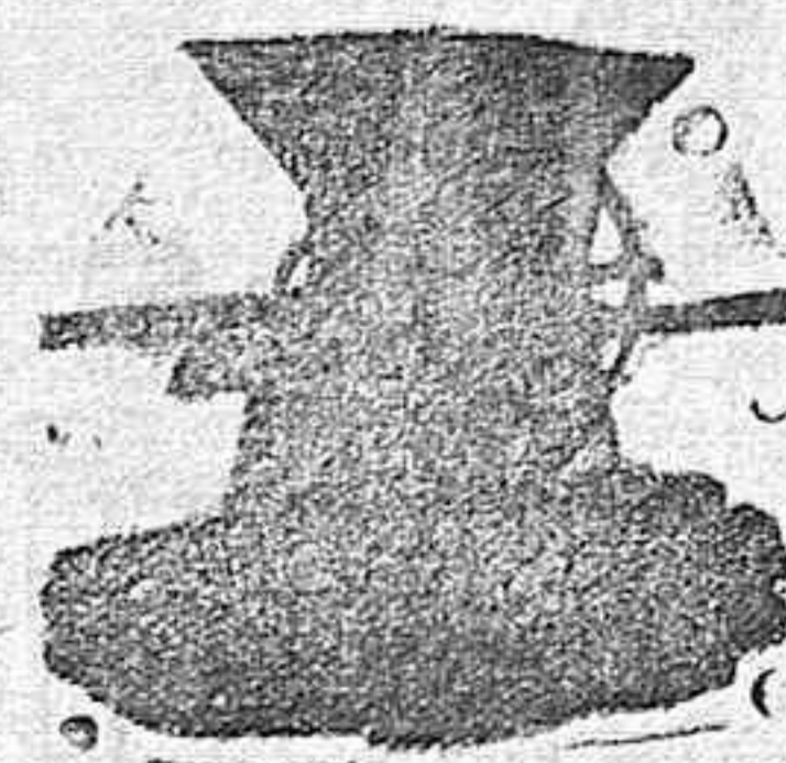
Pisadora de uva

Arados de todas clases, Cultivadores Gradas, Bombas, Prensas y Pisadoras de uvas, Trituradores de piensos, Desgranadoras de Maiz, desde 12 pesetas, Prensas para paja, Molinos de Viento, Norias.—Catálogos y presupuestos gratis de toda clase de Maquinaria Agrícola e Industrial.