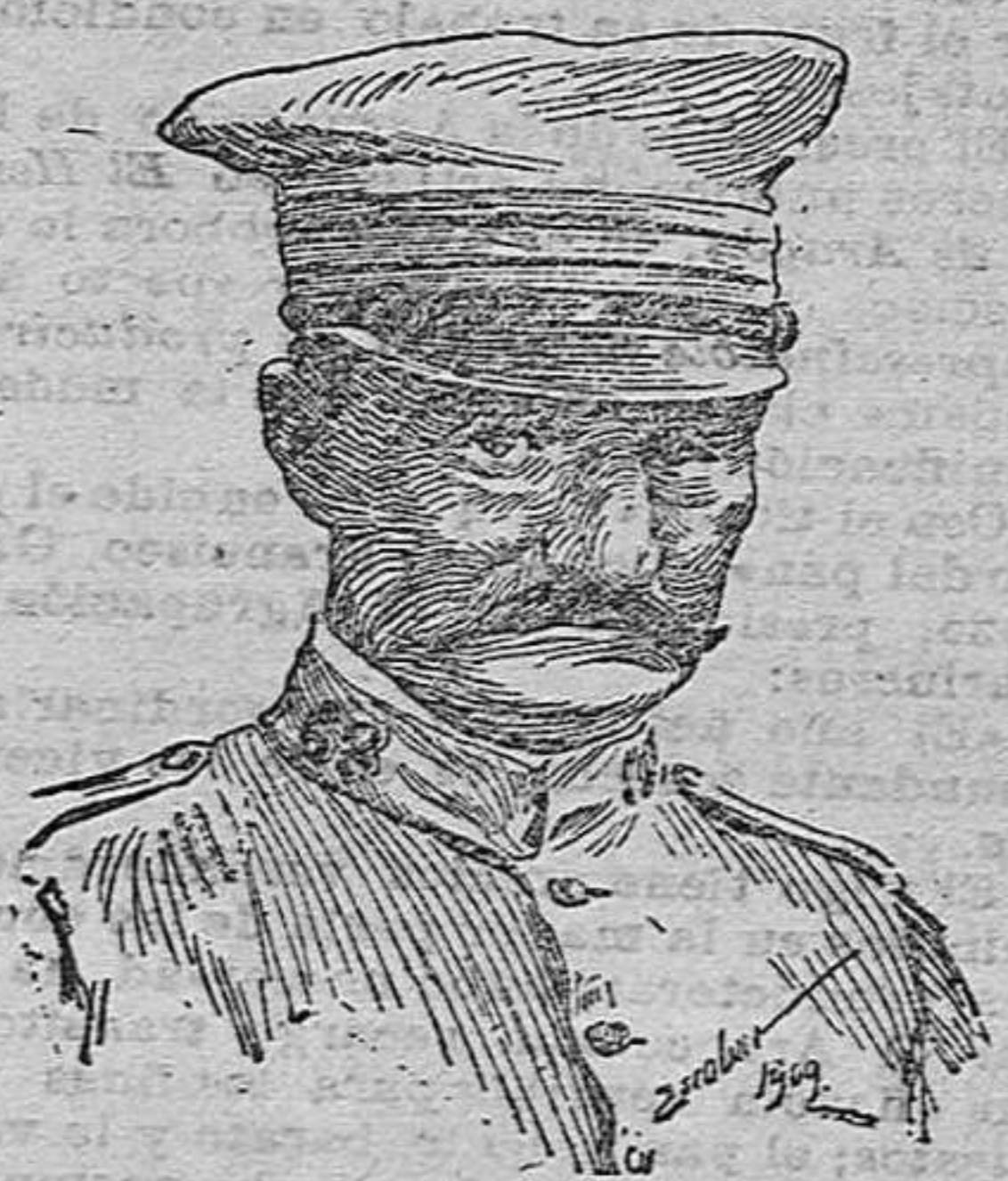
El señor general Arce, destinado á mandar una de las brigadas del ejército de operaciones en Africa.