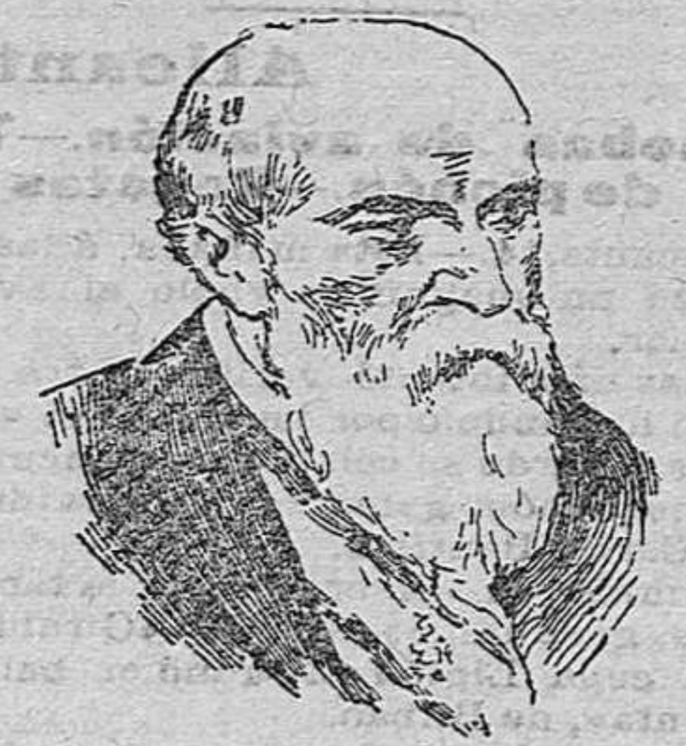
El insigne académico don Eduardo Saavedra, que falleció hace pocos días en Madrid.