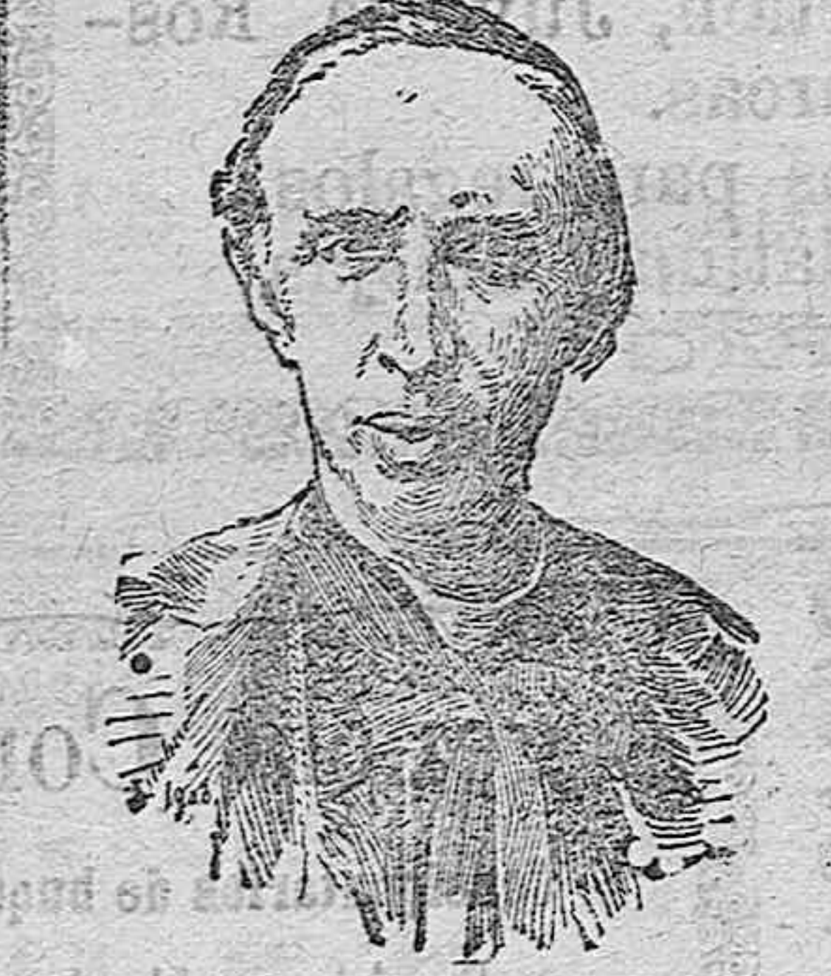
El dignísimo cardenal Merclier arzobispo de Manihas, que ha salido de Bruselas para efectuar un recorrido por Norte América