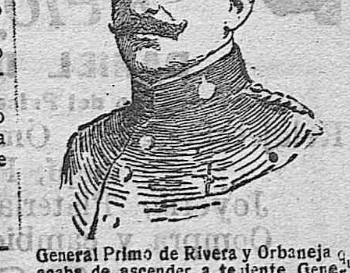
General Primo de Rivera y Orbaneja acaba de ascender a teniente General.