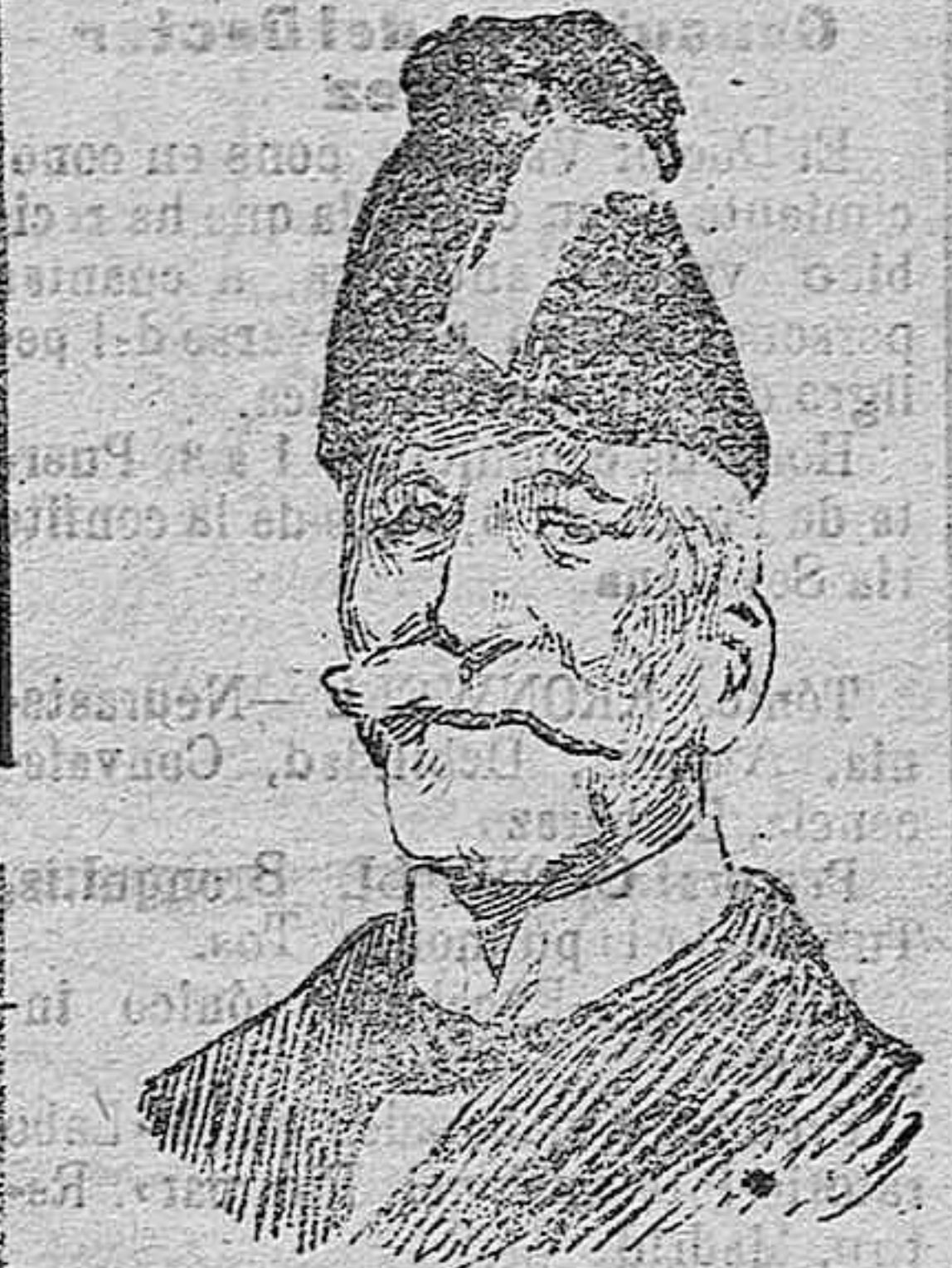
El General Flores ministro de Marinas

buén camino, pero ella no me hacia caso, le gustaba mas la juerga y la vida perniciosa que llevaba. Hemos estado viviendo 10 años juntos. Te-