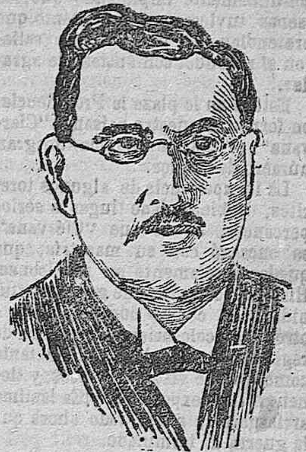
Herman Muller, ministro de Negocios Extranjeros de Alemania y firmante del Tratado de Paz