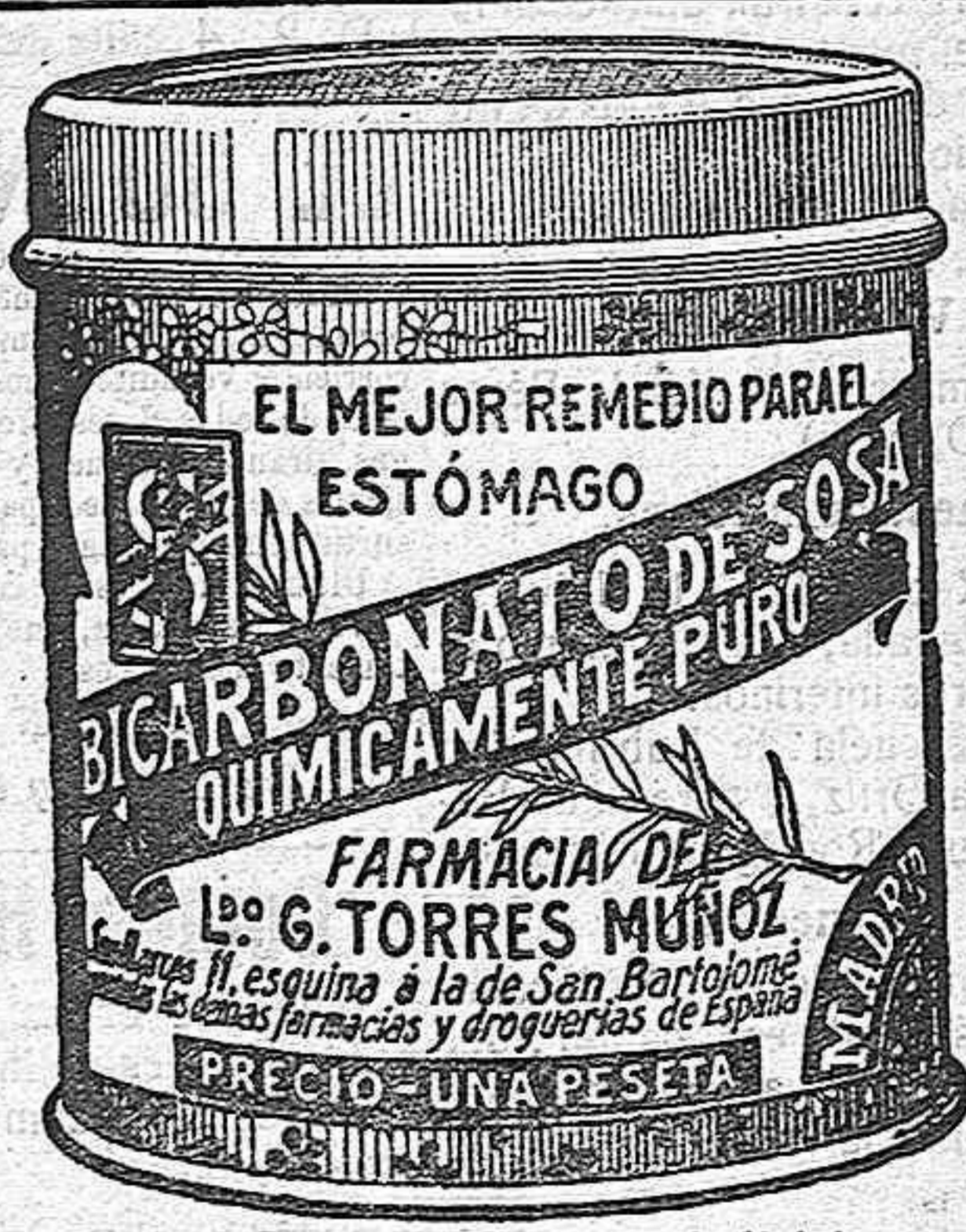
Latas más económicas, 5 pesetas.

Cuidado con las imitaciones que son perjudiciales.