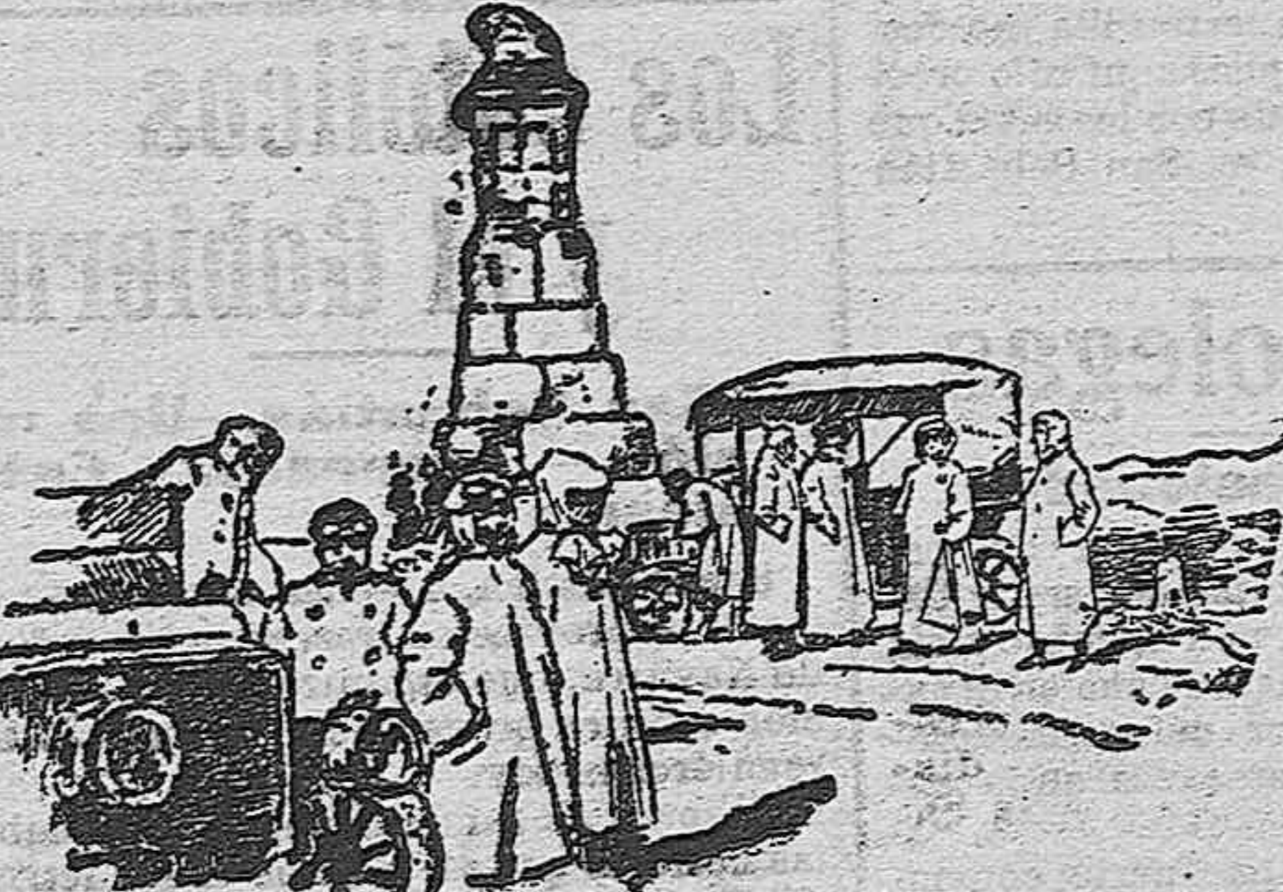
En el Alto del León

tas, con una pendiente media de 10 por 100, que es preciso andar para subir a él. El camino es harto peligroso, por la serie de pendientes rápidas y llenas de peligros que existen, tanto por la parte de Segovia como por la de Madrid; pero una vez en el alto del puerto, si el turista no ha llegado a él con algún hueso roto y sin contusiones de importancia, puede gozar de un panorama grandioso, de horizontes tan variados como extensos, cuya contemplación bien vale los peligros que se han sorteado al ascender, y además, lo que es muy estimable en estos meses de calor, de una temperatura agradableísima por lo fresca».