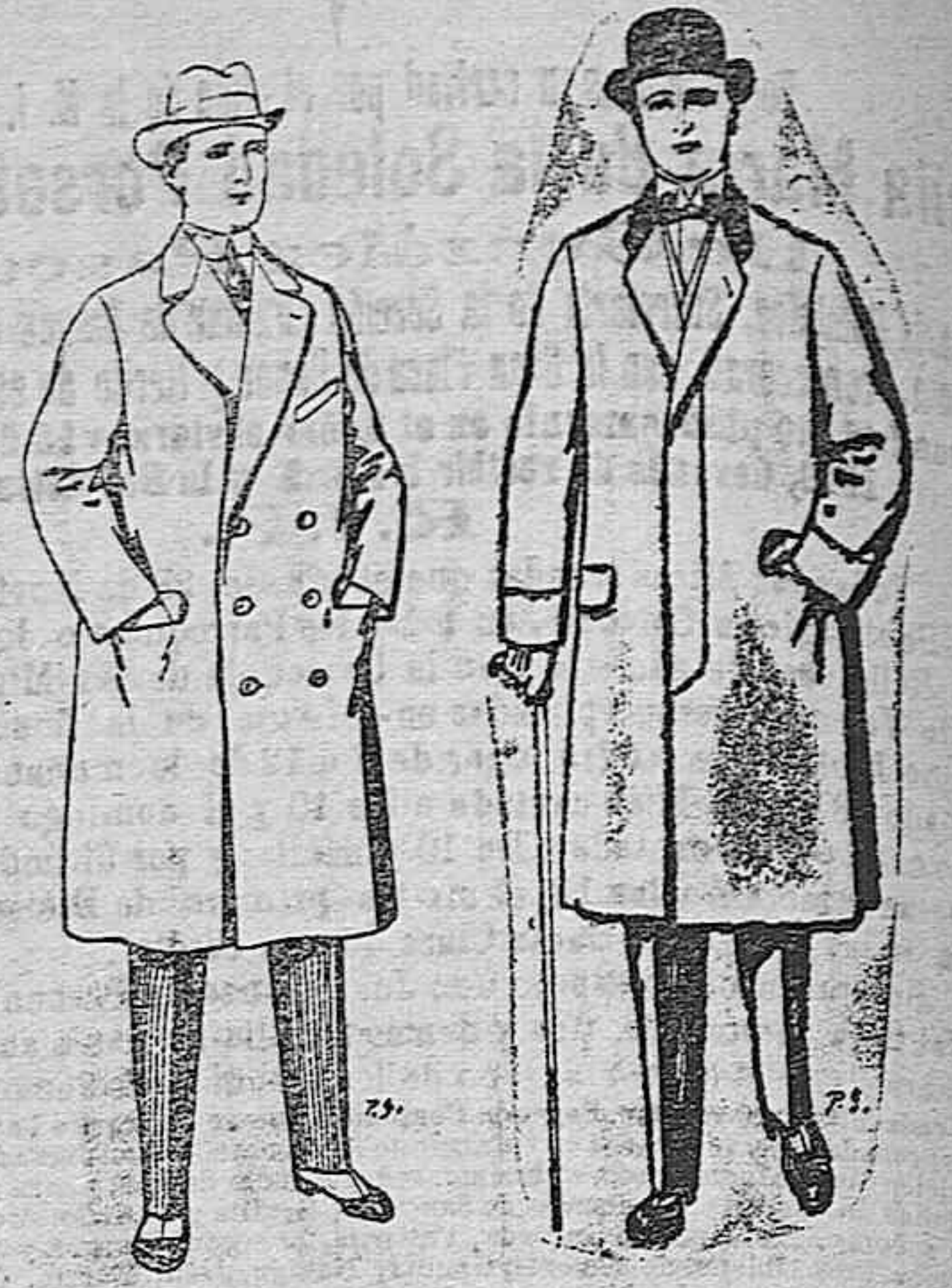
Gabanes de patén y de cheviot De ptas. 55 a 105