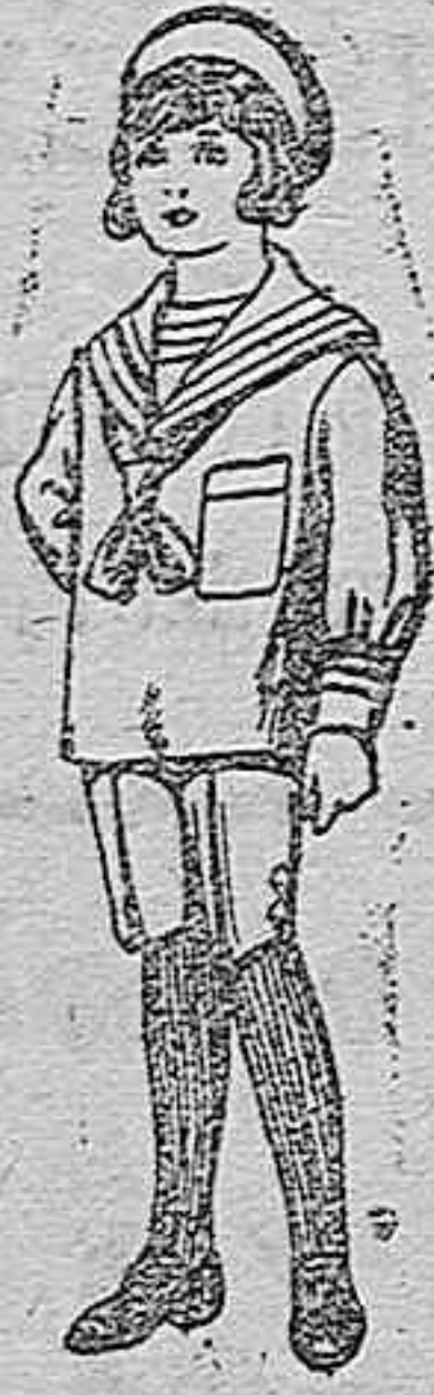
Traje de jerga azul, bordado oro en la manga para niños de 4 a 9 años De ptas. 20 a 22.