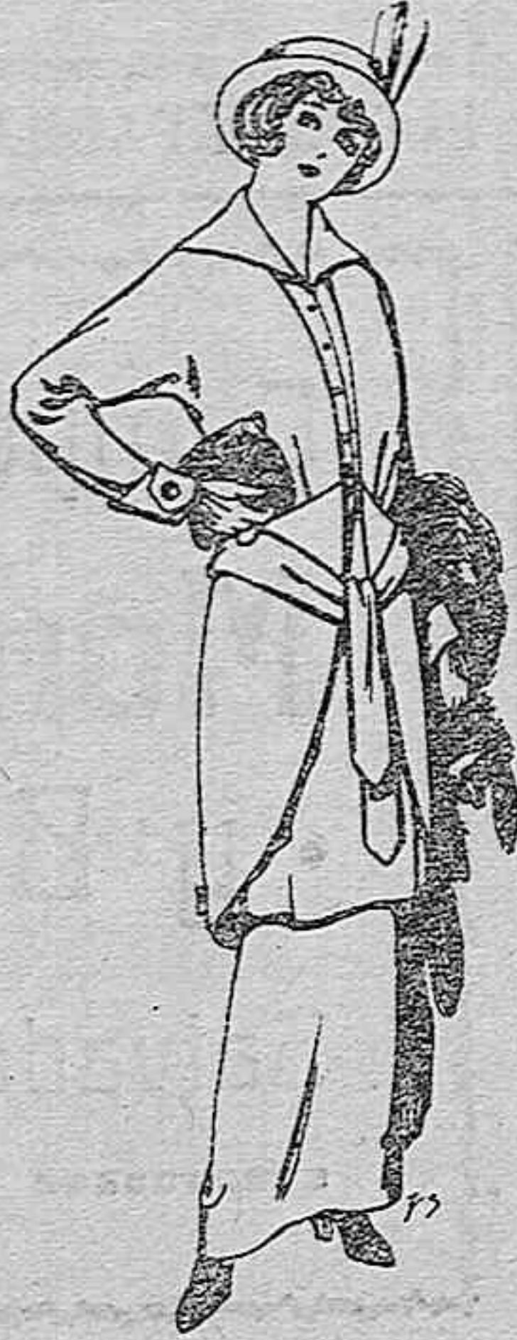
Trajes de jerga negra y azul para señora Ptas. 85