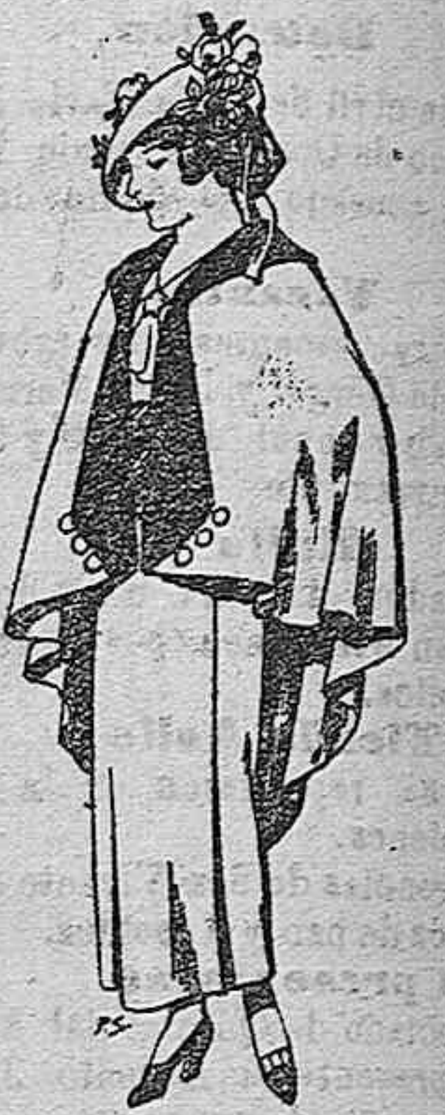
Capas de lana para jovencitas de 13 a 16 años Ptas. 25

Instalaciones para riegos y toda clase de industrias