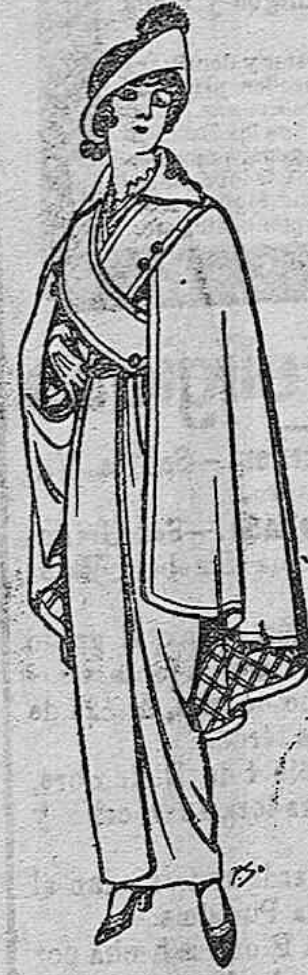
Capas de lana negra para señora Ptas. 16