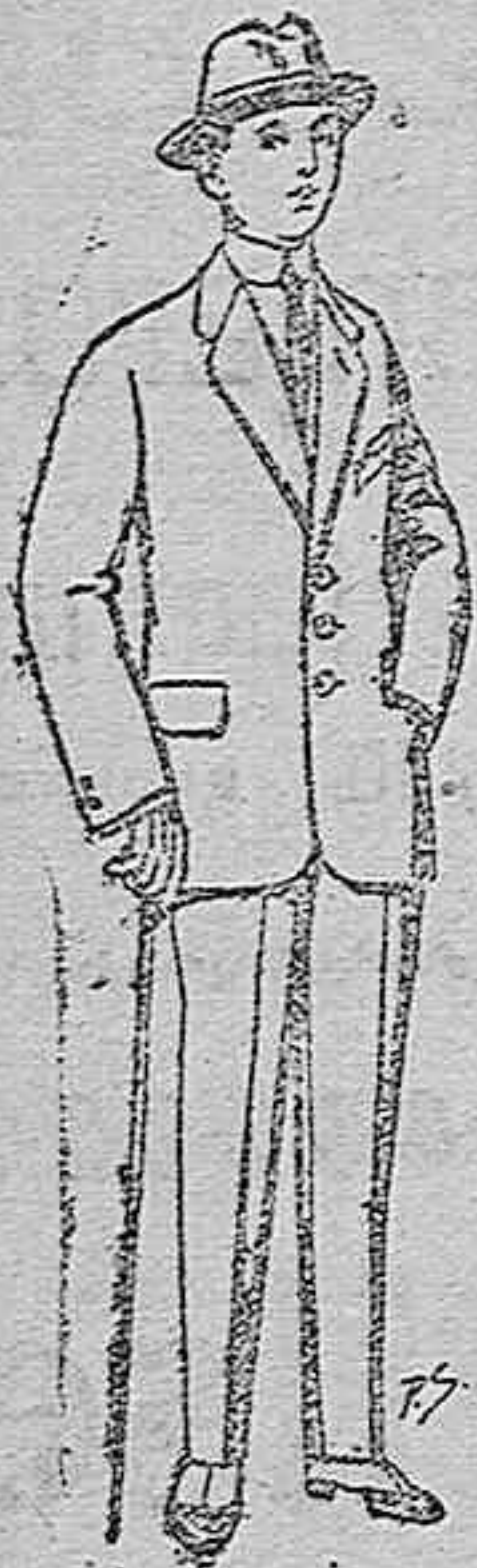
Trajes de patén vi- cuña o jerga para niños de 10 a 16 años De ptas. 1 a