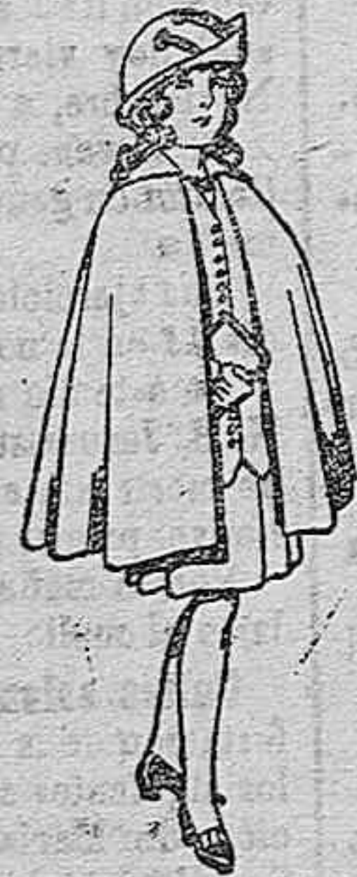
Capas de lana para niñas de 4 a 12 años. De ptas. 20 a 22