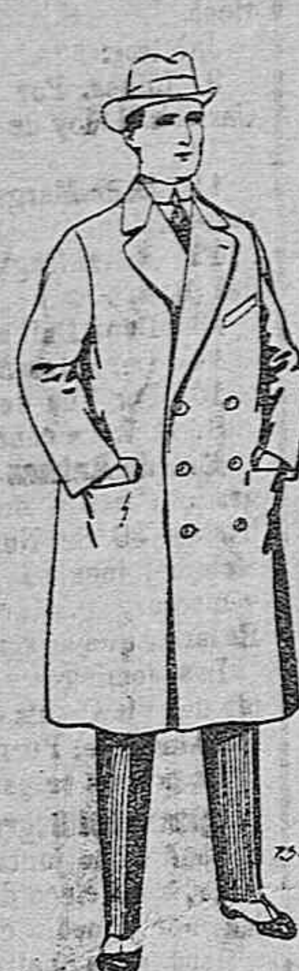
Gabanes de patén y de cheviot De ptas. 55 a 105