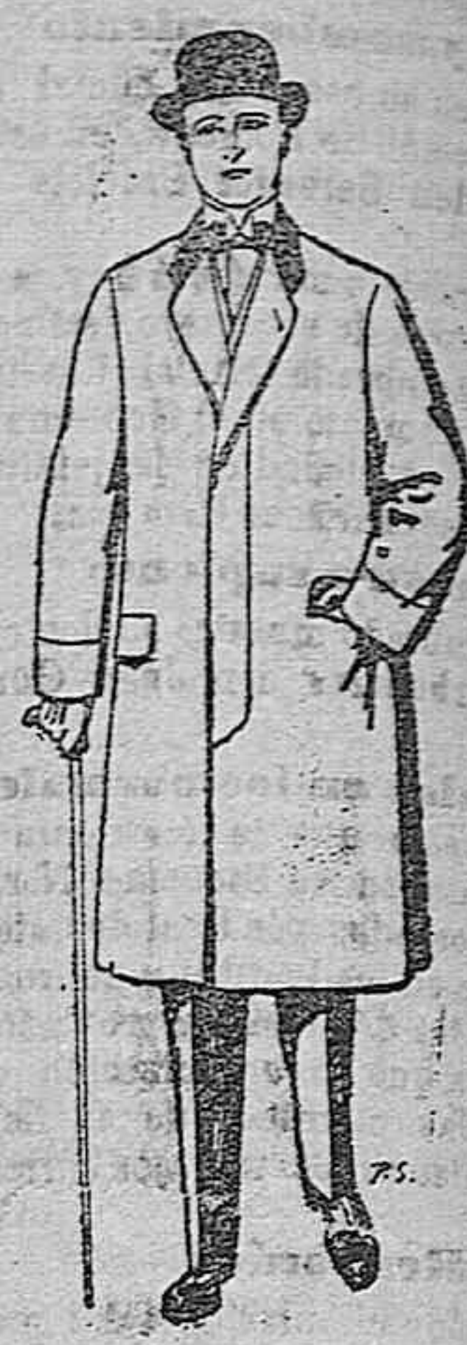
Gabanes de patén melton y cheviot De ptas. 25 a 100