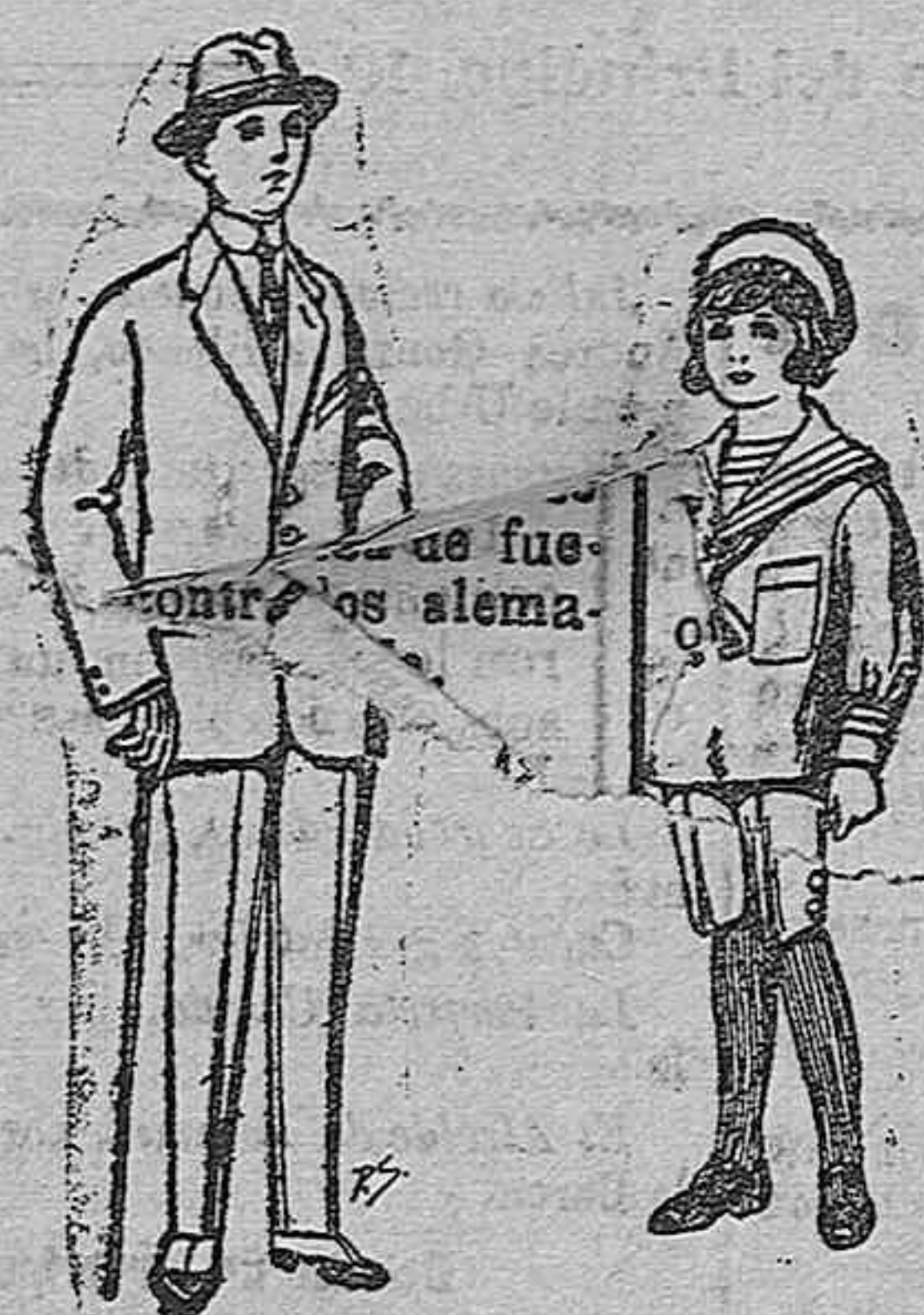
Trajes de patén vi- cuña o jerga para niños de 10 a 16 años De ptas. 13 a 48