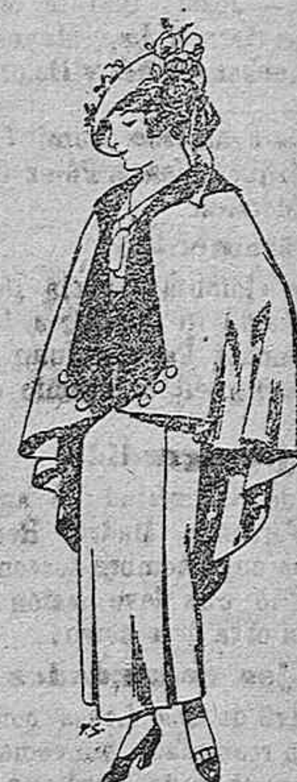
Capas de lana para jovencitas de 13 a 16 años Ptas. 25