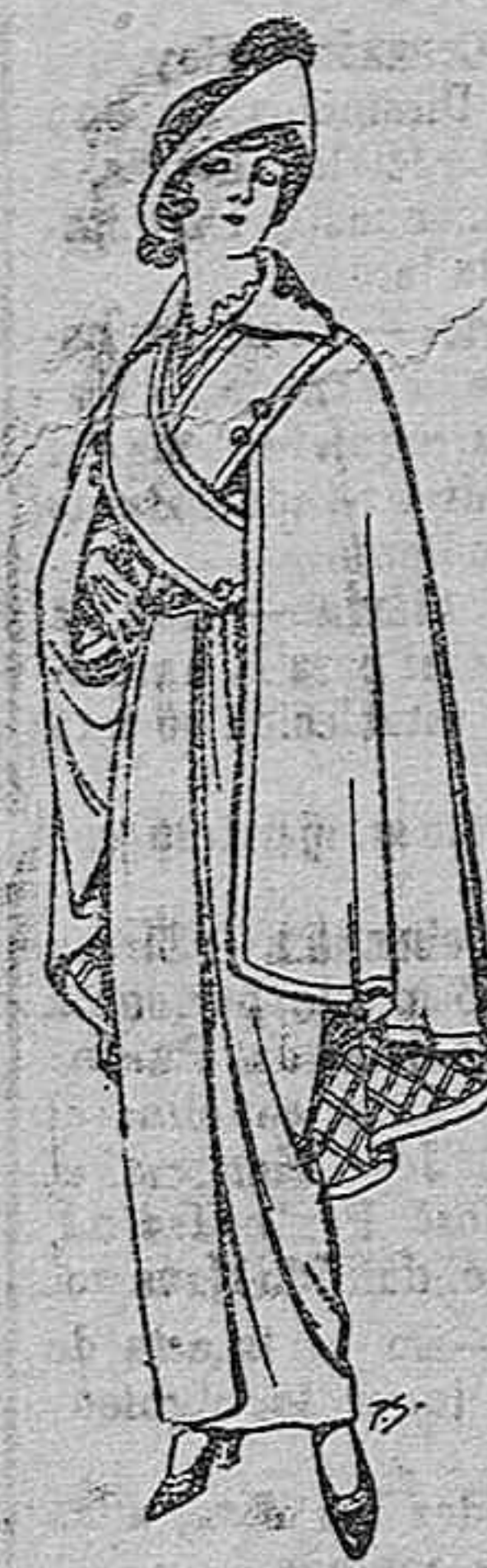
Capas de lana negra para señora. Ptas. 16