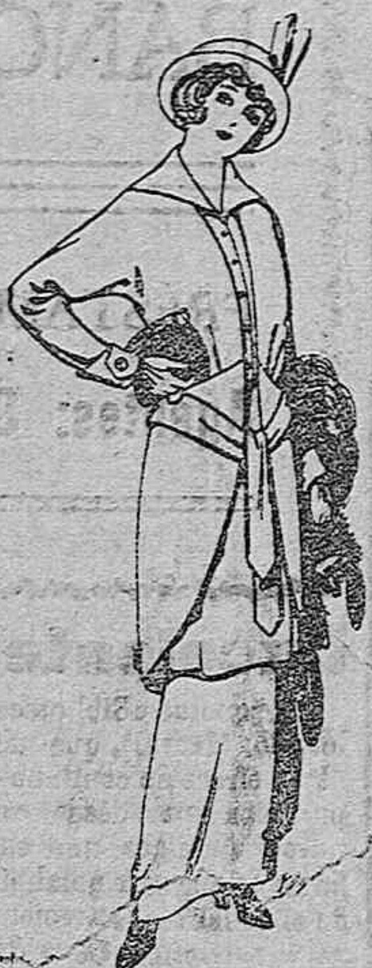
Trajes de jerga negra y azul para señora Ptas. 85