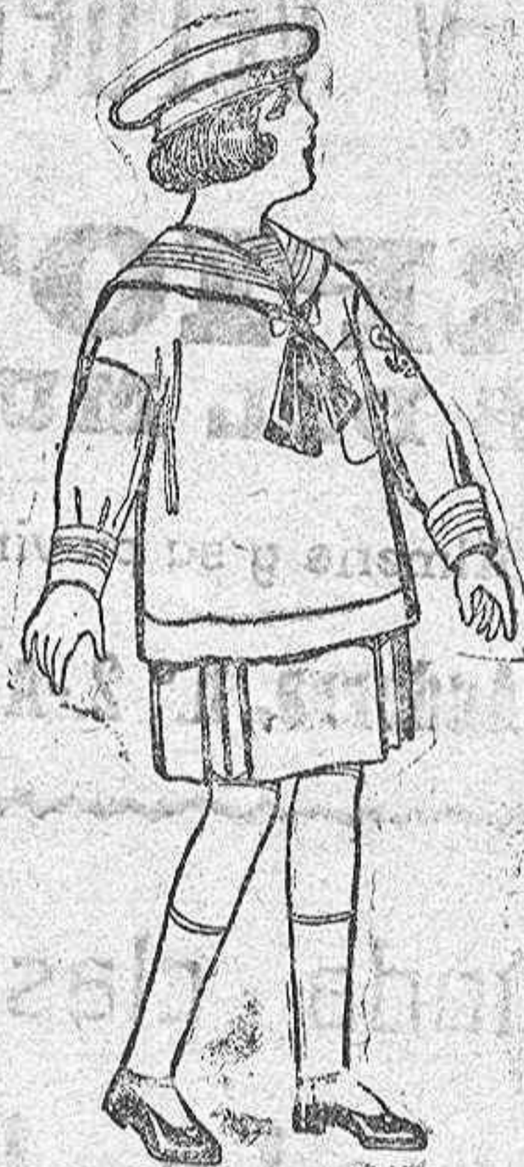
Trajes de marinera de sarga inglesa, para niñas de 4 a 9 años. De ptas. 35 a 43.