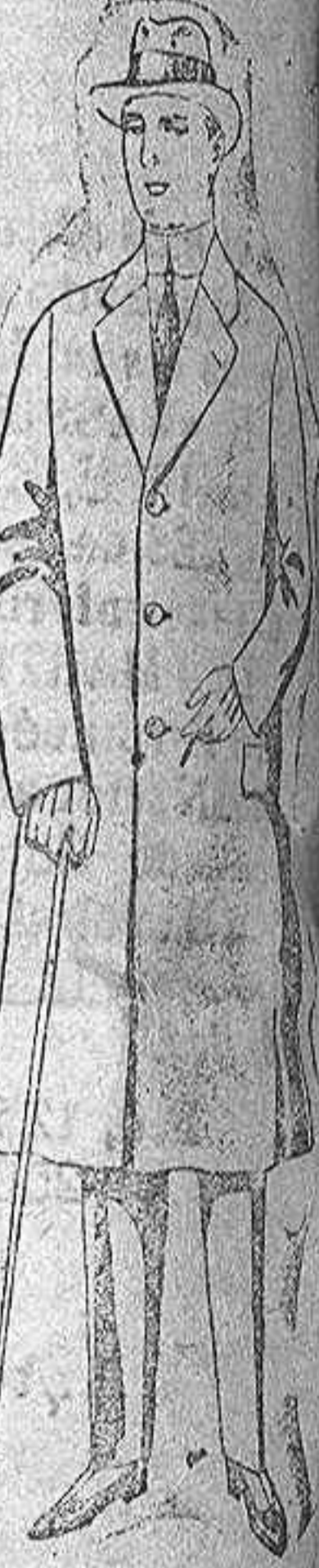
Gabanes de paten, mel'tón o cheviot con forro de seda o saten. De ptas. 47 a 115.