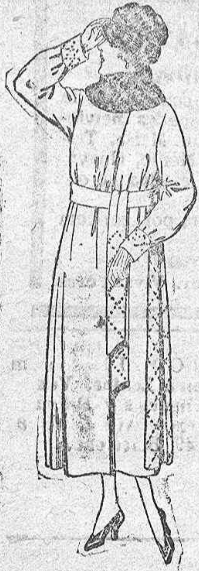
Abrigos de pañete, gamuza, etc., en negro, azul y color, cuello piel. De ptas. 100 a 120.