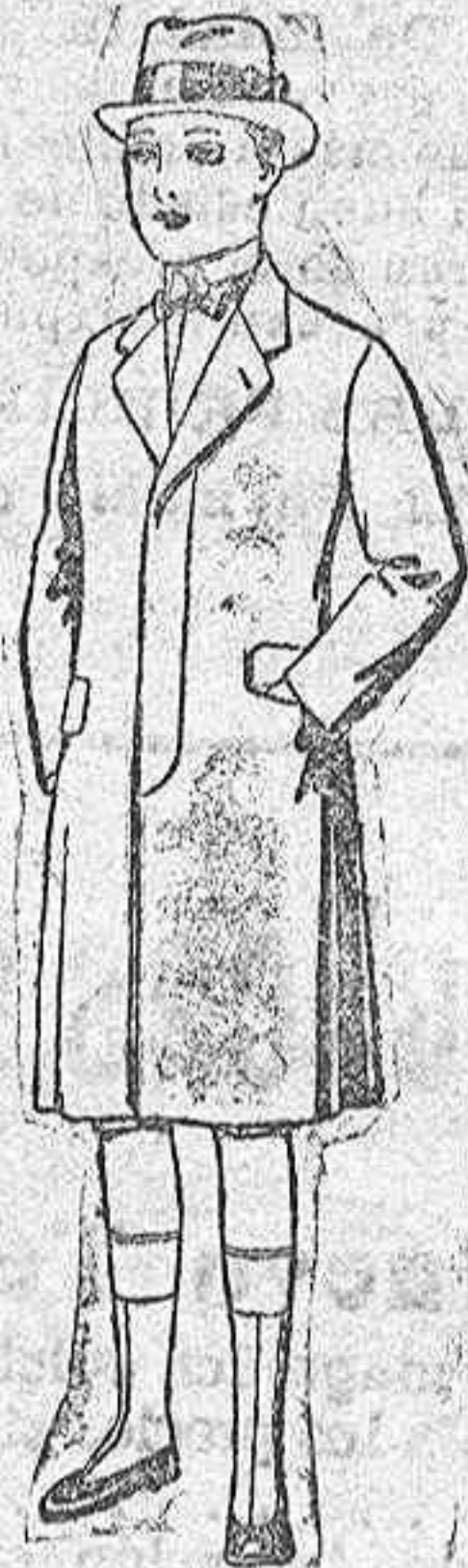
Gabanes paten para niños de 4 a 9 años. De ptas. 16 a 45.