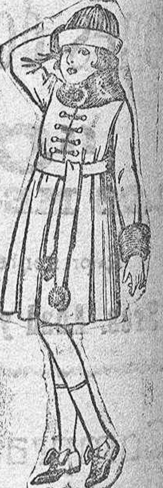
Abrigos cheviot, pañete, etc., color, cuello y bocamangas piel, para niñas de 7 a 15 años. De ptas. 46 a 49.