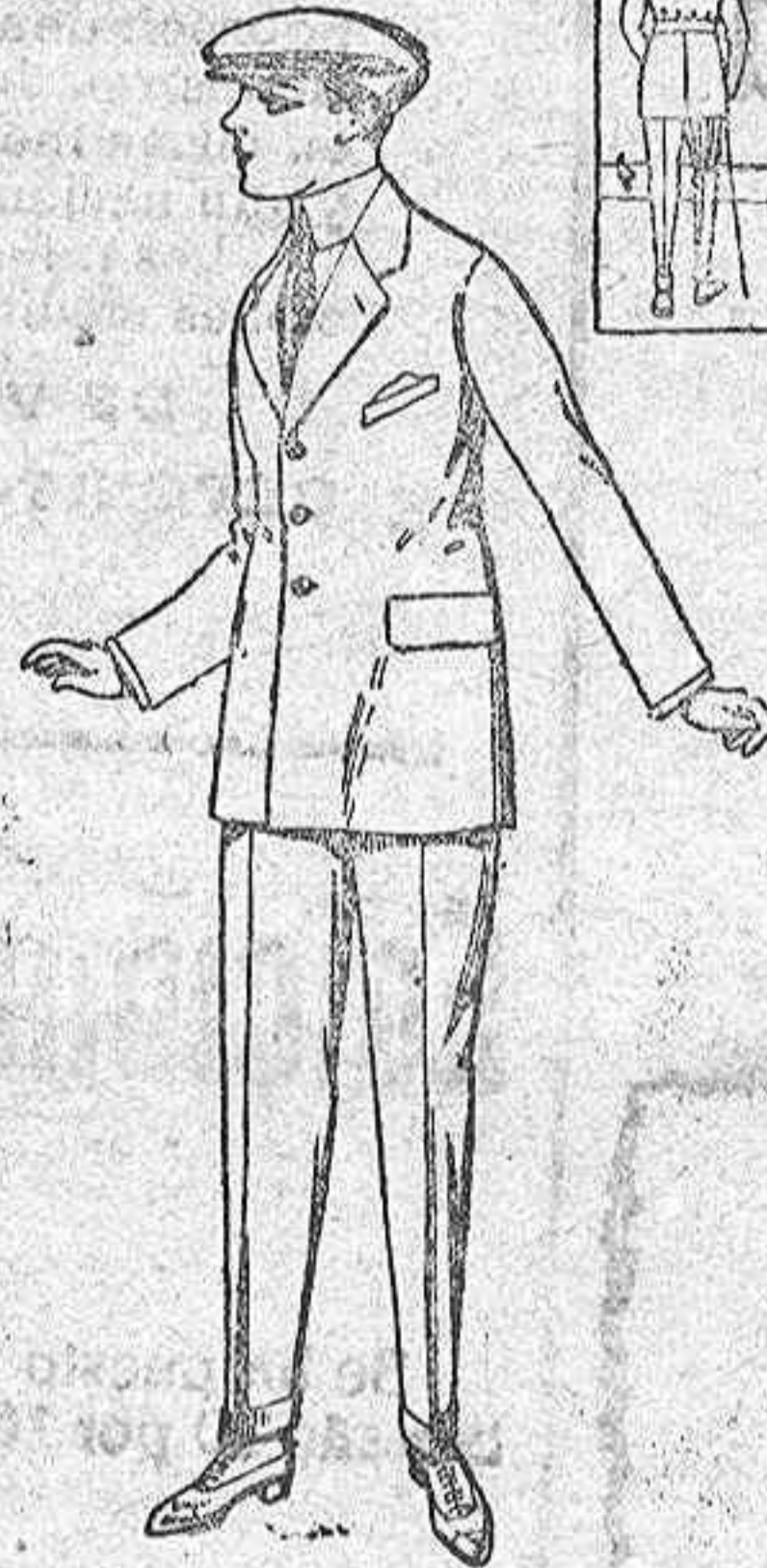
Trajes Sport, en cheviot, dibujos novedad para niños de 10 a 15 años. De ptas. 32 a 54.