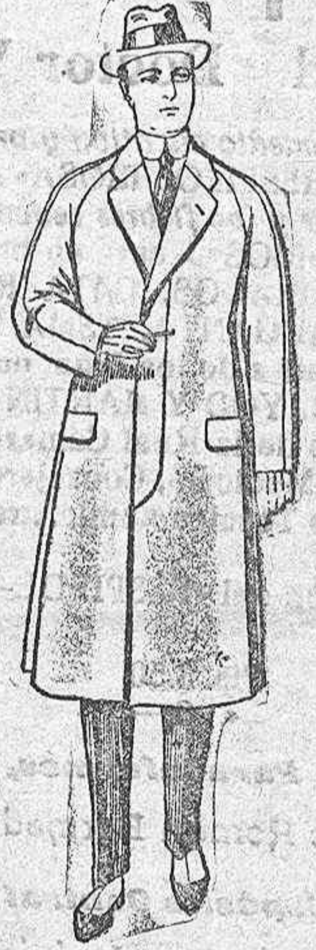
Gabanes de paten, mel'tón o cheviot, con forro de seda o saten. De ptas. 65 a 115.

Camisería, Generos de punto, Corbatería, Guantería, Sombrerería, Zapatería, Paraguas, Bastones, Artículos de Viaje y Peletería