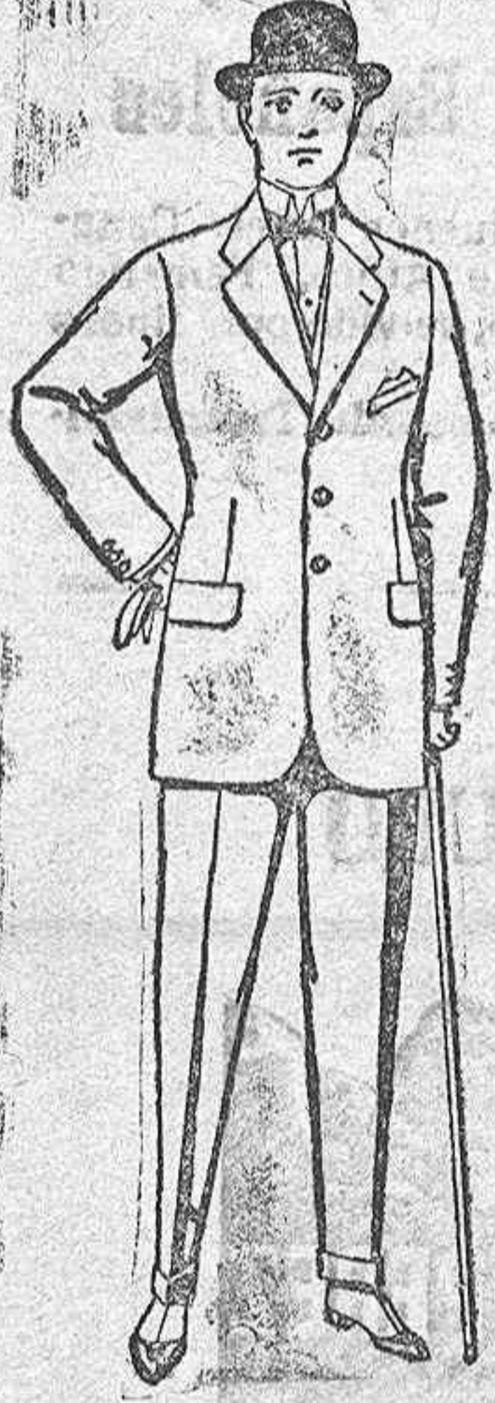
Trajes do cheviot, mel'tón, etc. De ptas. 28 a 95.

Madrid, Barcelona, Alicante, Bilbao, Cádiz, Cartagena, Gijón, Granada, Málaga, Palma de Mallorca, Santander, Sevilla, Valencia, Valladolid, Zaragoza.