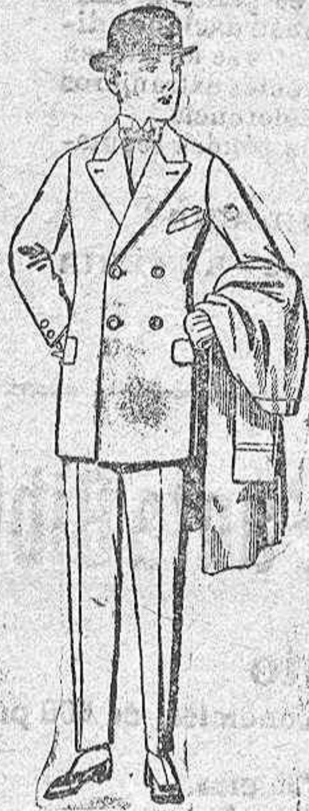
Trajes de cheviot, mel'tón, etc. para jovencitos de 10 a 16 años. De ptas. 25 a 60.