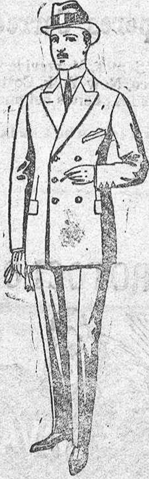
Trajes de cheviot, mel'tón, etc. De ptas. 28 a 95.

Ropas confeccionadas para Caballero, Señora, Niño y Niña