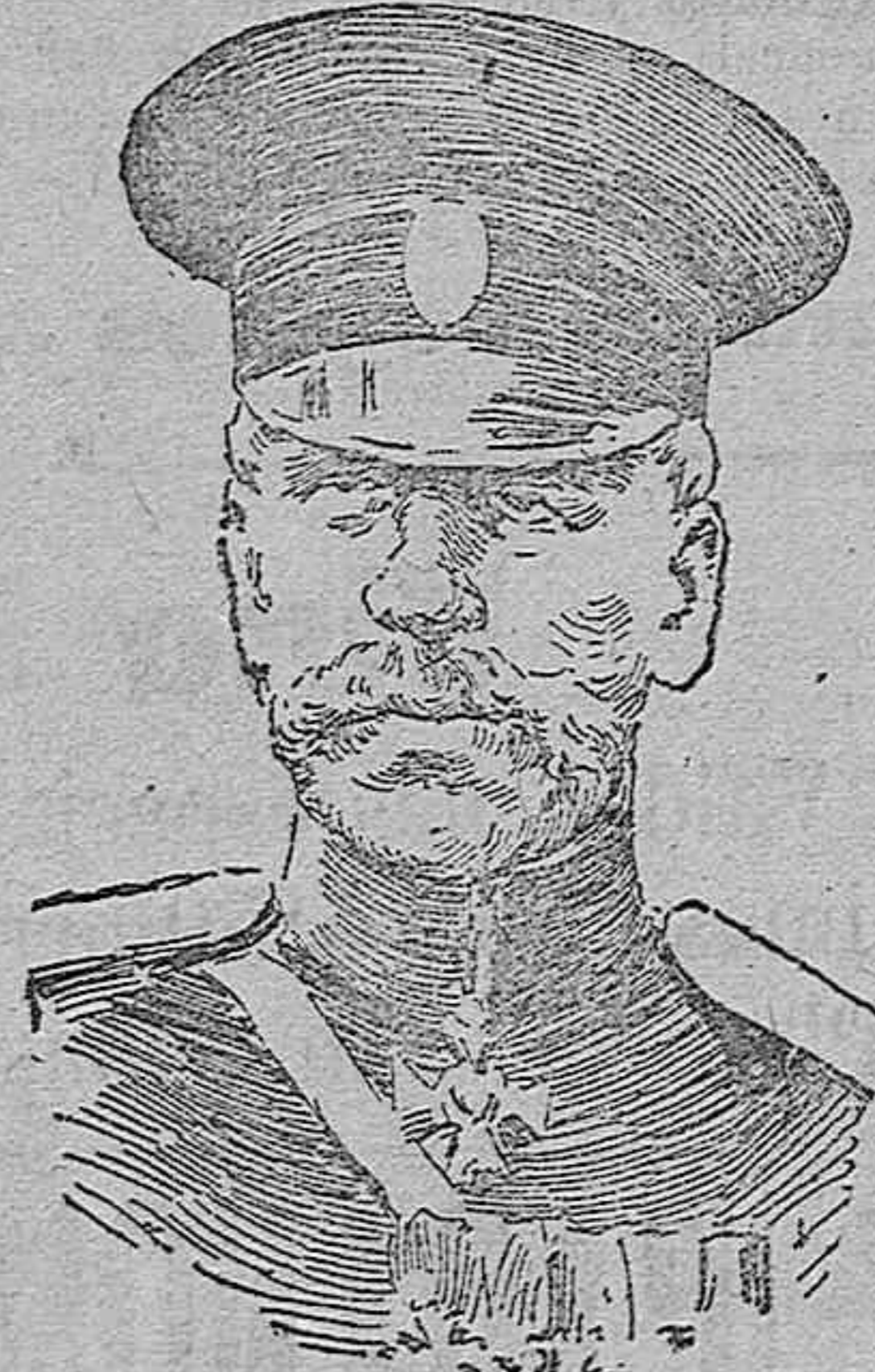
General Galinsky jefe de Estado Mayor, que opera al lado de las tropas francesas en Chateau-Thierry.