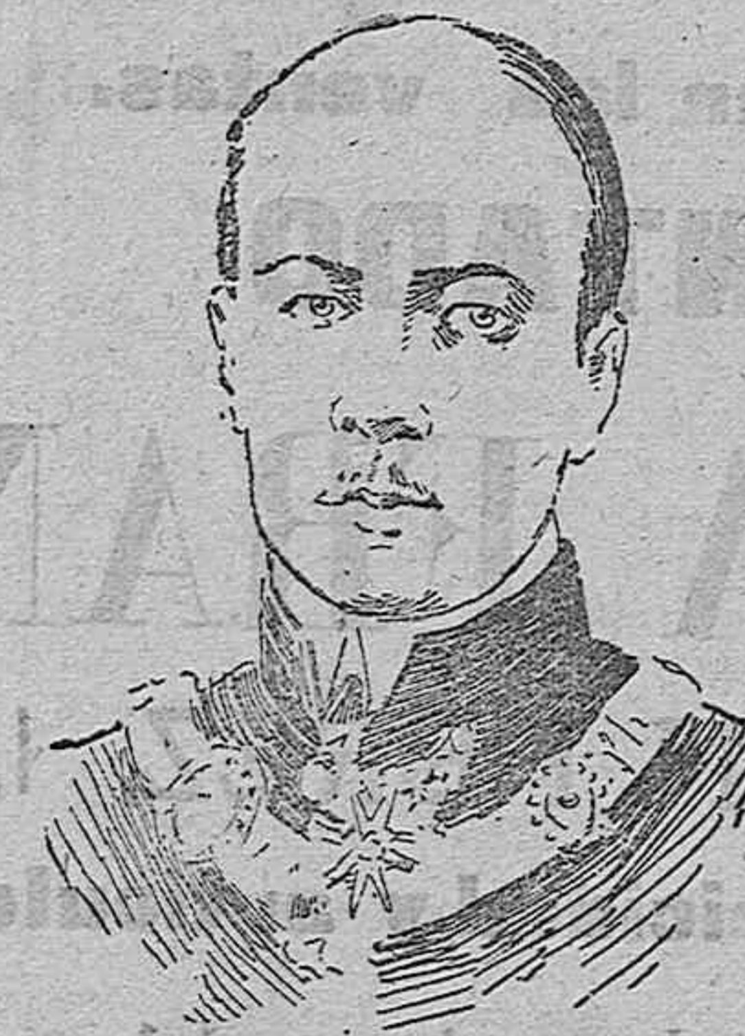
El conde Beschoth que ha sido asesinado por un guarda de caza en Praga.