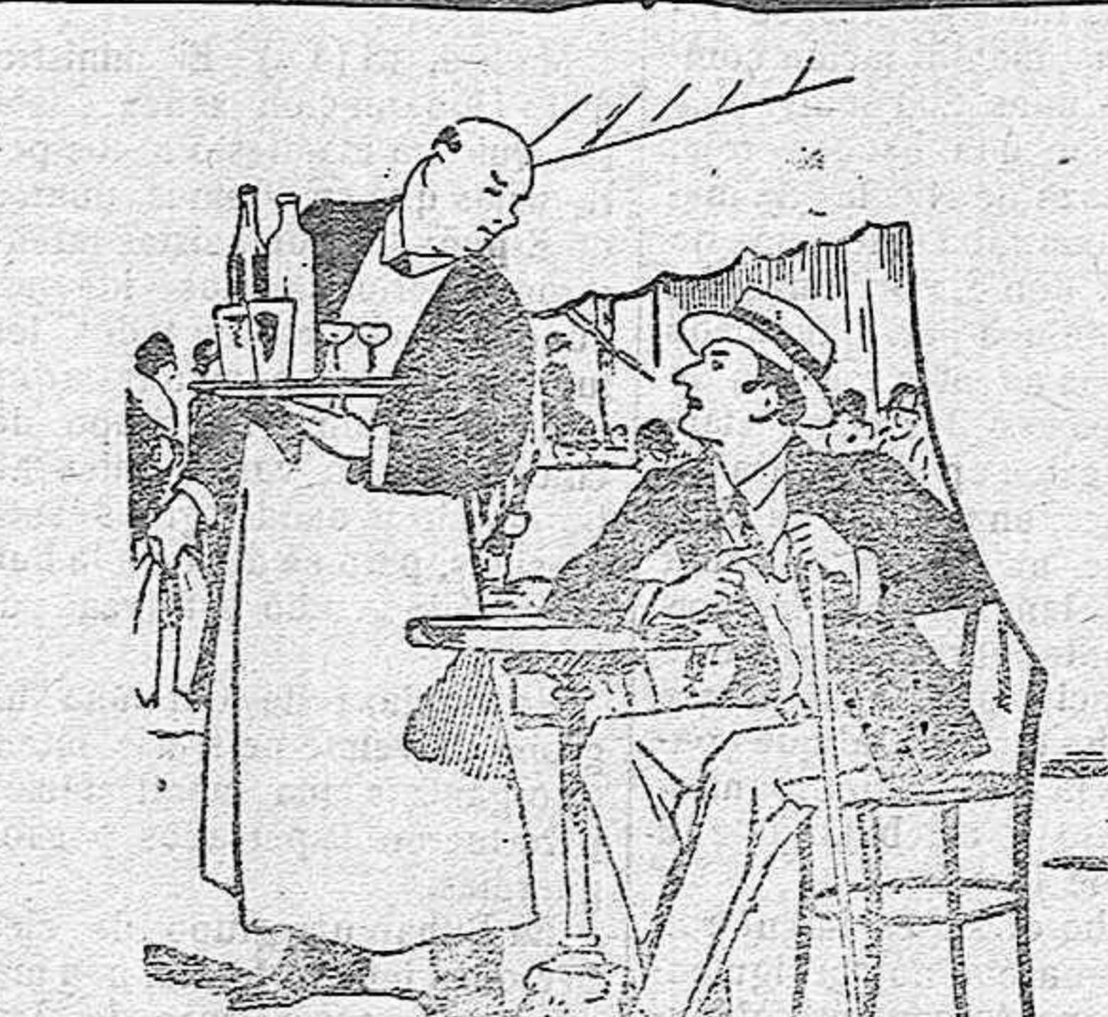
LAS CUCHARILLAS DE CAFE