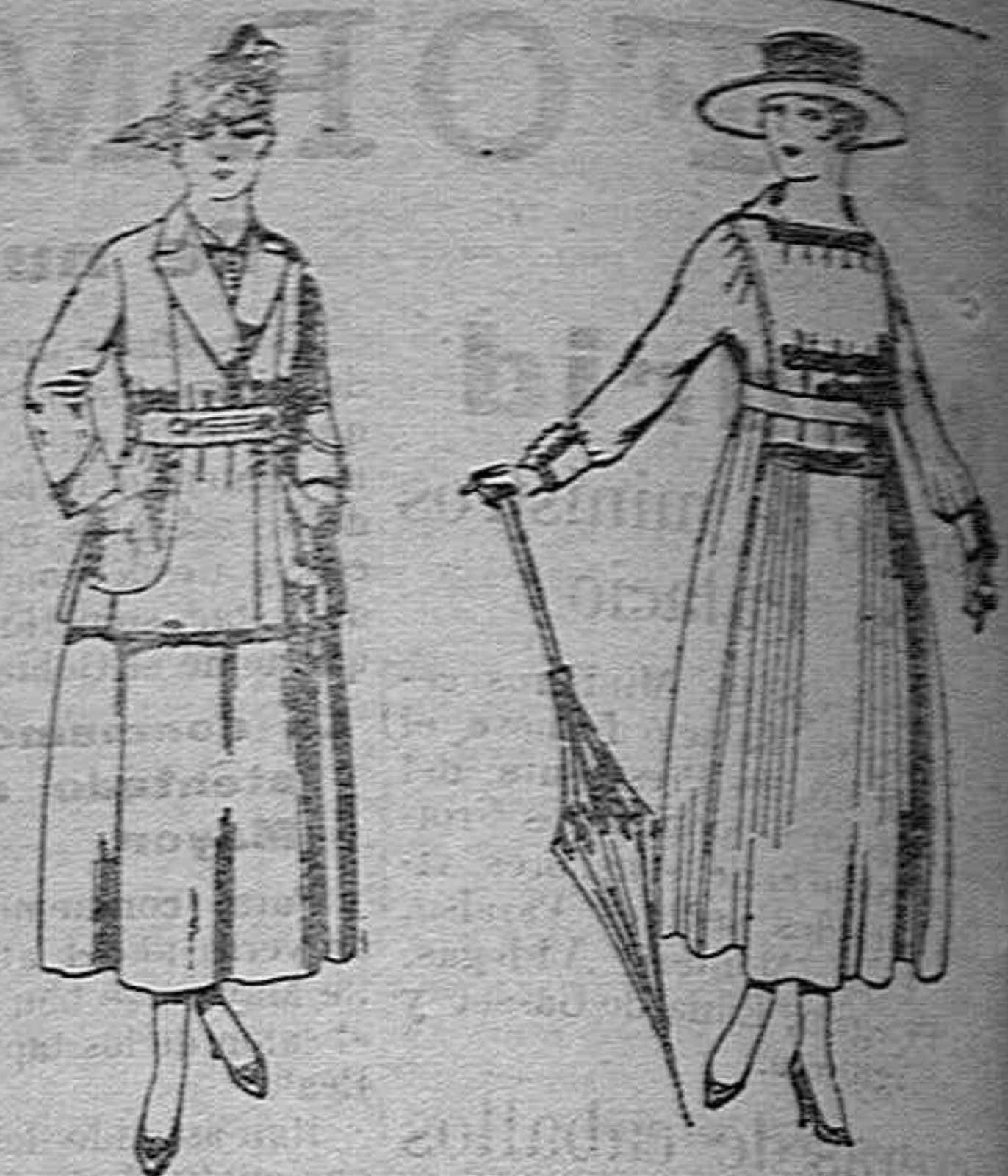
Vestidos de lanilla... Traje de estambre negro, azul y color.

SUCURSALES: Madrid, Barcelona, Alicante, Almería, Bi bao, Cádiz, Cartagena, Gijón, Granada, Málaga, Palma de Mallorca, Santander, Sevilla, Valencia, Valladolid, Zaragoza.