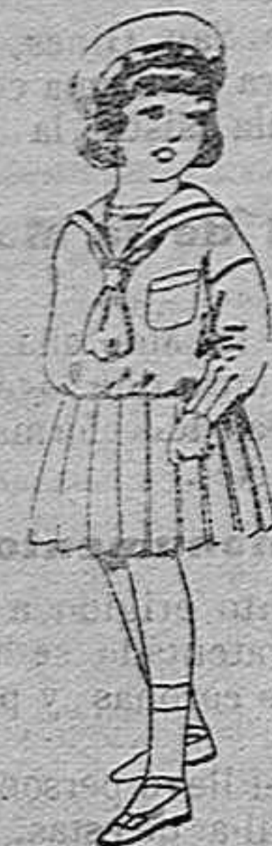
Tajes de marinera de lanilla azul para niñas de 4 a 9 años de pesetas 32 a 38 los mismos de dril blanco de 13 a 24 pesetas.