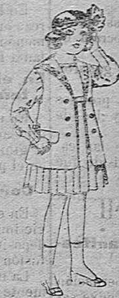
Traje de g bardina blanco, cuello de orbeñidá bordado, para niñas de 4 a 9 años. de pesetas 22 r 24.