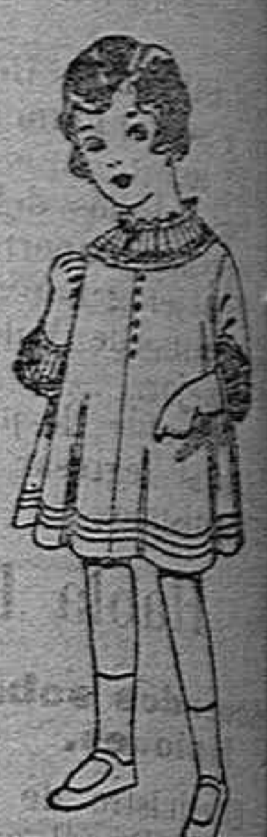
Vestidos blancos de lana o vicuña... de ptas. 6 75 a 10

Géneros del país y extranjeros para la Sección de Medida. Sombreros de paja de 2'50 a 12 pesetas.