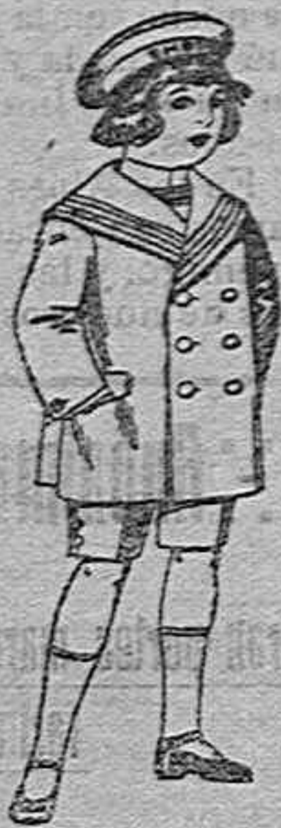
Tajes matelot de vicuña o jergal azul para niño de 4 a 9 años de 14 pesetas a 32.