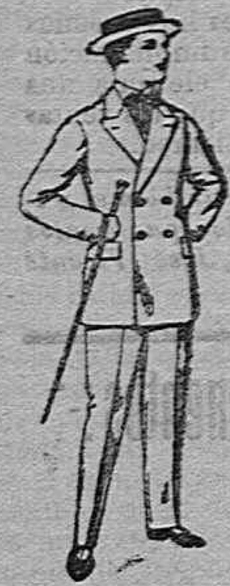
Traje de estambre, vicuña o jergal... de ptas 19 50.

Camisería, Géneros de punto, Corbatería, Guantería Sombrereria, Zapatería, Paraguas, Bastones y Artículos de viaje.