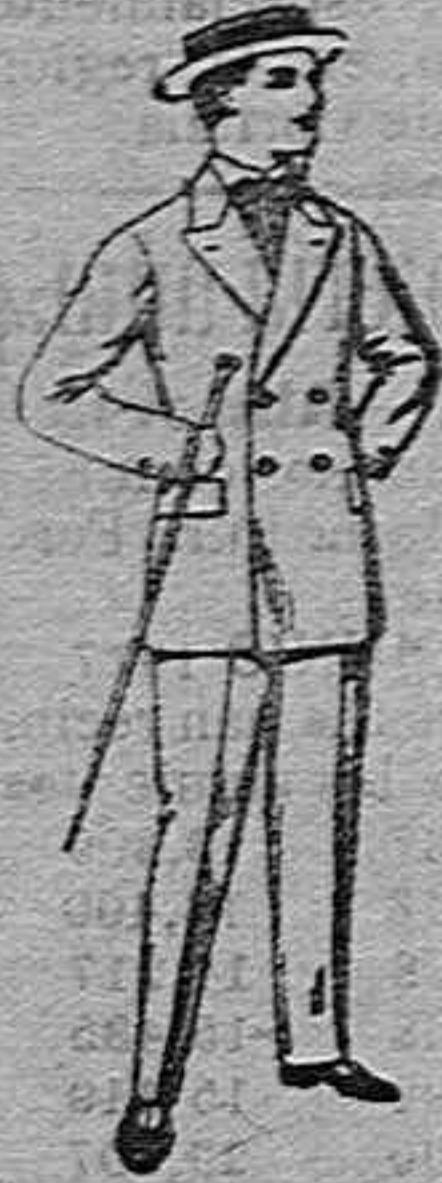
Traje de estambre, vicuña o jesga, para jovencito de 10 a 17 años. de ptas. 19 a 50.