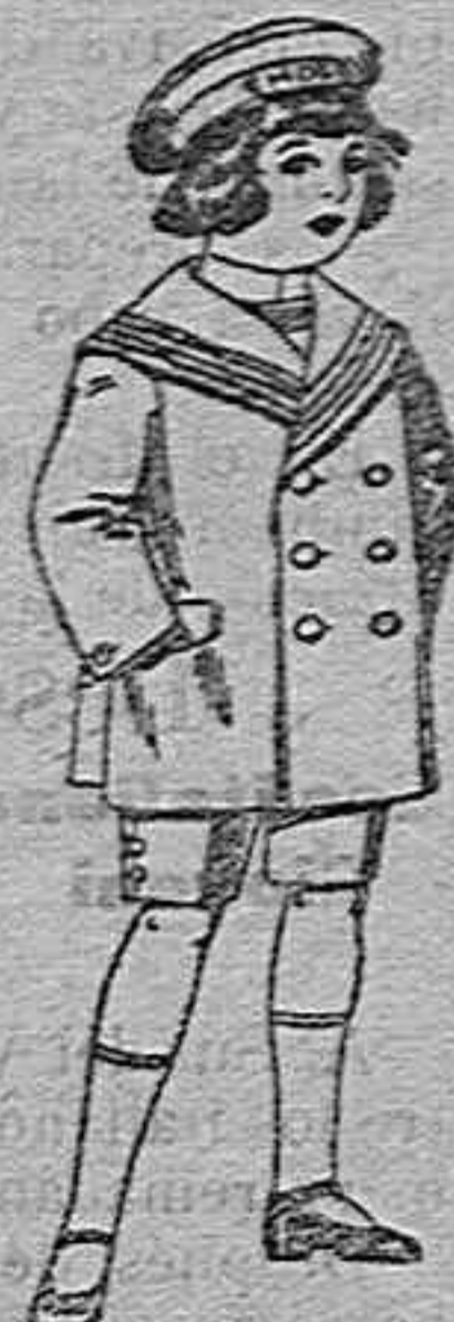
Trajes matelot de vicuña o jersal azul para niño de 4 a 9 años de 14 pesetas a 32.