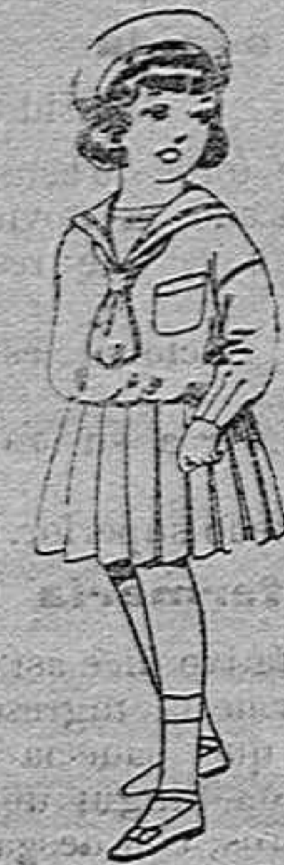
Trajes de marinera de lanilla azul para niñas de 4 a 9 años de pesetas 32 a 38 los mismos de dril blanco de 13 a 24 pesetas.