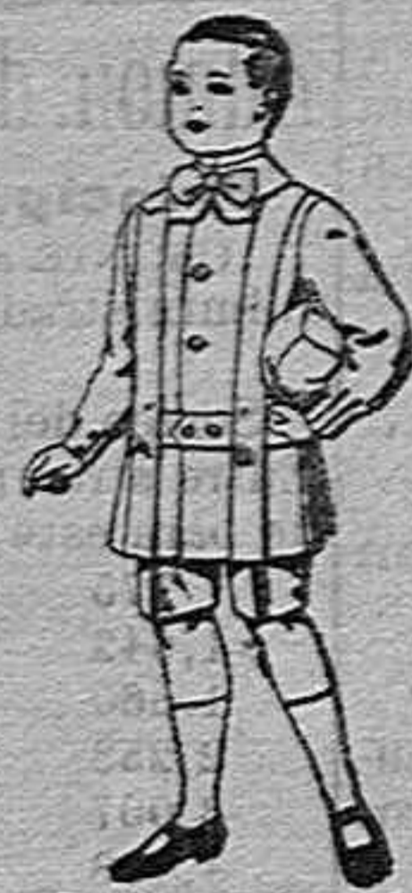
Trajes de lanilla para niños de 4 a 9 años. de ptas. 12 a 31