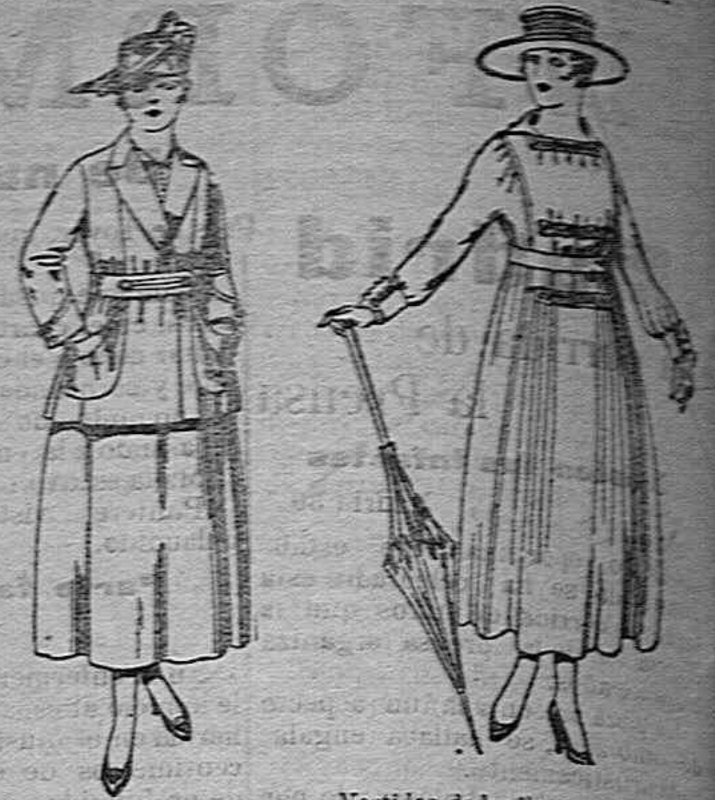
Traje de estambre negro, azul y color. de ptas. 70 a 70.

Camisería, Géneros de punto, Corbatería, Guantería Sombrereria, Zapatería, Paraguas, Bastones y Artículos de viaje.