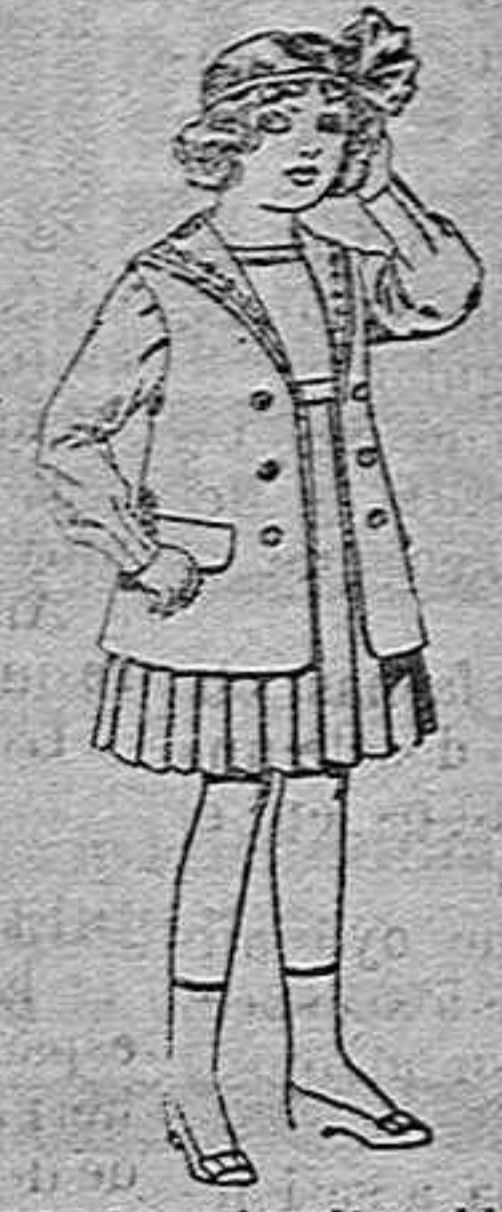
Traje de gardina blanco, cuello de orhandin bordado, para niñas de 4 a 9 años. de pesetas 22 a 24.