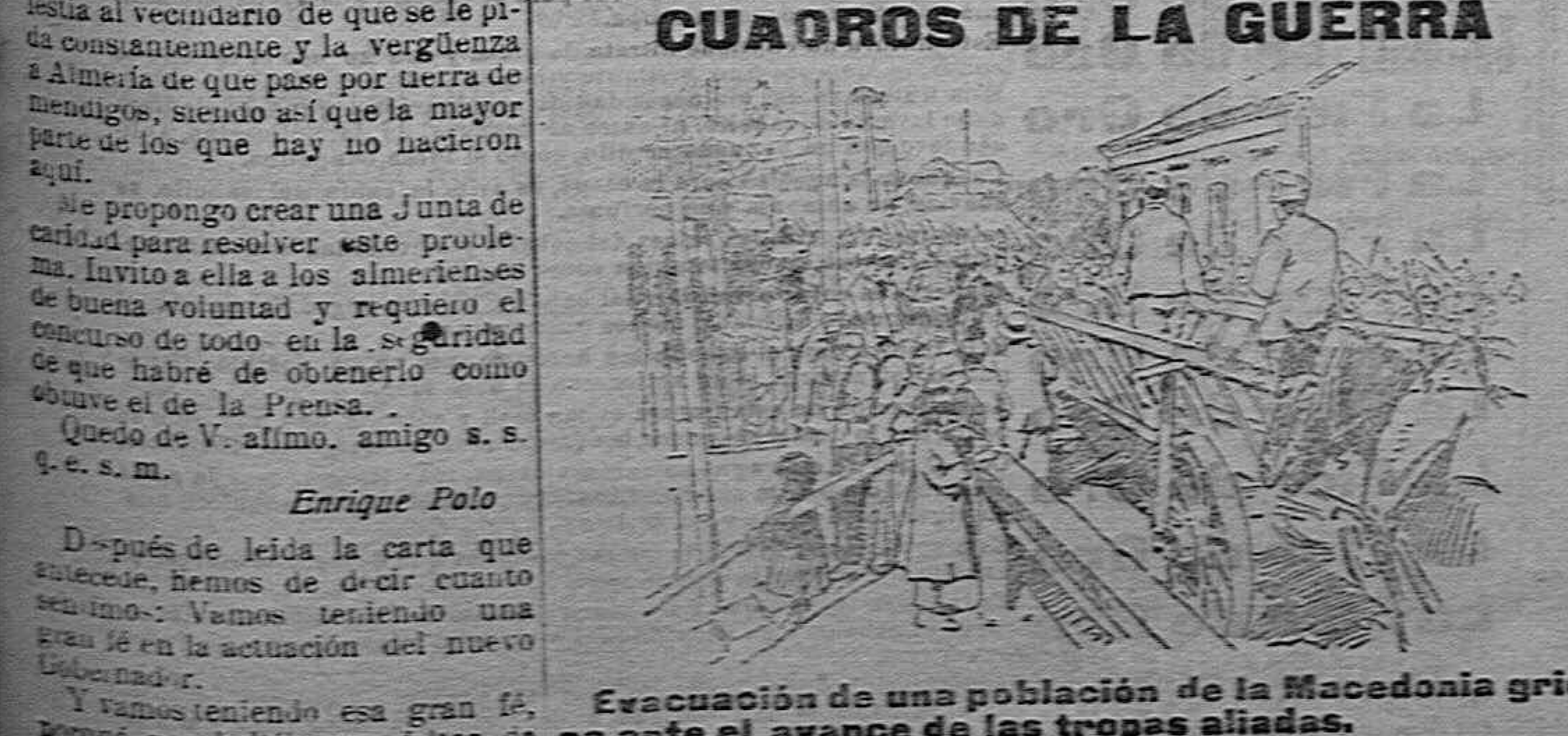
Evacuación de una población de la Macedonia griega ante el avance de las tropas aliadas.