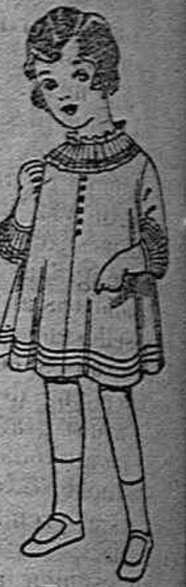
Vestidos de lana blanca bordada de ptas. 6 a 8 a 8

Géneros del país y extranjeros para la Sección de Medida. Sombreros de paja de 2.50 a 12 pesetas.