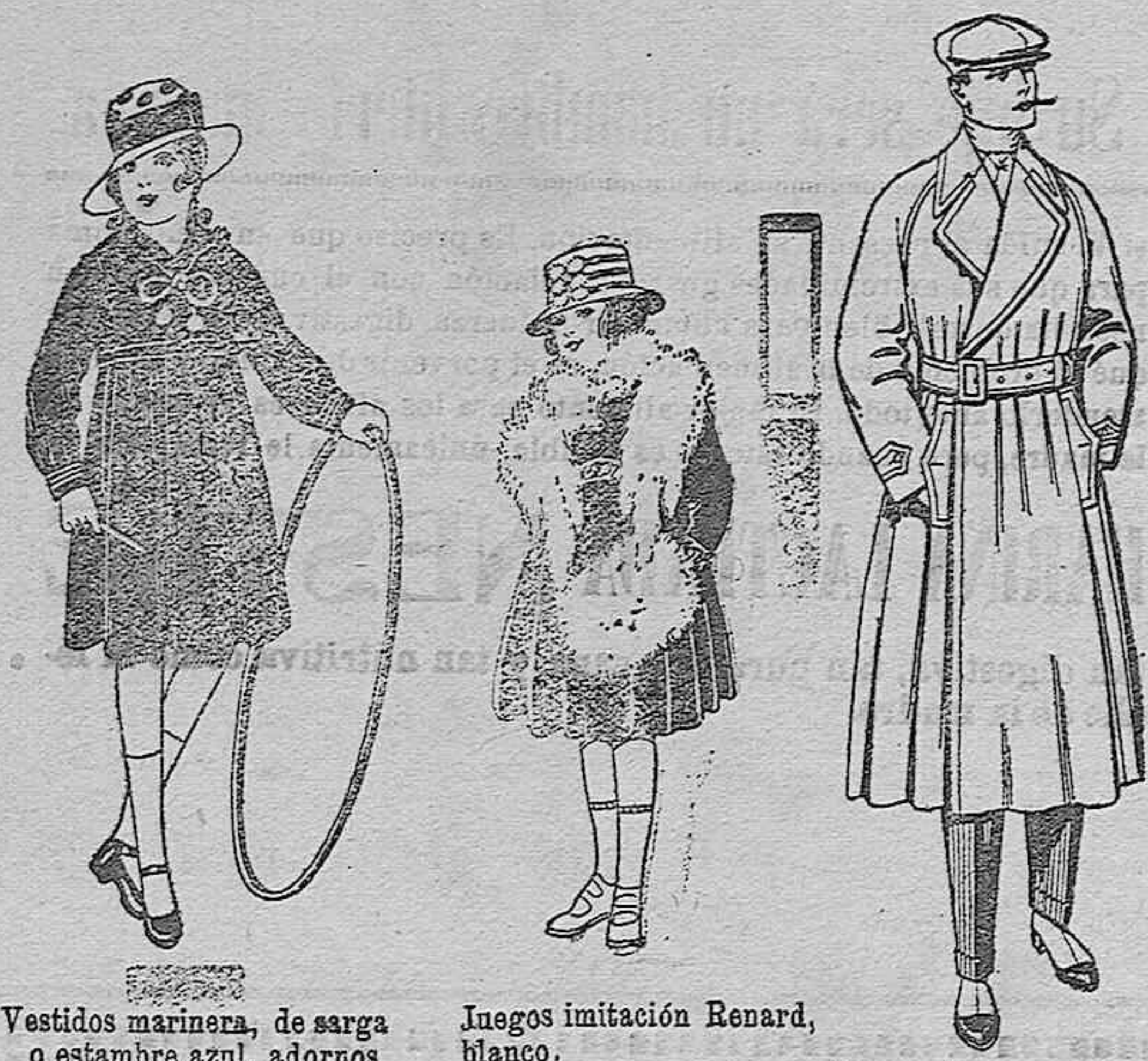
Vestidos marinera, de sarga o estambre azul, adornos sea blancos. De ptas. 25 a 30

PRECIO FIJO VENTA AL CONTADO Pídanse el catálogo general