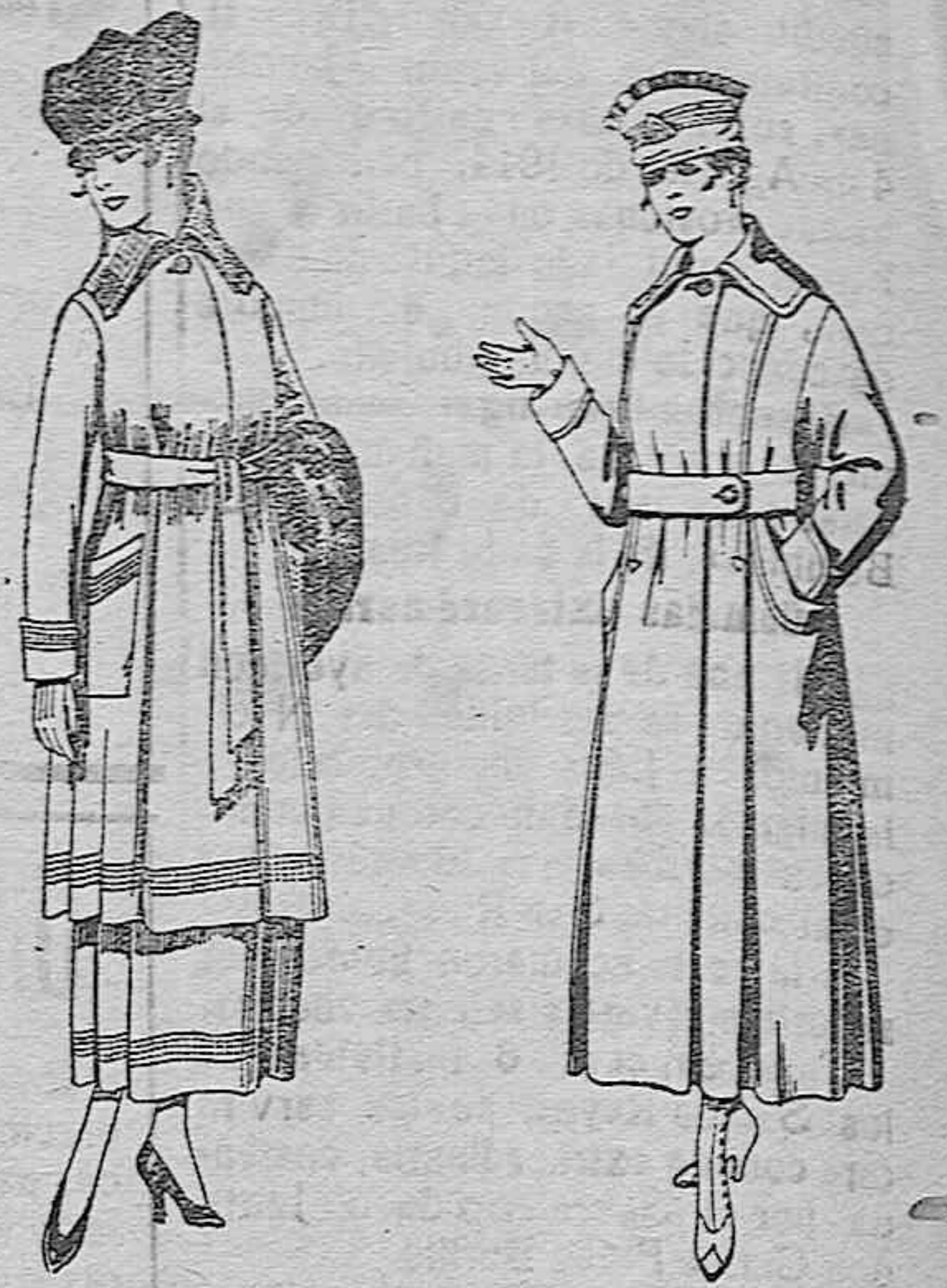
Trajes de sarga inglesa, en negro y azul, bordados. De ptas. 85 a 100