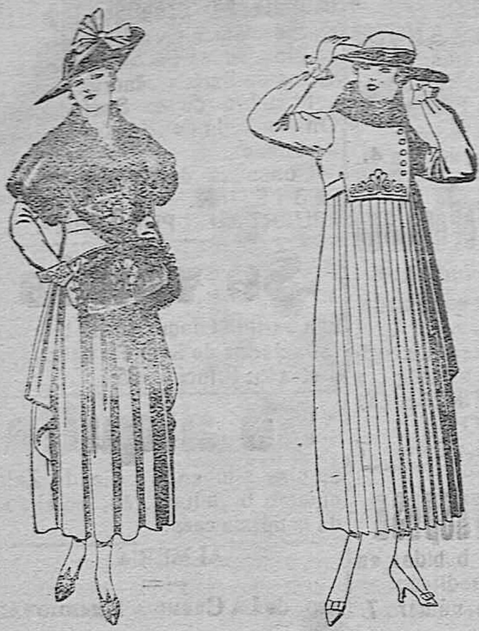
Juegos de pieles, negro, imitación Renard. Gran chic. A ptas. 58.

Ropas confeccionadas para caballero, señora, NIÑO Y NIÑA