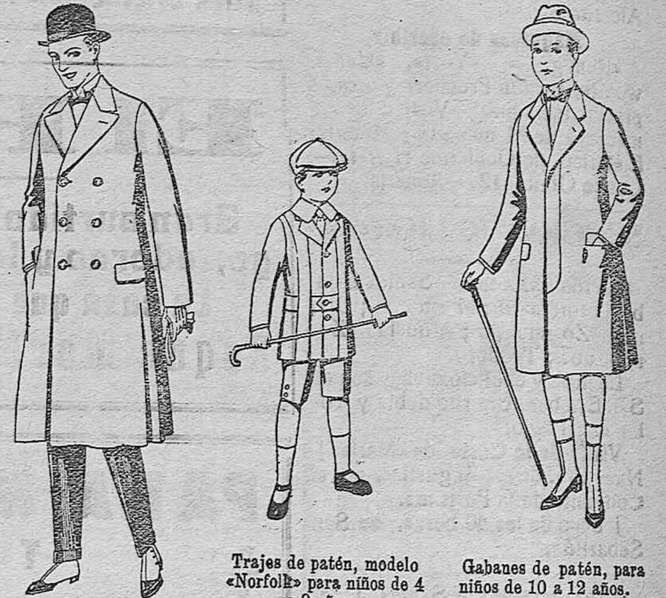
Gabanes de patén, gamuza o Cover. De ptas. 50 a 110