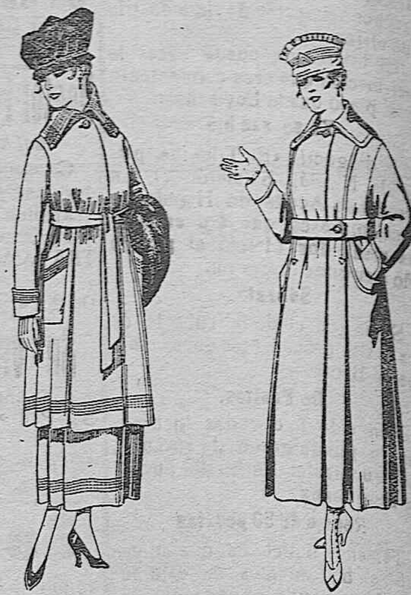
Trajes de sarga inglesa, en negro y azul, bordados. De ptas. 85 a 100