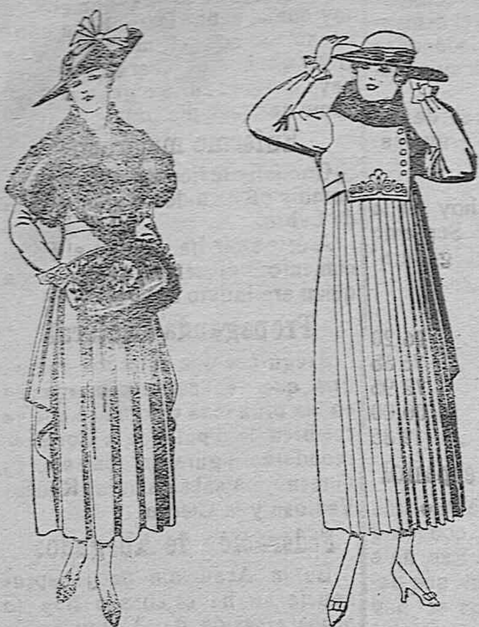
Juegos de pieles; negro, imitación Renard. Gran chic. A ptas. 58.

Ropas confeccionadas para caballero, señora, NIÑO Y NIÑA