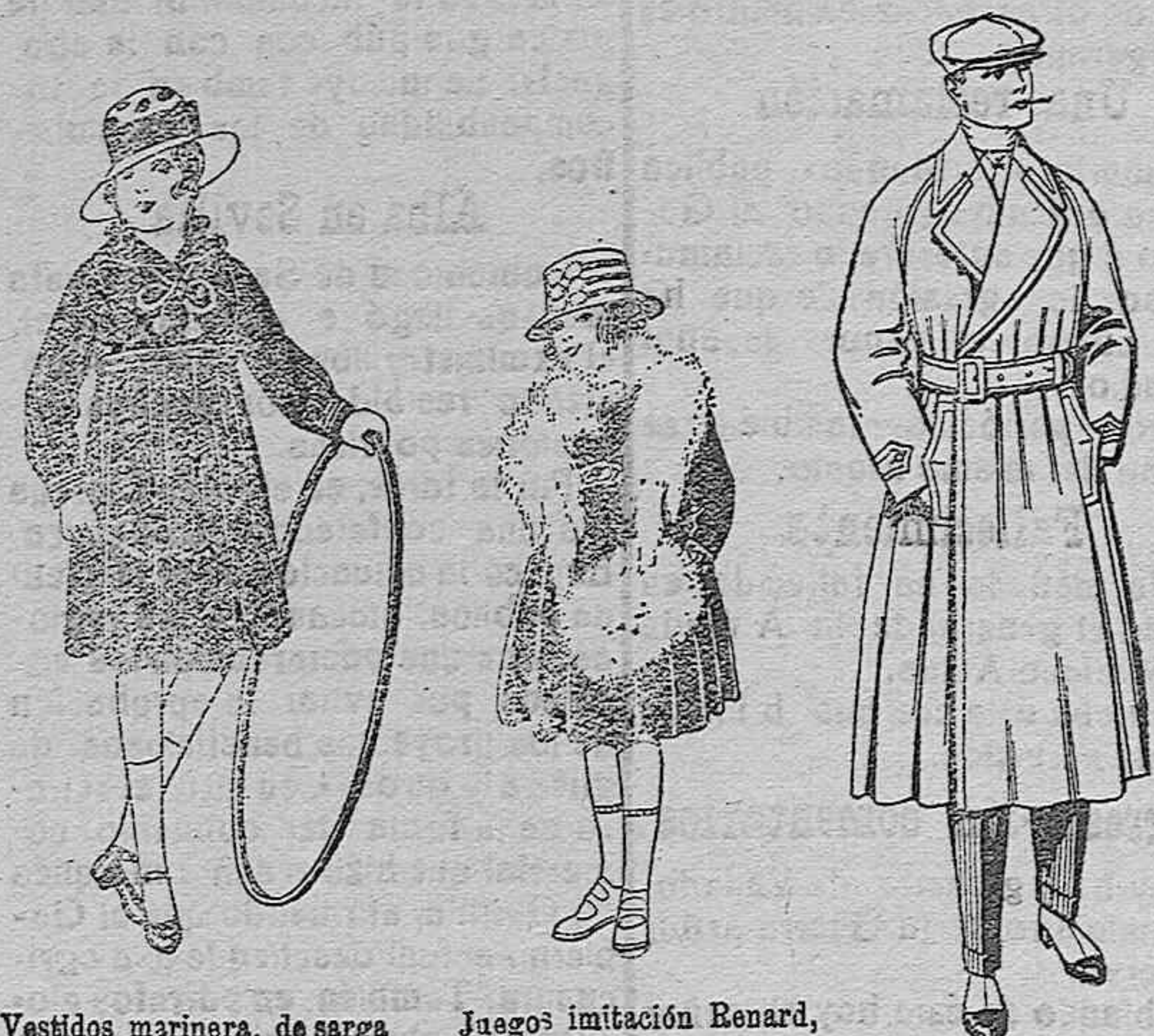
Vestidos marinera, de sarga o estambre azul, adornos seda blancos. De ptas. 25 a 30