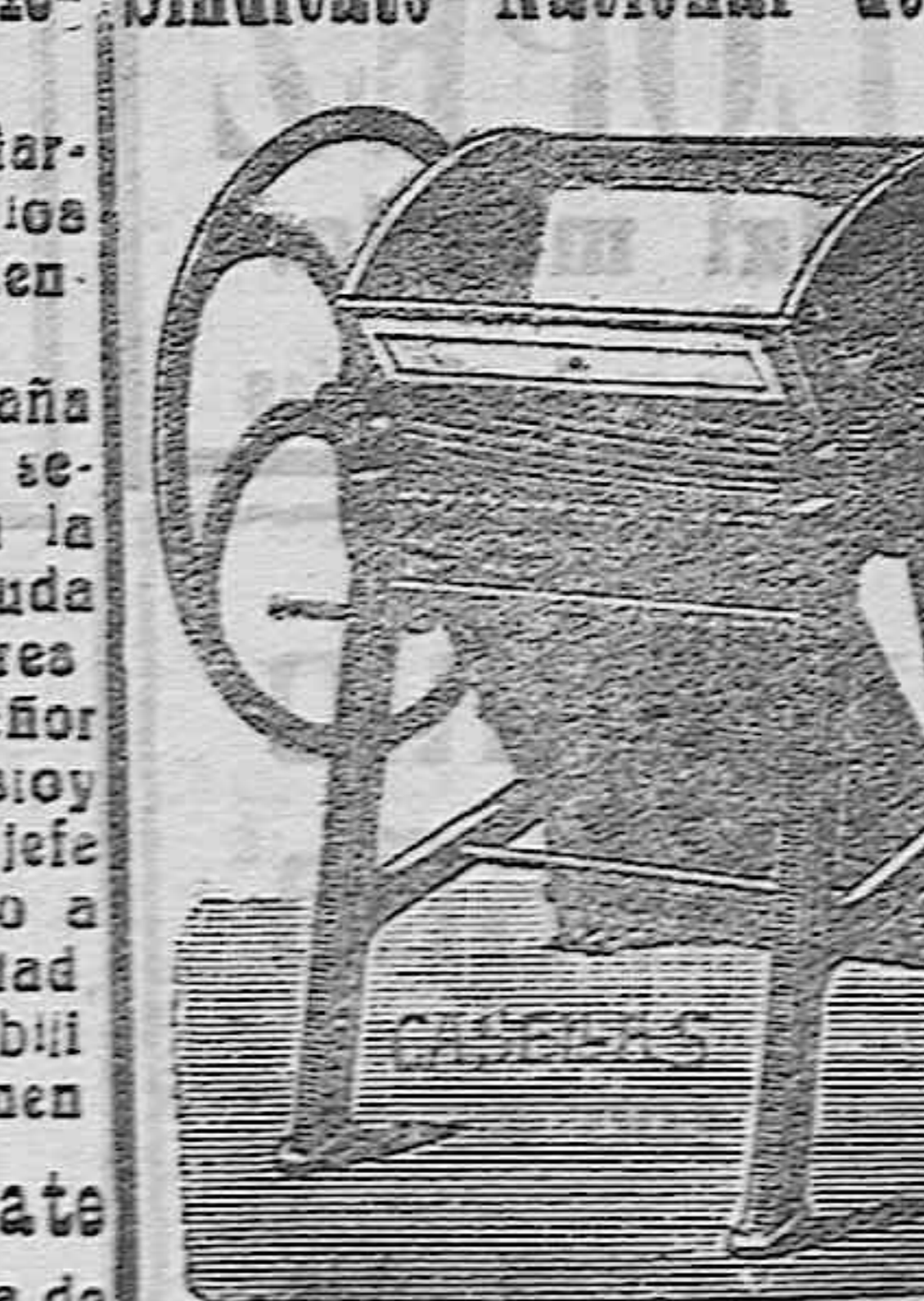
Pisadora nva. gran rendimiento.