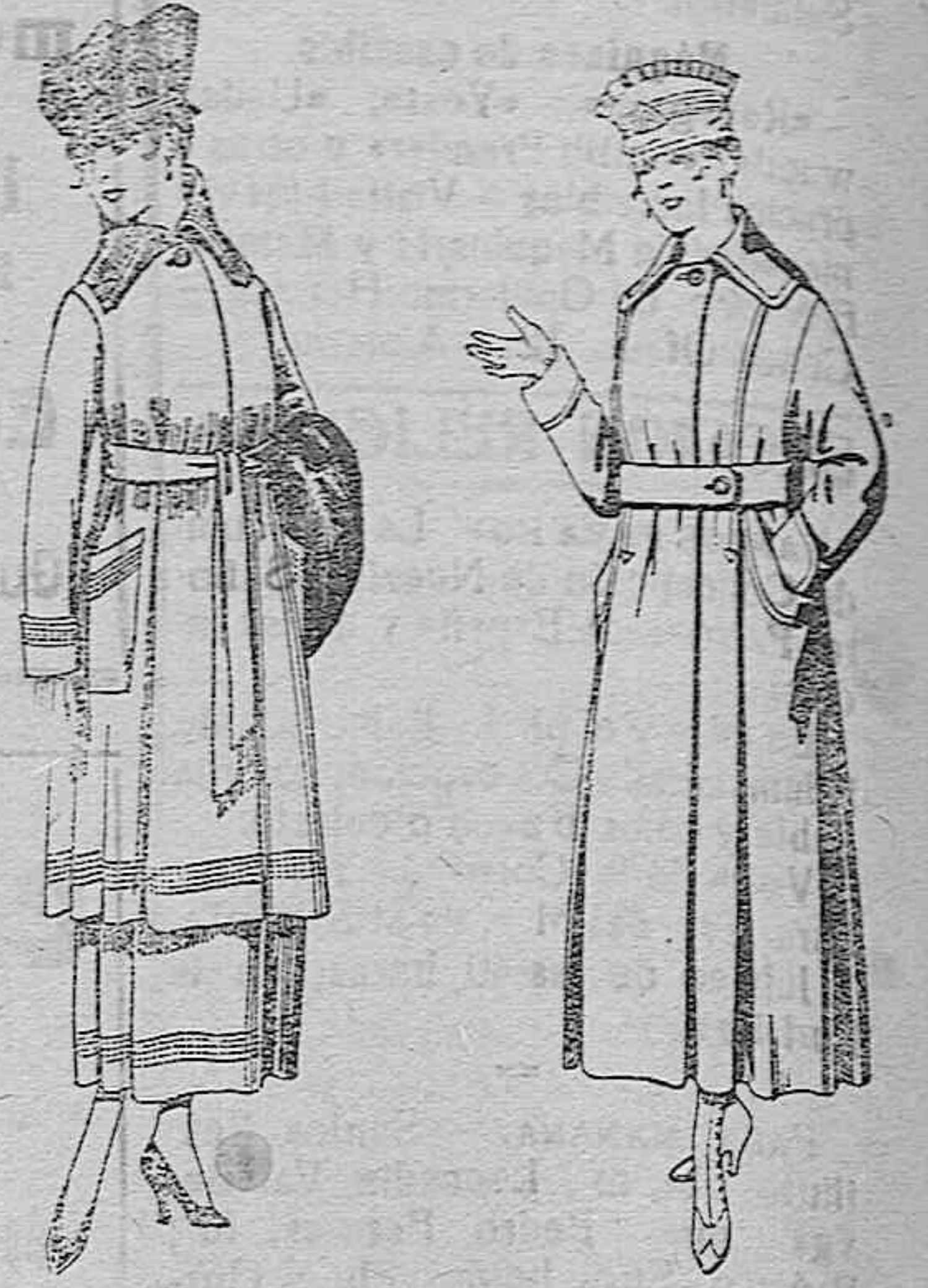
Trajes de sarga inglesa, en negro y azul, bordados. De ptas. 85 a 100