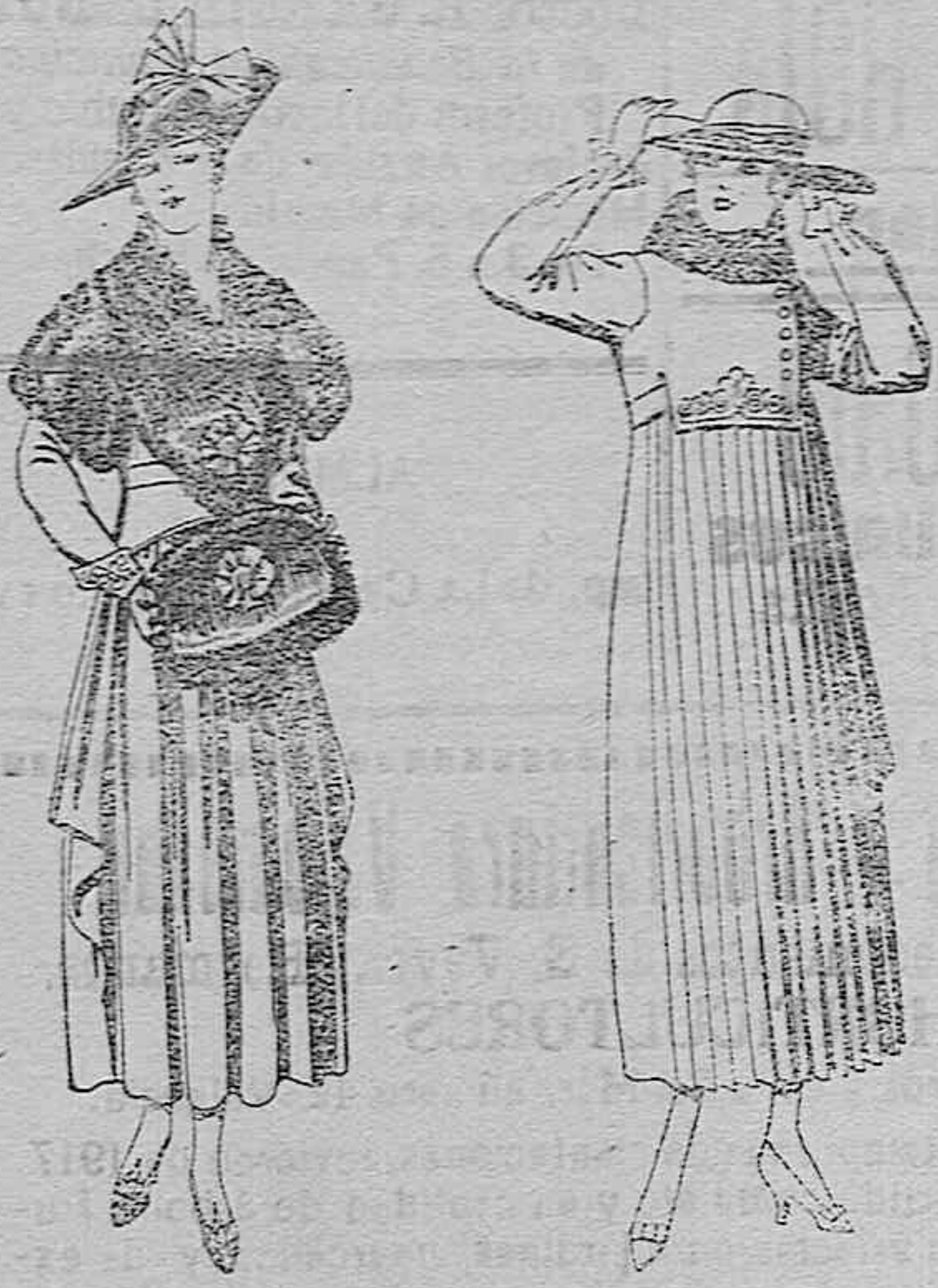
Juegos de pieles, negro, imitación Renard. Gran chic. A ptas. 58.

Ropas confeccionadas para caballero, señora, NIÑO Y NIÑA