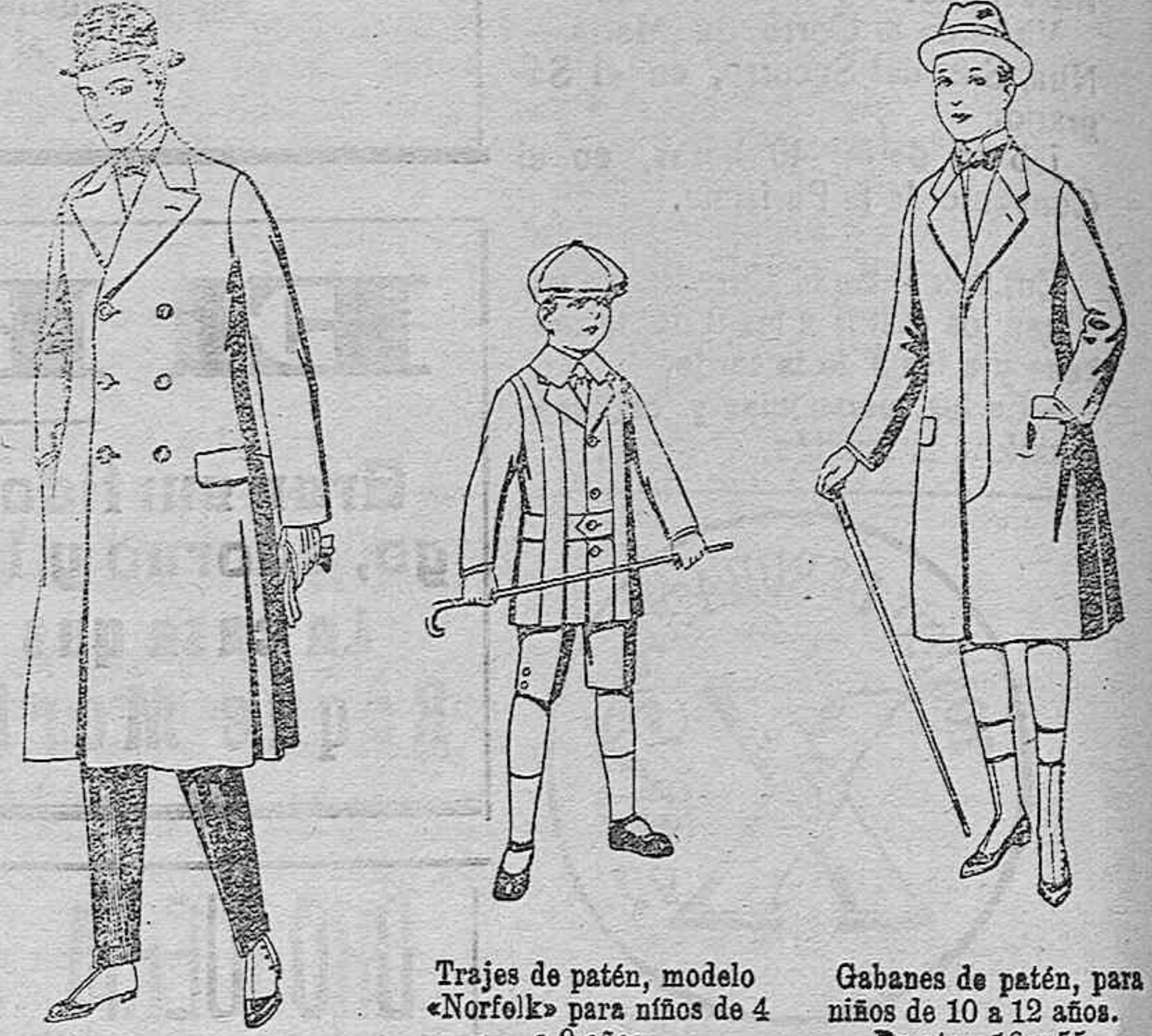
Gabanes de patén, gamuza o Cover. De ptas. 50 a 110

PRECIO FIJO VENTA AL CONTADO Pídanse el catálogo general