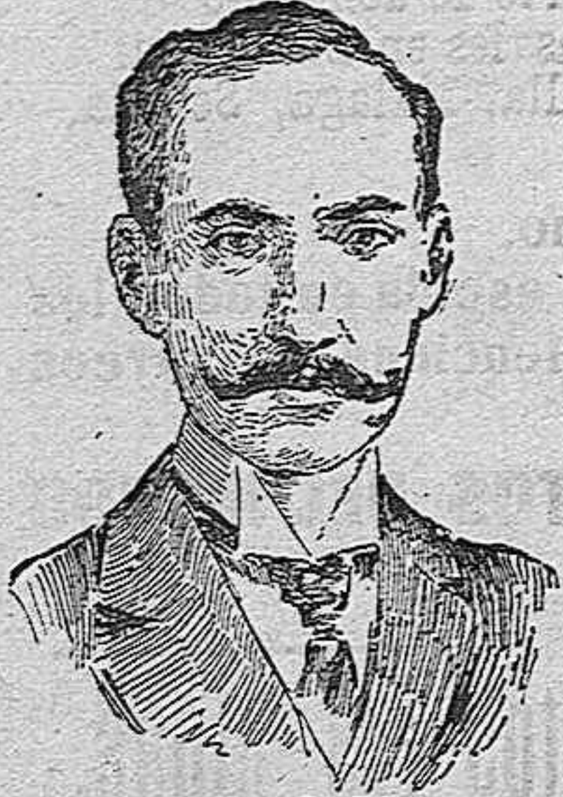
Príncipe Carlos de Dinamarca.

sobre todo, al comercio marítimo interior y exterior, a lo que la hermosa ciudad debe su preponderancia, que se ha acrecentado a medida que ha ido desarrollando su puerto. Los grandes trabajos comenzaron el año de 1865 y duraron hasta 1880, en cuya fecha quedó terminado el puerto exterior y se aumentó la profundidad de los canales de entrada. Desde entonces no se han dejado de realizar obras hidráulicas que paulatinamente han mejorado las condiciones de puerto. Pero las grandes reformas y su ampliación, son de fecha reciente, habiendo contribuido a ello, en primer término, la concesión del puerto franco, que impuso la necesidad de construir nuevas dársenas, muelles, almacenes y vías férreas, en armonía con las exigencias cada día mayores de un creciente movimiento comercial.