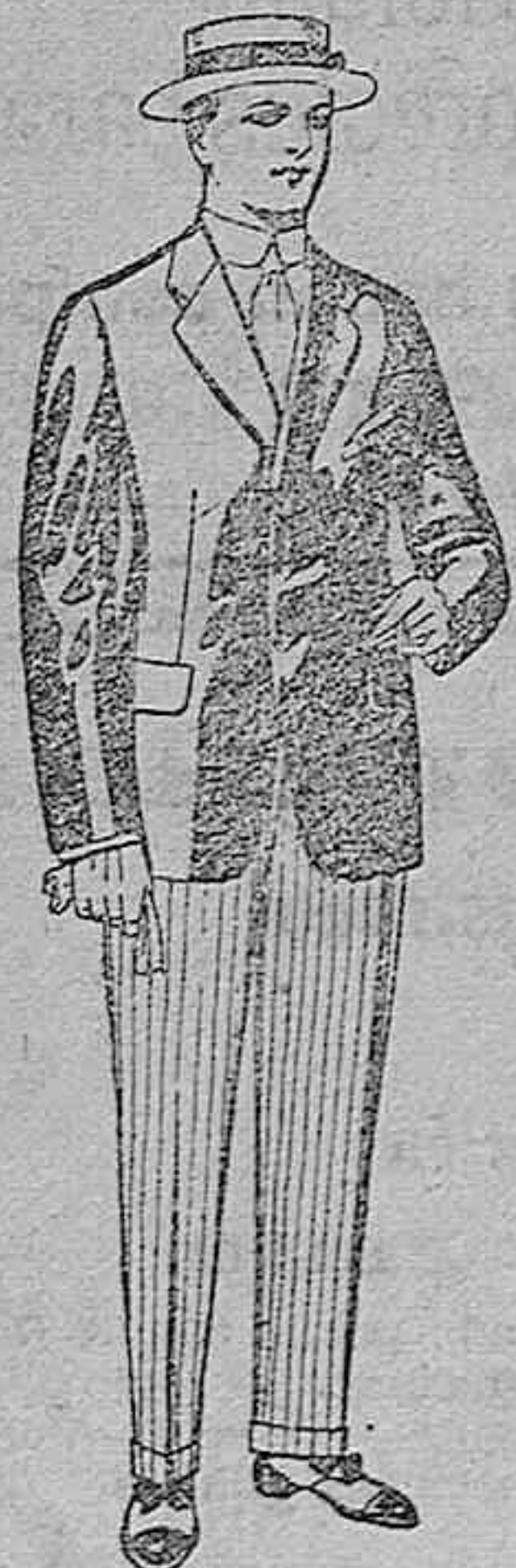
Trajes de lanilla, vicuña, etc., para jovencitos de 10 a 16 años. De ptas. 19 a 55