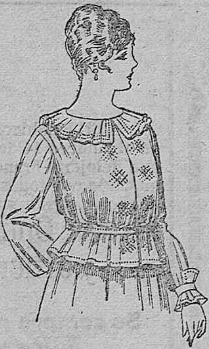
Blusa de crepón o negro, azul y color. A ptas. 33.