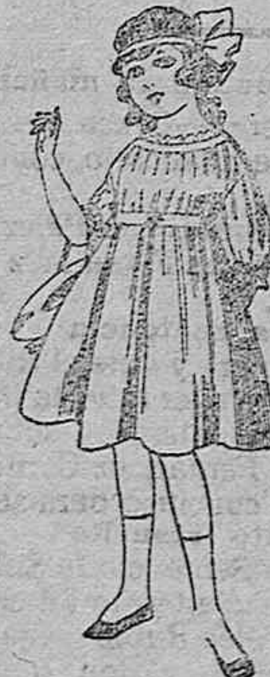
Vestidos de lanilla azul, para niñas de 4 a 9 años. De ptas. 22 a 25. Los mismos en voile. De ptas. 10 a 17.