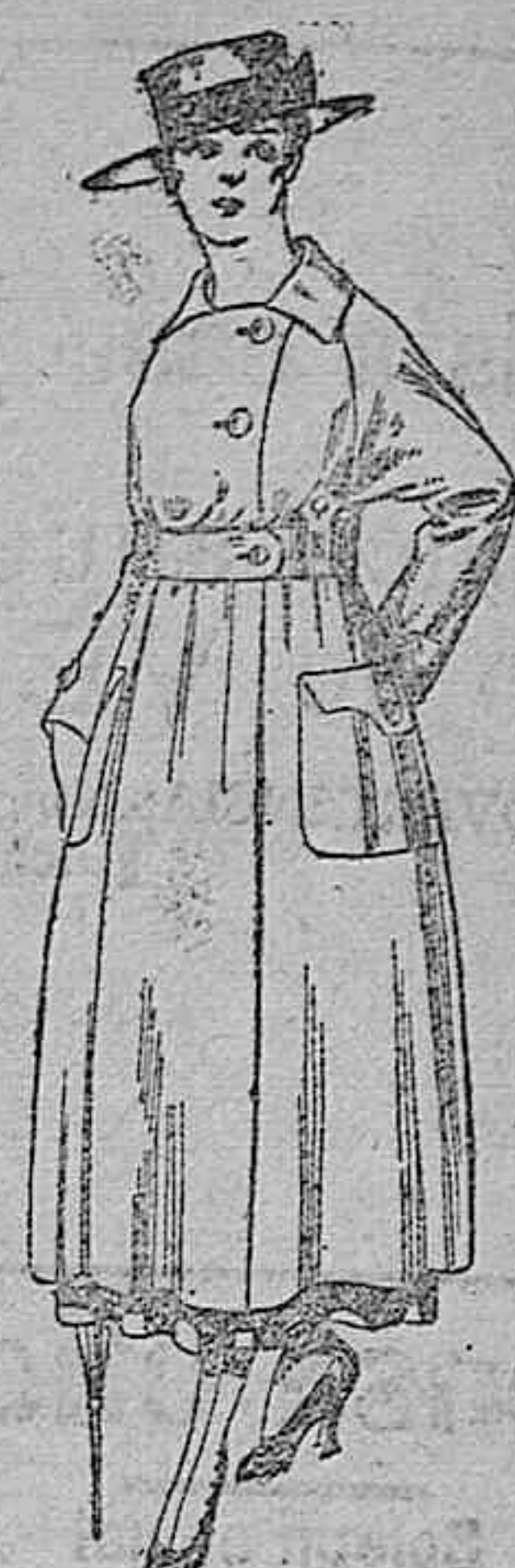
Vestido de estambre negro, azul y color, bordado. De pesetas 64 a 75.