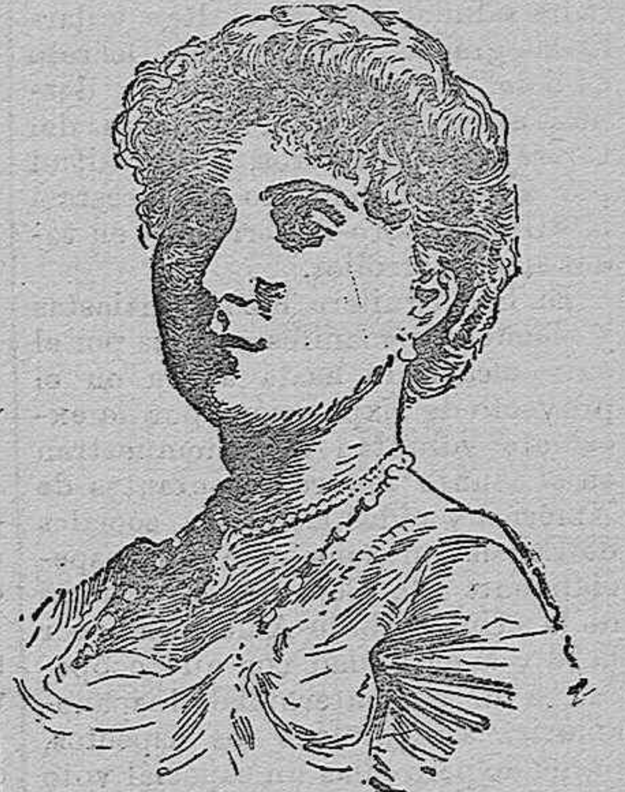
La princesa Ena de Battenberg prometida de S. M. el Rey don Alfonso XIII