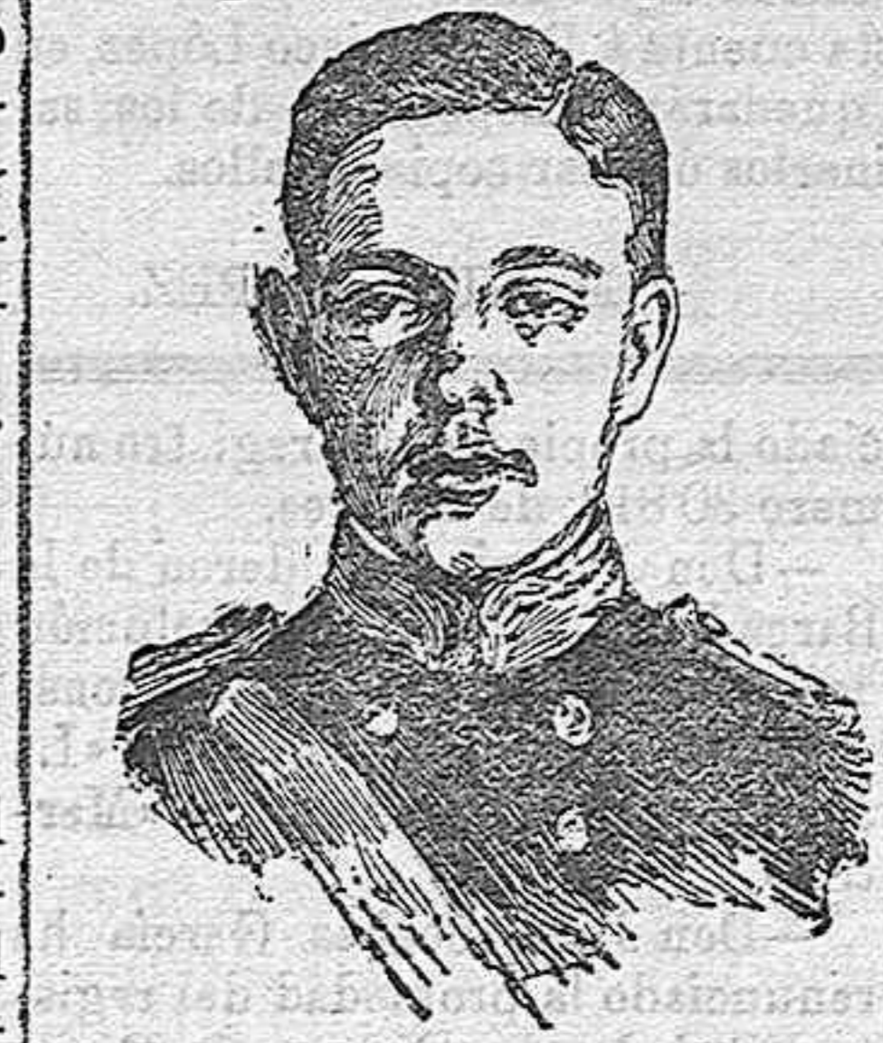
MANUEL II DE PORTUGAL.

Desde la horrible tragedia de la Plaza del Comercio, tres veces solemnemente ha abandonado D. Manuel II de Portugal su régia morada del Palacio de las Necesidades. Los dos primeros fueron para asistir á las exequias celebradas por las al-