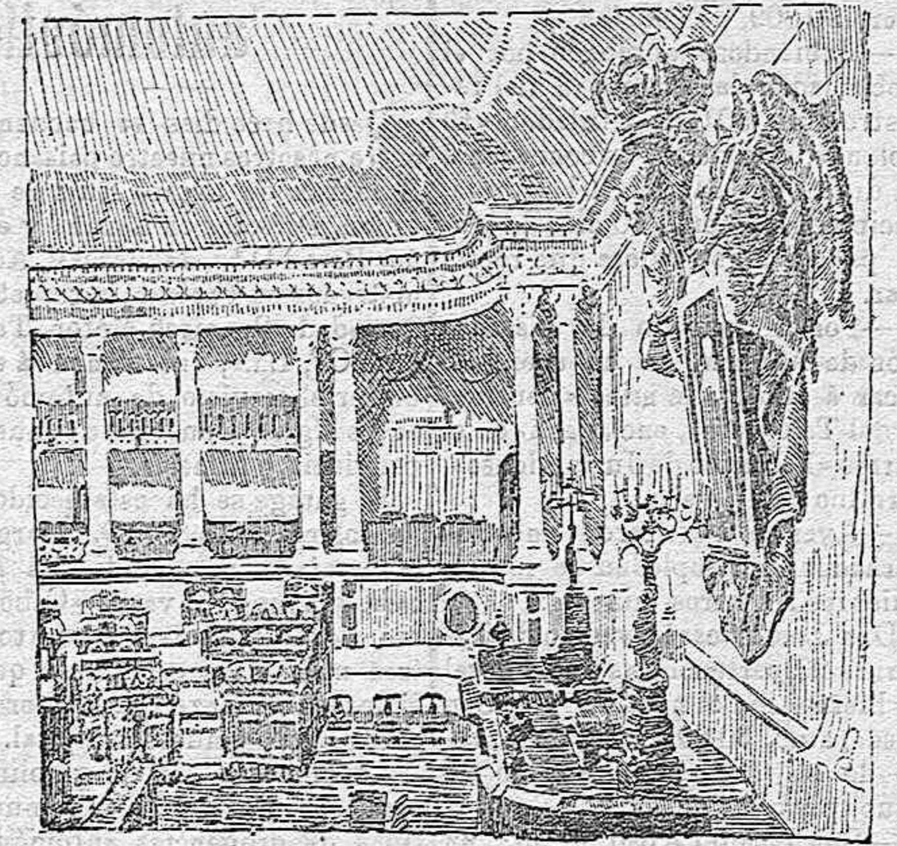
PRESIDENCIA DEL PARLAMENTO PORTUGUÉS, DONDE S. M. EL REY DON MANUEL II HA JURADO GUARDAR LA CONSTITUCION.

La ceremonia de la jura se ha verificado sin la pompa y el aparato, no habiendo asistido á ella más representantes extranjeros que los ministros residentes.