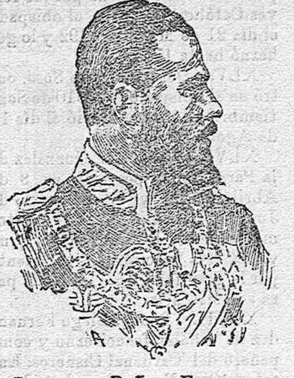
EL INFANTE D. LUIS FERNANDO. en sus pechos, han hecho público que quieren fundar un asilo para que el necesitado halle en él cama y pan y el enfermo manos cariñosas que le atiendan en su dolencia y que no recibirían presente que no fueran dádivas ú ofertas benéficas al asilo sanatorio, cuya construcción piensan comenzar inmediatamente. Sin embargo, la corte bávara ha dispuesto espléndidas fiestas en honor de sus príncipes, y de ellas han disfrutado todas las clases sociales.

de Baviera y su augusta esposa doña Paz de Borbón, celebraron sus bodas de plata, y en el regocijo natural por tan fausto suceso, tomaron parte todas las clases sociales de Munich: la aristocracia, por que solo atenciones y agasajos deba á los régios cónyuges, y las clases y menesterosos, por que hácia ellos sienten verdadera veneración. (Óómo olvidar que el príncipe Luis Fernando es sapientísimo médico que solo ejerce su profesión en beneficio de los pobres, y que su esposa vive pronto á enjugar lágrimas y á remediar necesidades!) Varias corporaciones y muchas familias se disponían á demostrarles ayer su acendrado cariño y admiración, haciéndoles ricos presentes; pero ellos, guiados por la caridad que tan hondas raíces tienen