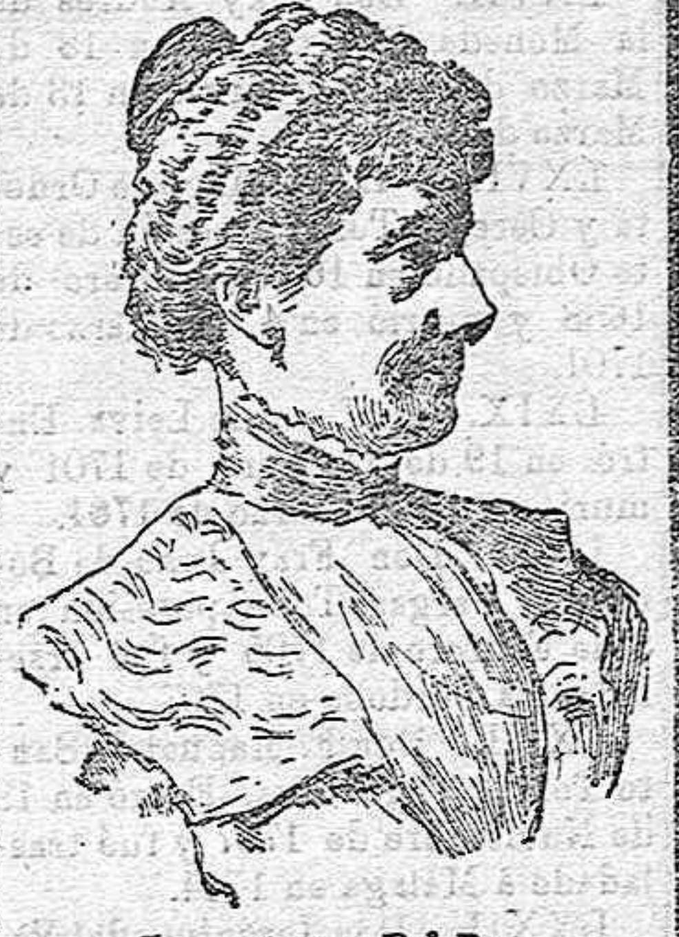
LA INFANTA D.ª PAZ. Fiesta de carácter familiar, íntima, á la cual la han invitado la gratitud y el afecto. El príncipe D. Luis Fernando

Ayer la capital de Baviera, la artística ciudad de Munich, vistió de gala para tomar parte en una