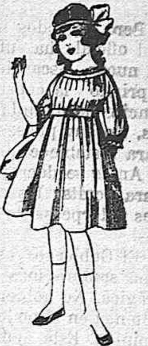
Vestidos de lana, azul, para niñas de 4 á 9 años De pesetas 22 á 25 Los mismos en voile. De pesetas 10 á 17