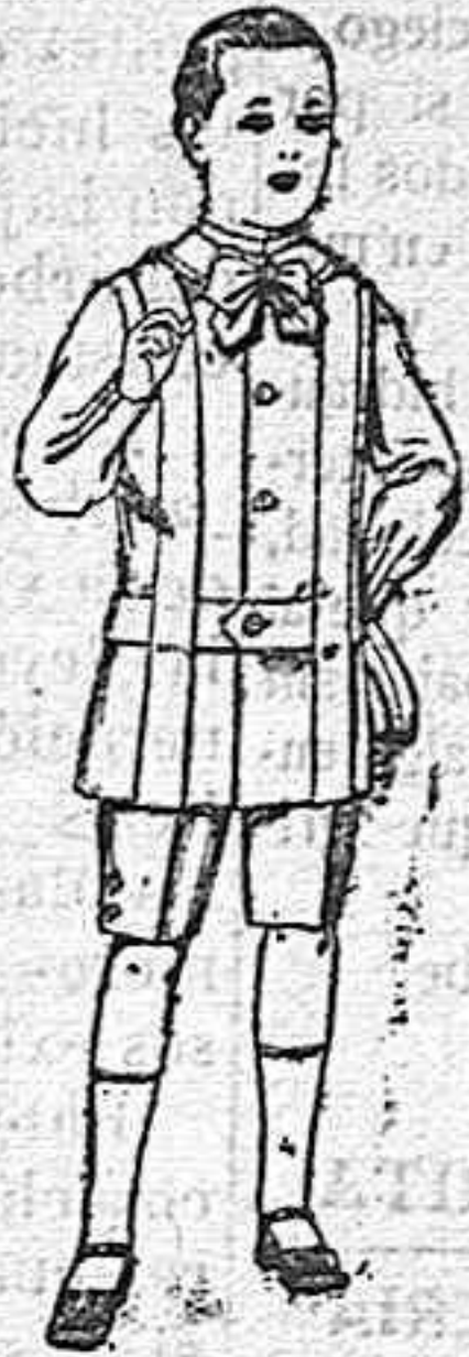
Trajes de lanilla, melton, etc. para niños de 4 á 7 años De ptas. 16 á 33.