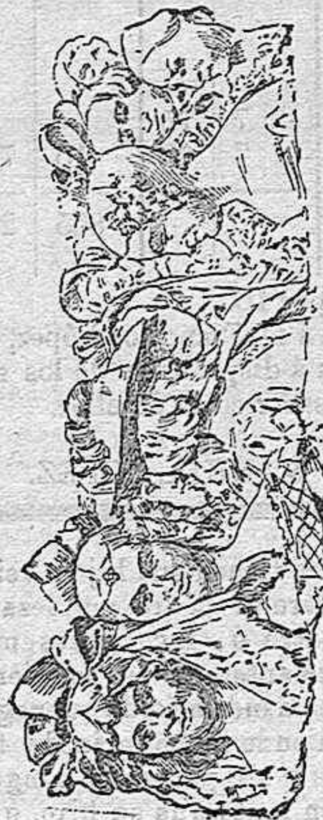
DETALLE DE LA LÁPIDA COLOCADA EN LA CASA EN QUE MURIÓ ESPRONCEDA.

encargado de modelar la lápida que ayer sería descubierta en la casa núm 19 de la calle de los Madrazos.