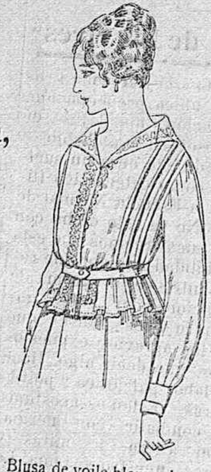
Blusa de voile blanco, bordados blancos, rosa ó azul. A ptas. 9