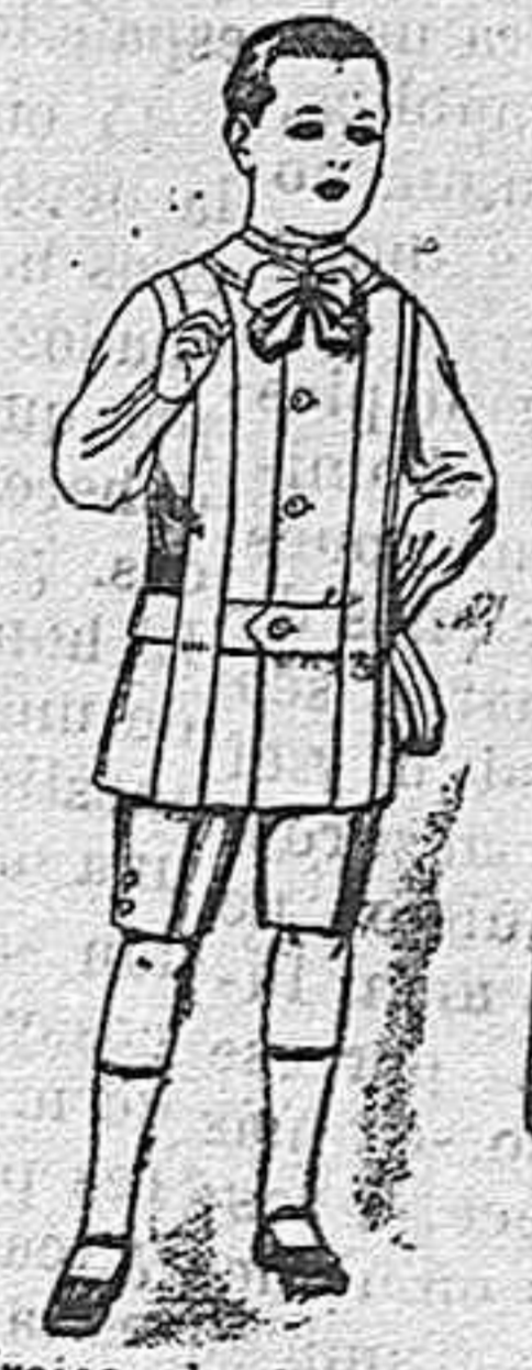
Trajes de lanilla, melton, etc. para niños d 4 á 7 años. De ptas. 16 á 33.