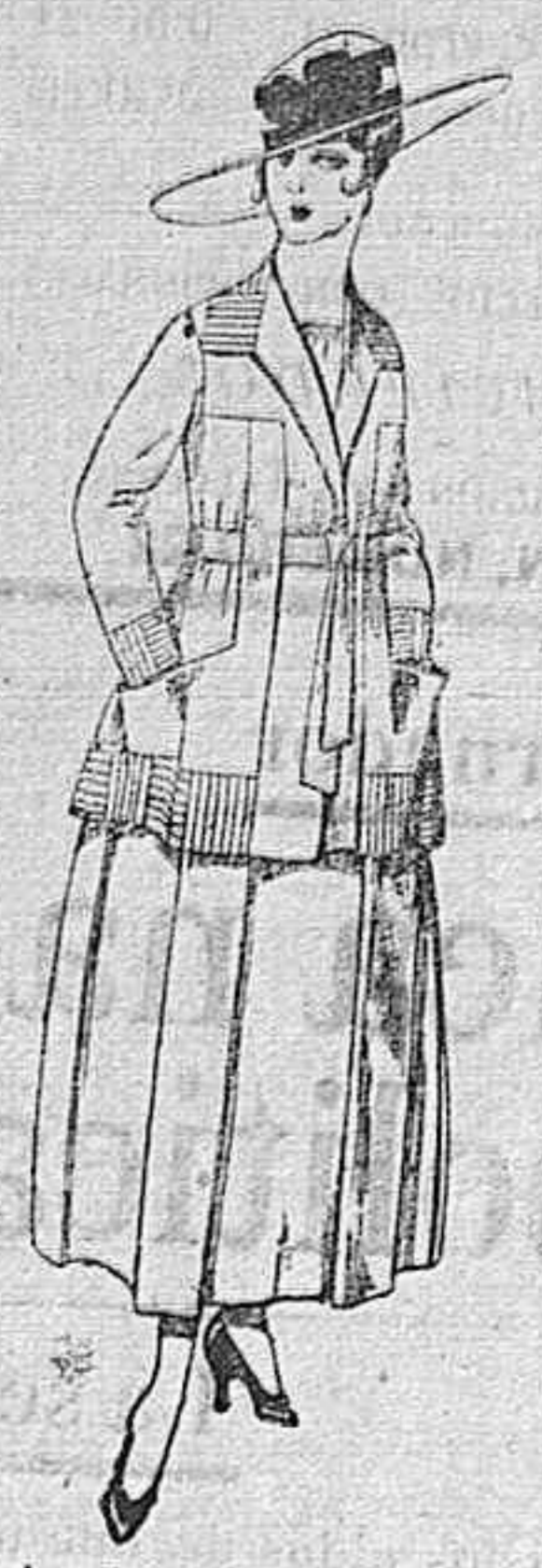
Trajes de lanilla negro, azul, y color, bordado, á pesetas 90.