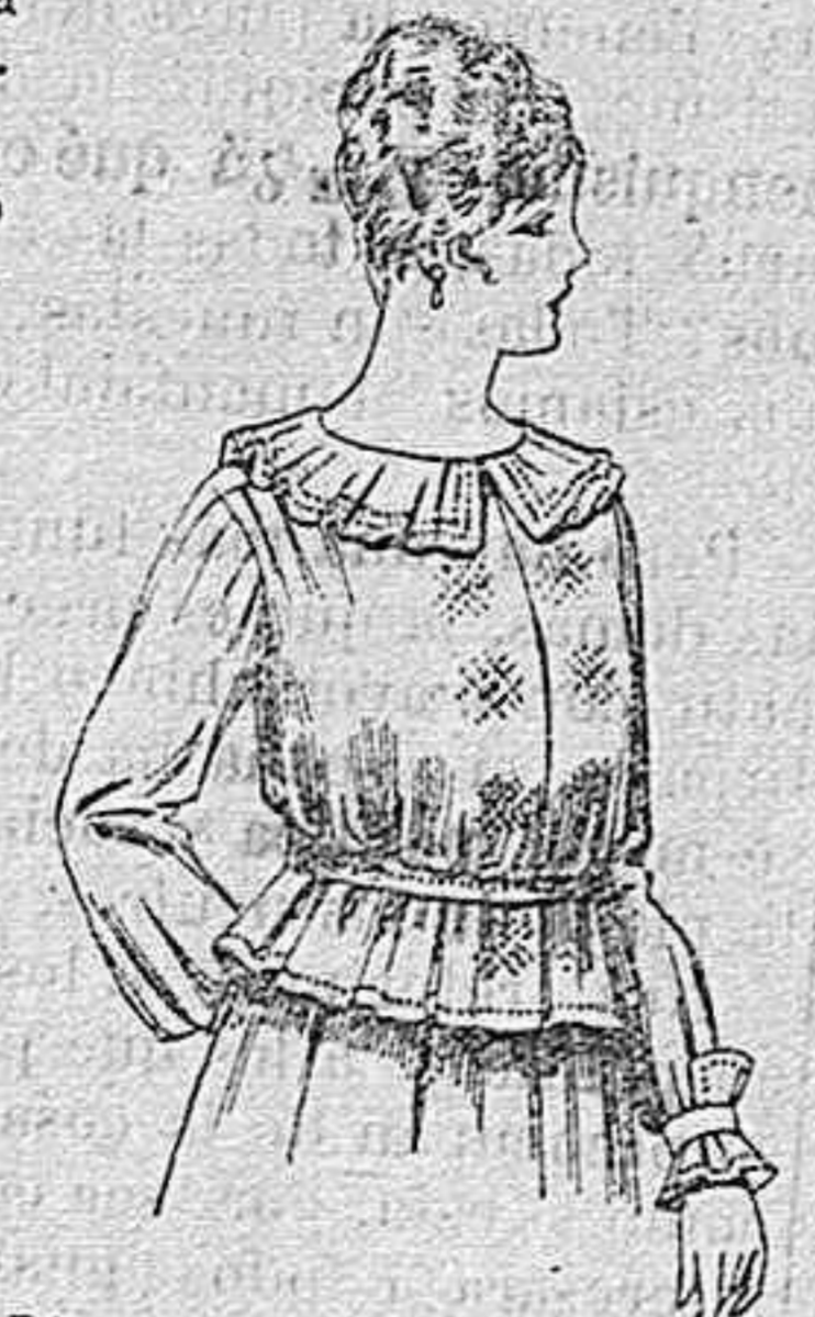
Blusa de crespón ó seda, en negro, azul y color. A ptas. 33.