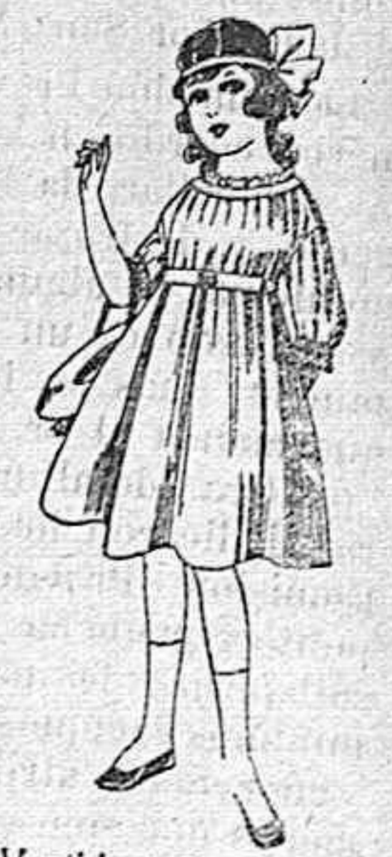
Vestidos de lana, azul, para niñas de 4 á 9 años. De pesetas 22 á 25. Los mismos en voile. De pesetas 10 á 17