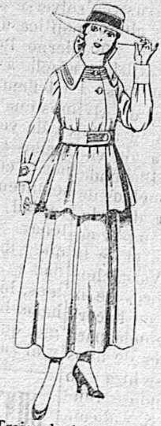
Trajes de lanilla negra, azul y color, para jovencitas de 13 á 16 años.