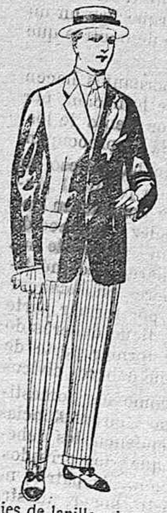
Trajes de lanilla, vicuña, etc., para jovencitos de 10 á 16 años. De pesetas 10 á 56