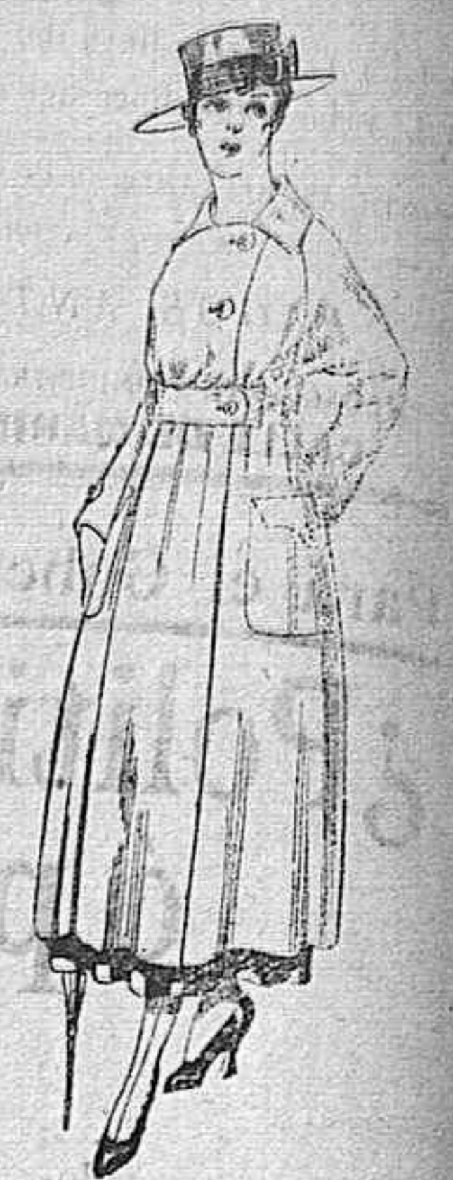
Vestido de estambre negro, azul y colores bordado. De peseta 64 á 75