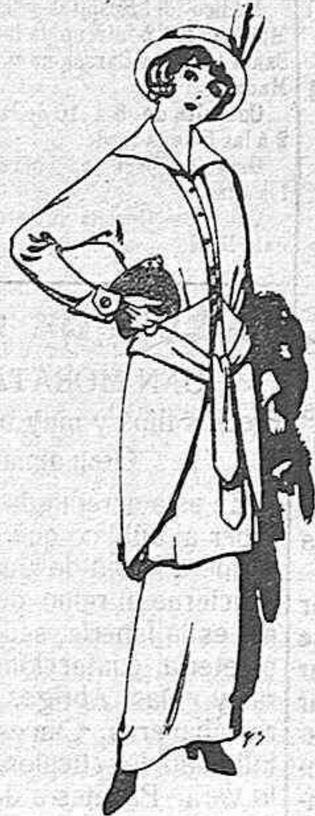
Traje de jerga negra y azul para señora Ptas. 85.