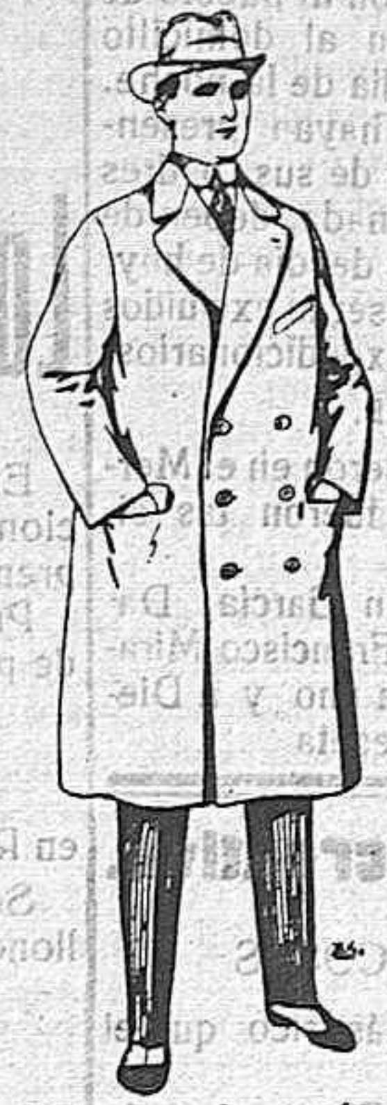
Gabanes de patén y de cheviot. De ptas. 55 a 105.