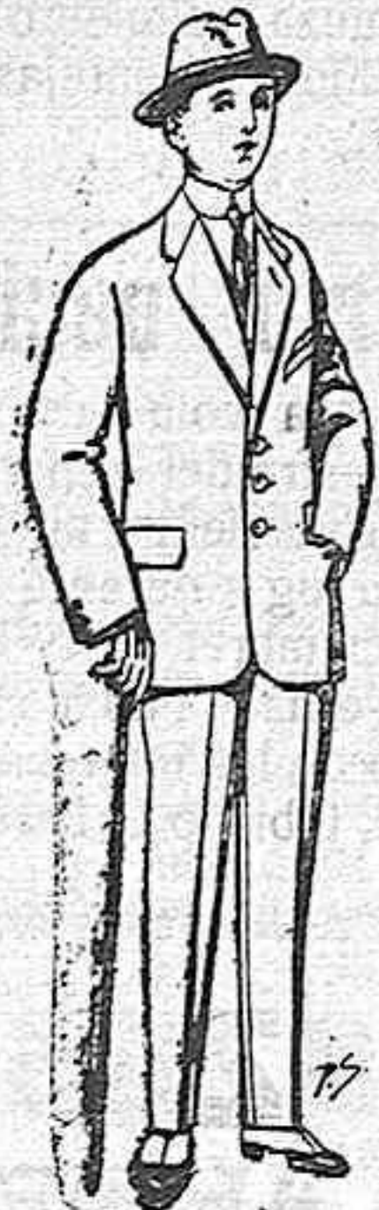
Trojes de patén, vicuña o jerga, para niños de 10 a 16 años. De ptas. 10 a 48.