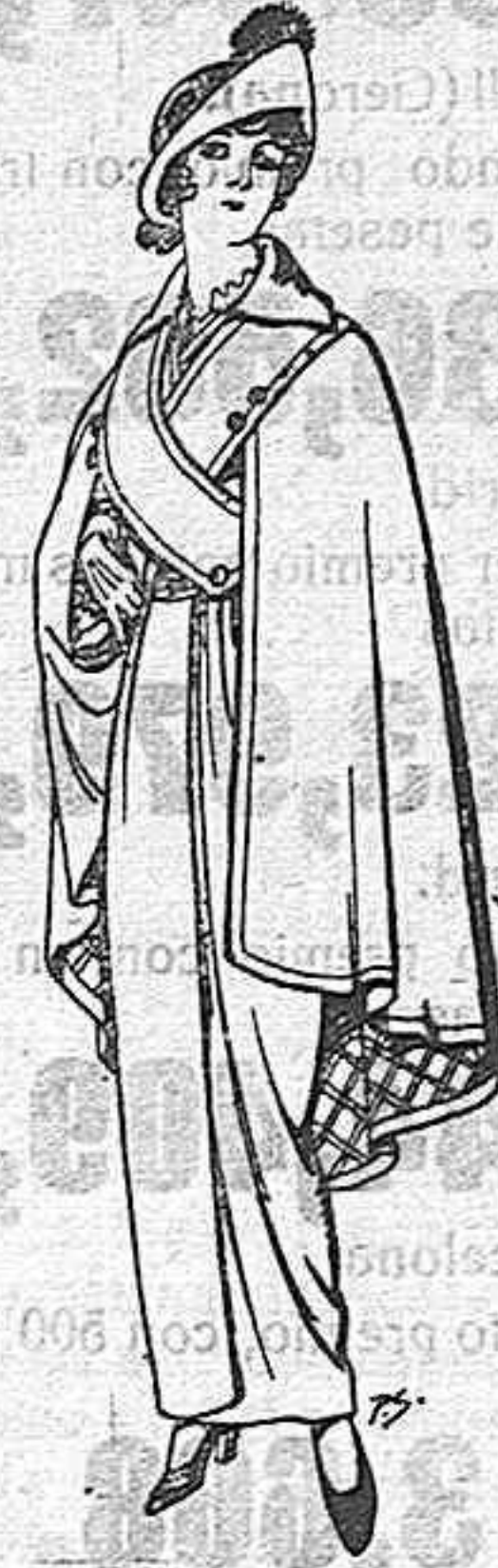
Capas de lana negra para señora Ptas. 16.