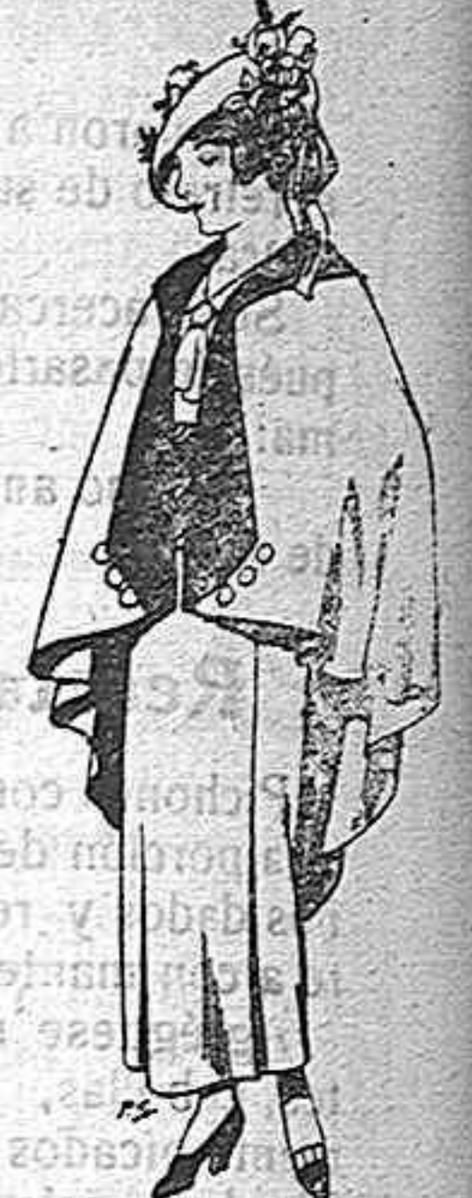
Capas de lana para jovencitas de 15 a 16 años. Ptas. 25.