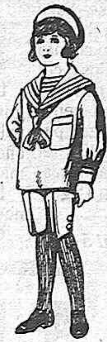
Traje jerga azul, bordado oro en la manga para niños de 4 a 9 años. De ptas. 20 a 22.