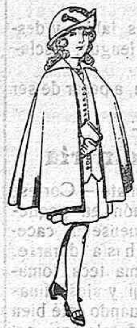
Capas de lana para niñas de 4 a 12 años. De ptas. 20 a 22.