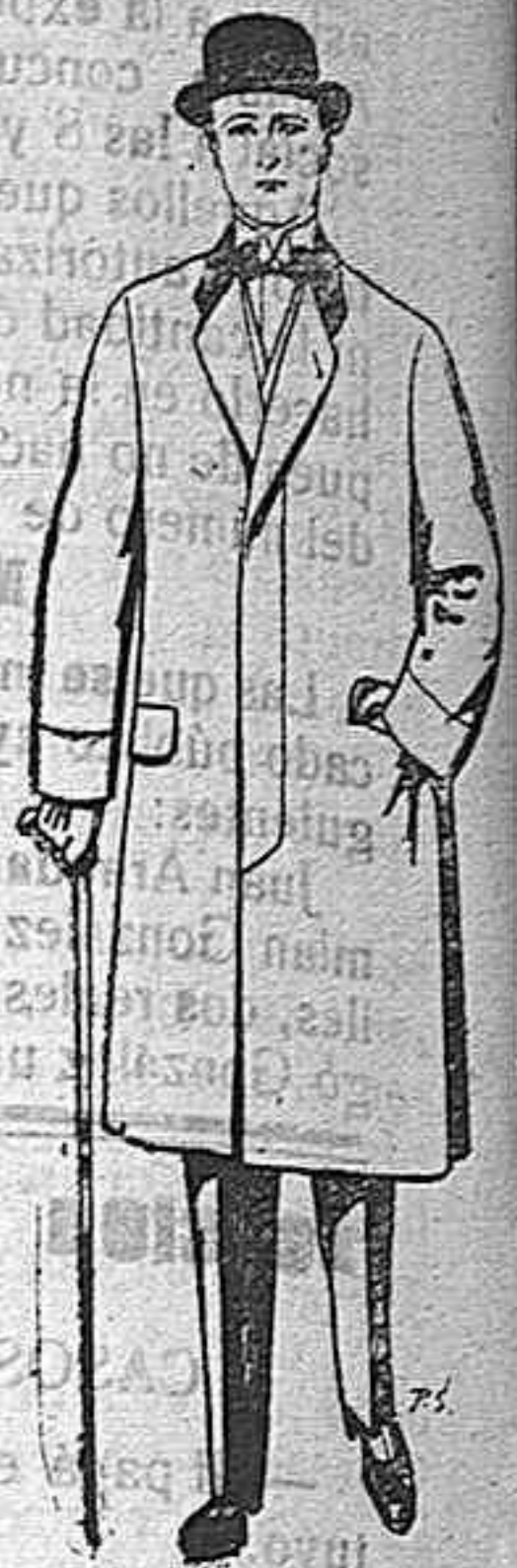
Gabanes de patén melón y cheviot. De ptas. 25 a 100.