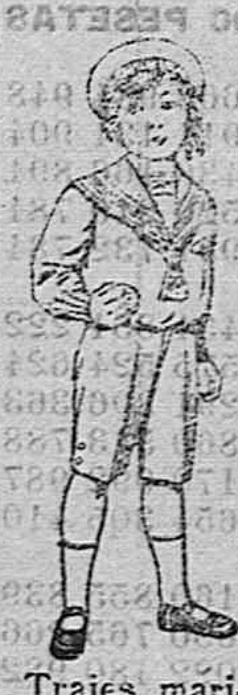
Trajes marinera vieuña azul, para niños de 4 a 9 años. De pesetas