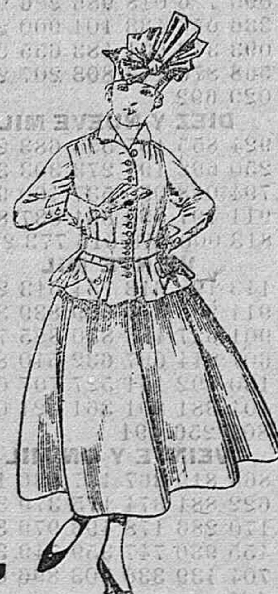
Trajes de lanilla negra azul y color. A pesetas 70