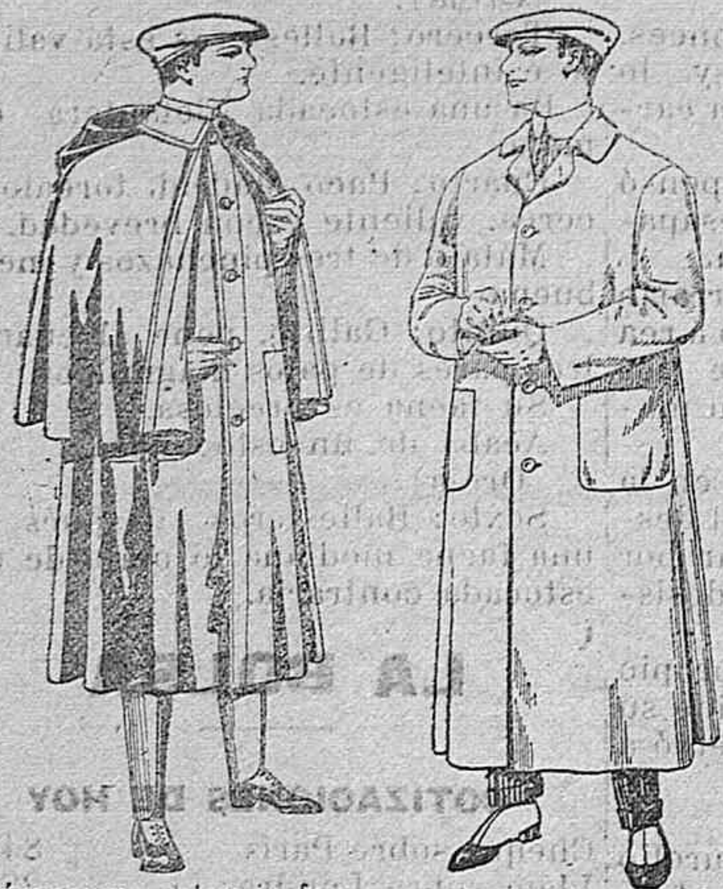
Impermeables en forro de goma y azul De pesetas 55 a 100

Gran exposición de artículos para la temporada