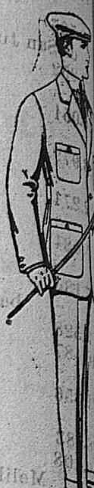
Cazadoras de crudo. De pesetas