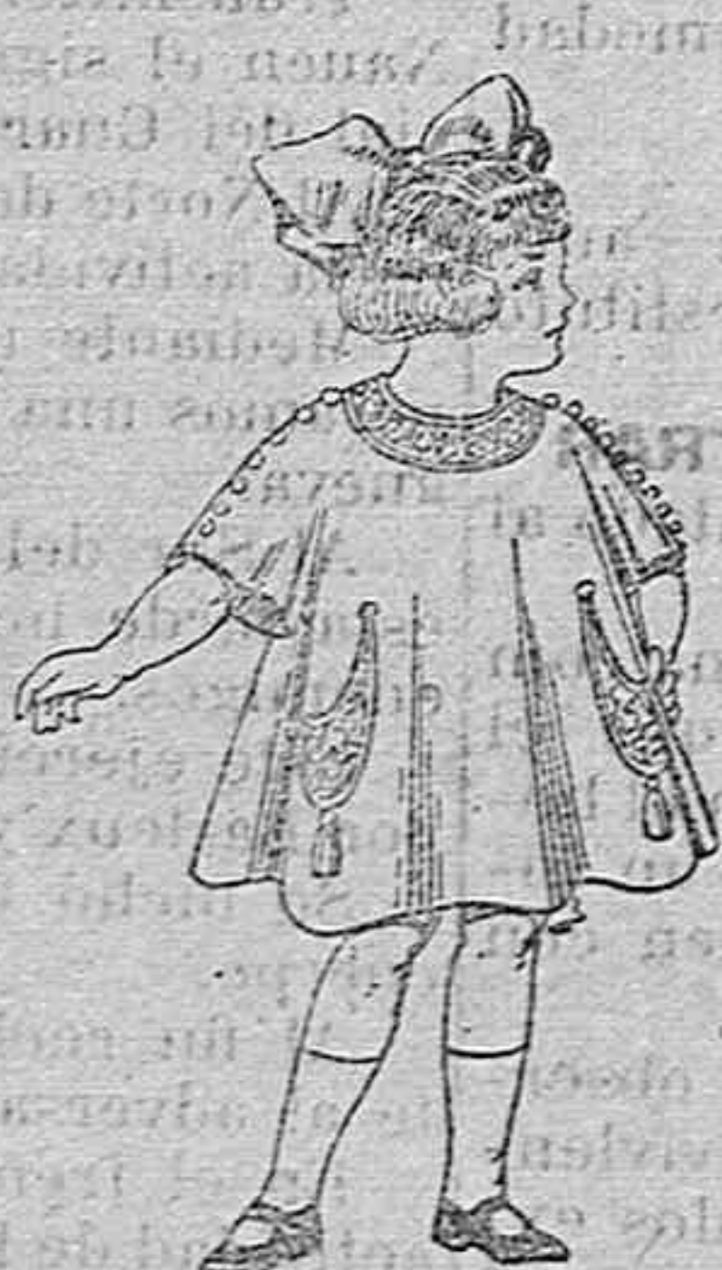
Vestidos de lanilla para niñas de 4 a 9 años. Depesetas 30 a 38