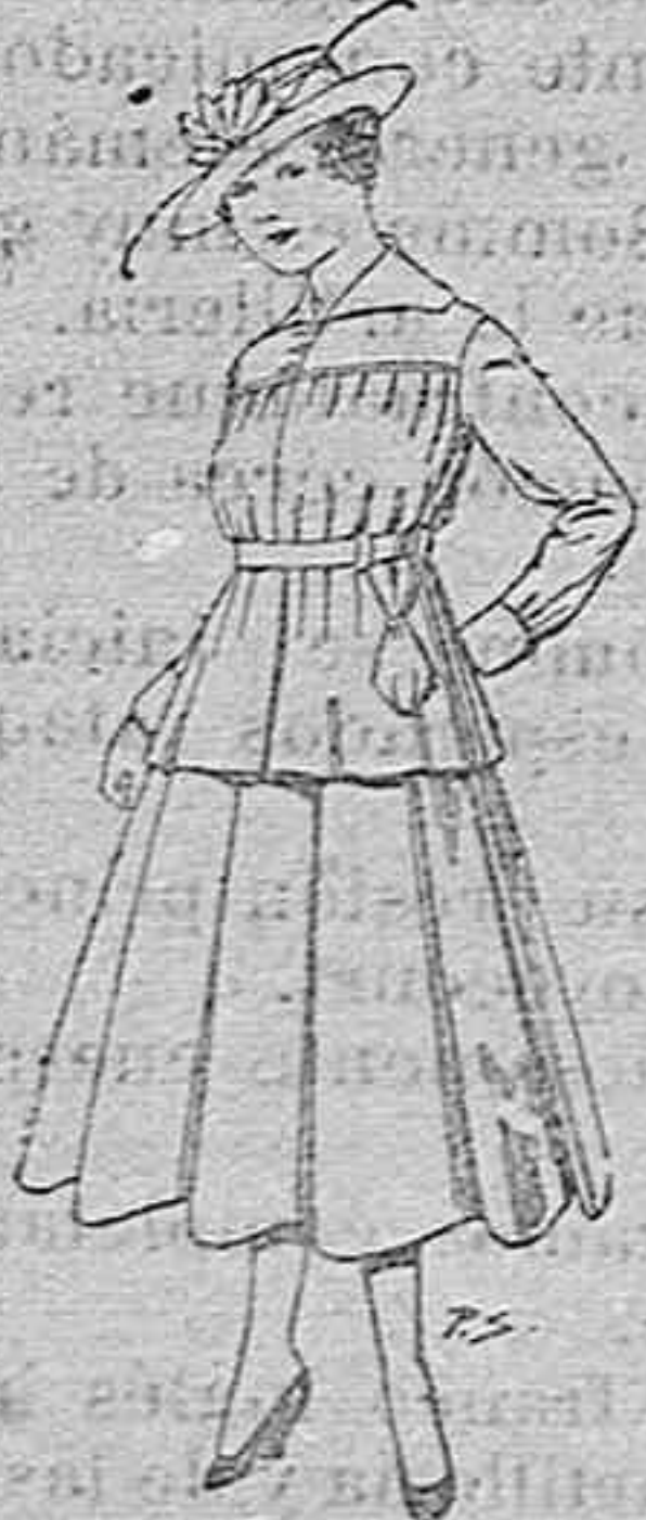
Trajes de lanilla para jovencitas de 13 a 19 p. 50 a 55