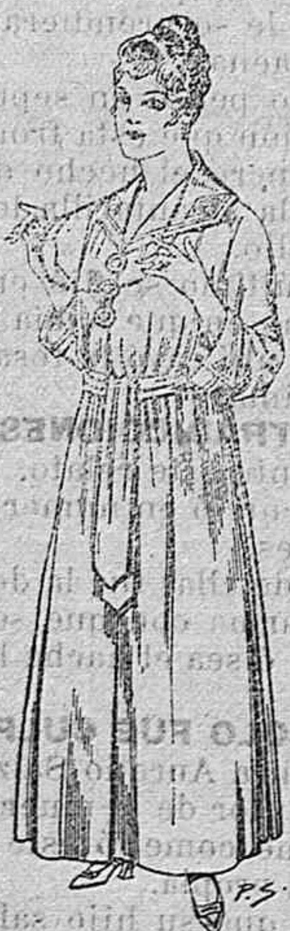
Bata de crepón, color, azul o bordado. De ptas. 6 a 10