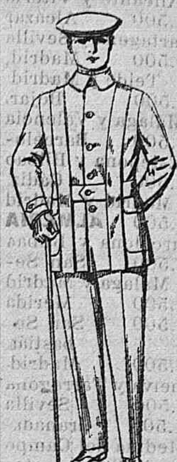
Trajes mdio. Sport de lanilla. A 10 pesetas