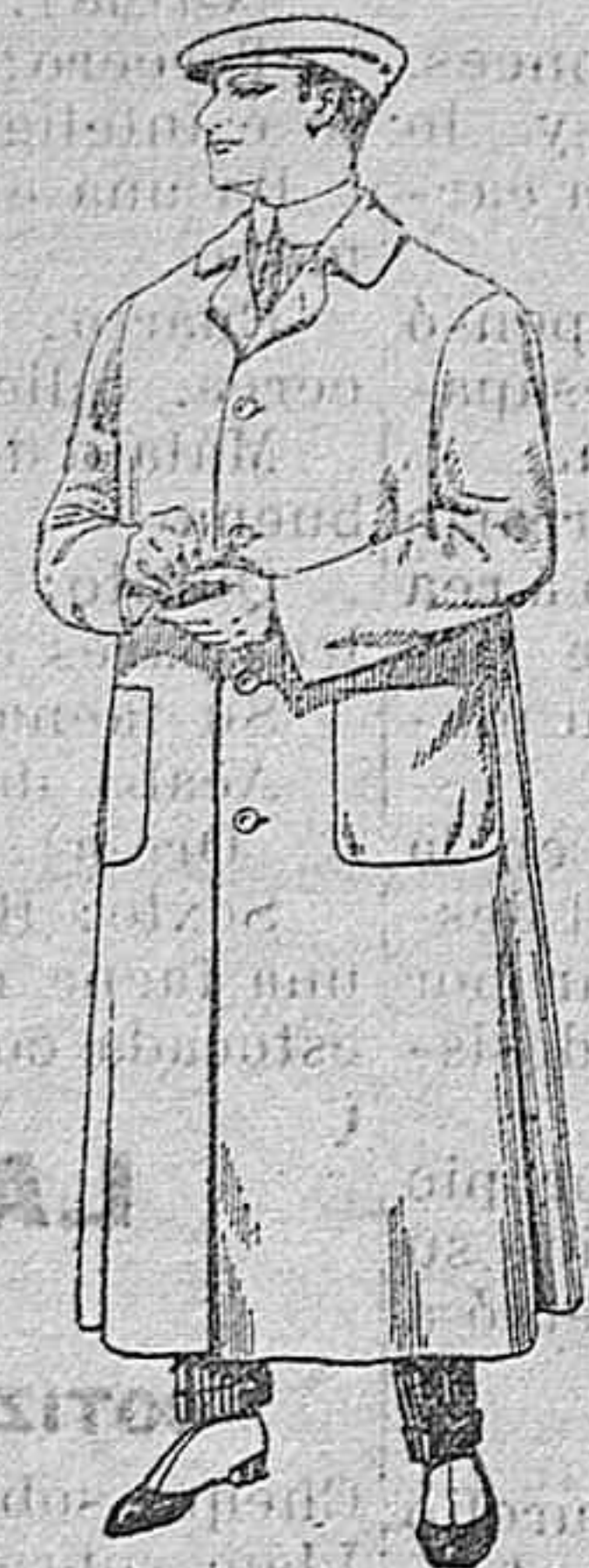
Guarapiños de dril igual al modelo De pesetas 6 a 11