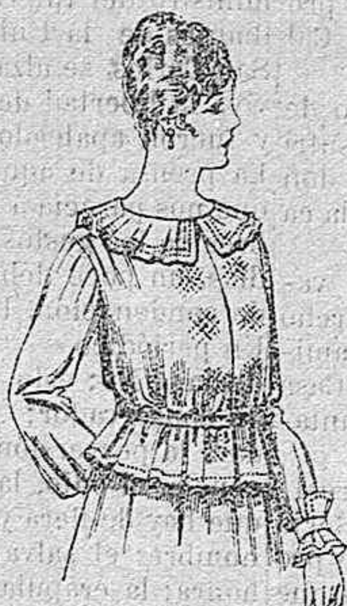
Blusa de crespón ó seda, en negro, azul y color. A ptas. 33.