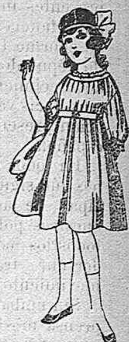
Vestidos de lan azul, para niñas de 4 á 9 años De pesetas 22 á 25 Los mismos en voile. De pesetas 10 á 17