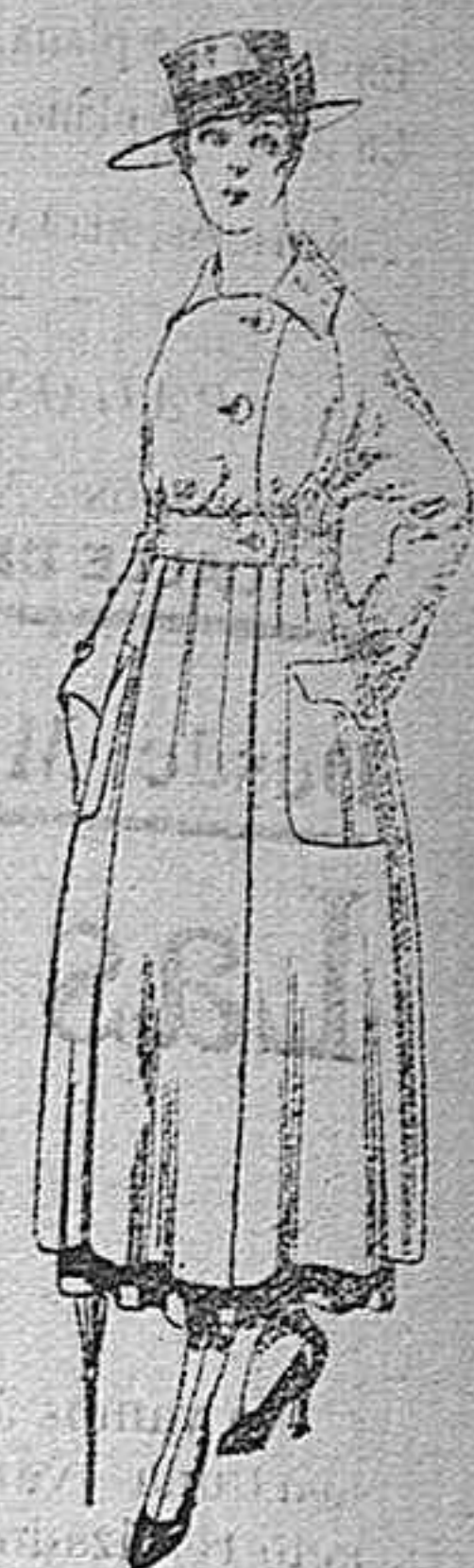
Vestido de estambre negro, azul y color bordado. De peseta 64 á 75