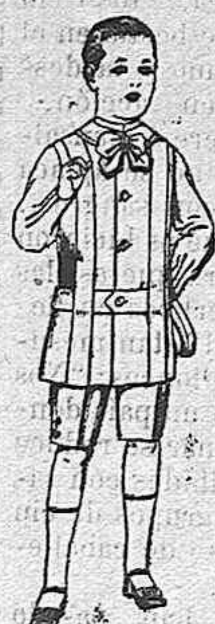
Trajes de lanilla, melton, etc. para niños d 4 á 7 años De ptas. 16 á 33.