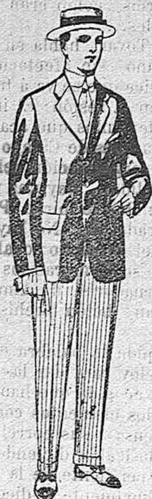
Trajes de lanilla, vicuña, etc., para jovencitos de 10 á 16 años. De pesetas 10 á 56