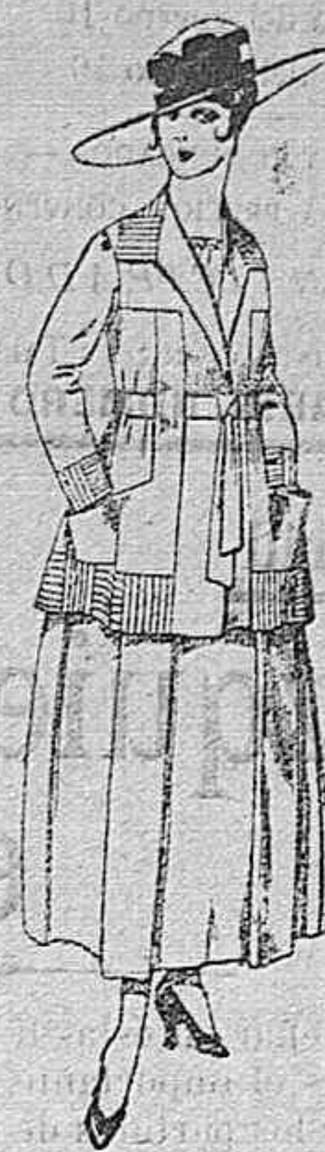
Trajes de lanilla negro, azul, y color, bordado, á pesetas 90.