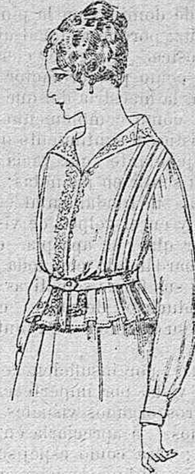
Blusa de voile blanco, bordados blancos, rosa ó azul A ptas. 9