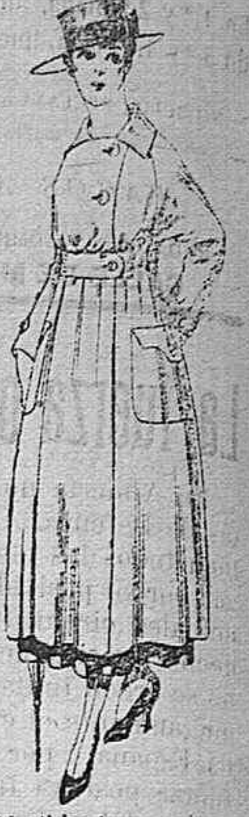
Vestido de estambre negro, azul y color bordado. De peseta 64 á 75