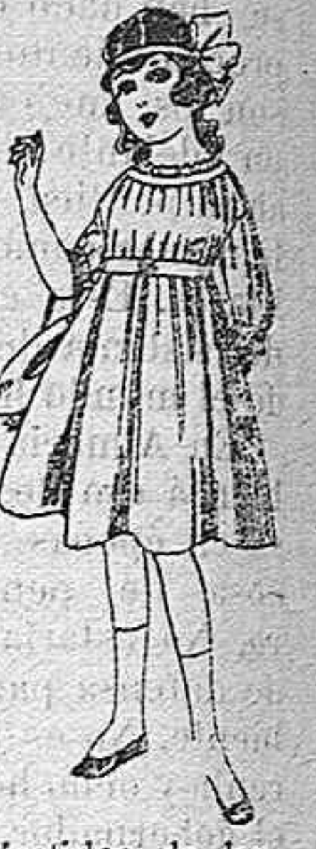
Vestidos de lan azul, para niñas de 4 á 9 años De pesetas 22 á 25 Los mismos en voile. De pesetas 10 á 17

Juan Criado González ARMERO Expenduría de explosivos y armas de caza.—Plaza de Nicolás Salmerón, número CRISTALERIA ROLDAN Plaza de Nicolás Salmerón, 6 dupdo. Cristales planos, imprímé y muselina. Se ponen cristales á domicilio