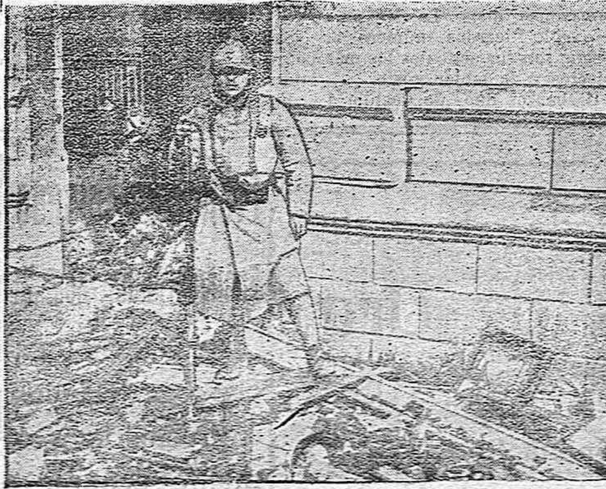
Centinela en las ruinas conquistadas