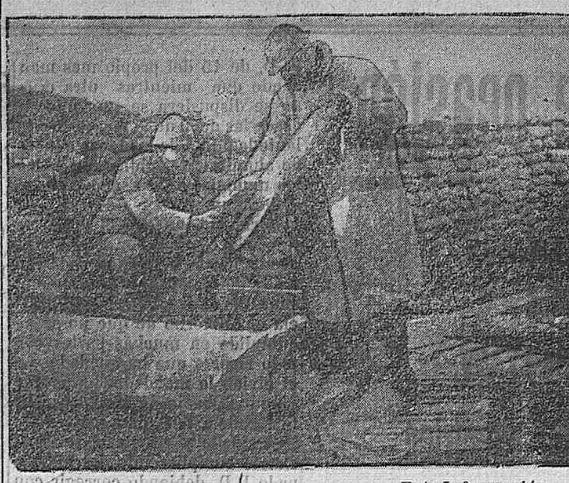
DEL EJERCITO ALIADO. — Torpedo aéreo

Dictaba leyes al mundo como si Potsdam fuese un nuevo Sinaí desde donde dictase leyes desde las rubes cargadas de rayos. Es preciso que no se engañe Europa; esta modesta Europa se veía medio intimidada, vivía dentro de una gran ansiedad, comprendía lo que aquello significaba.