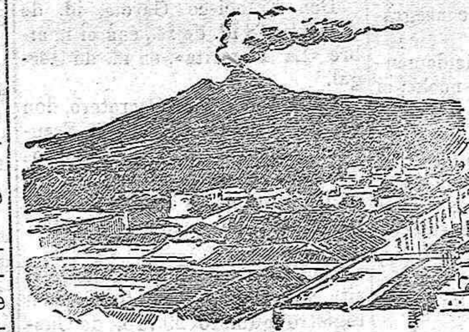
COLIMA.—LA CIUDAD Y EL VOLCAN.

nombre, inmediata al puerto de Manzanillo, es la población de mayor importancia de aquel departamento. El aspecto general de la ciudad no puede ser más atractivo, pues aunque de edificación si se exceptúa el Palacio del Gobierno y el teatro Santa Cruz, su conjunto es bello y agradable. Tiene encantadores alrededores y hermosas huertas donde luce espléndida la exuberante vegetación tropical, prestando singular realce á tan encantador panorama el humante volcán que se destaca en el horizonte y que ahora ha arrasado con su lava casas y vergeles antes alegres y dichosos. Chilpancingo, capital del Estado de Guerrero. Situada á 1.193