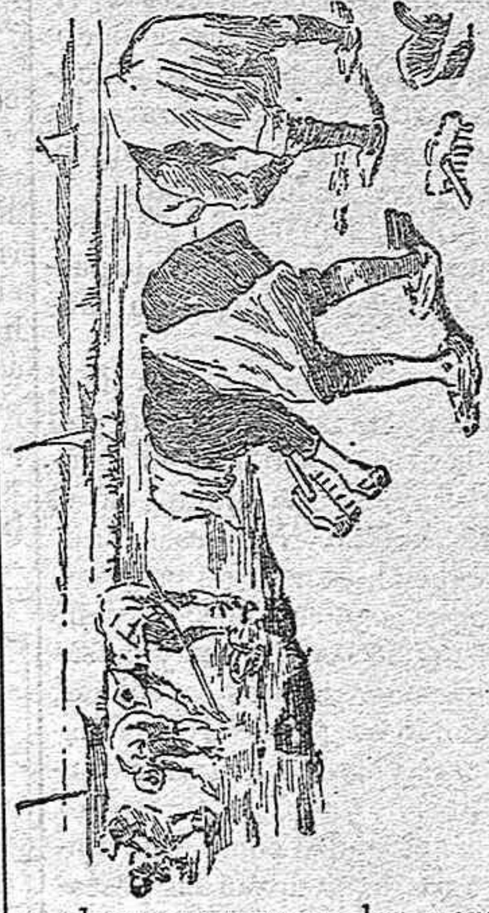
Cogiendo ostras en los «claros».

Si esperais á que descienda la marea, ireis viendo, poco á poco, cómo parecen surgir del mar las cercas de pinos, «los claros» con