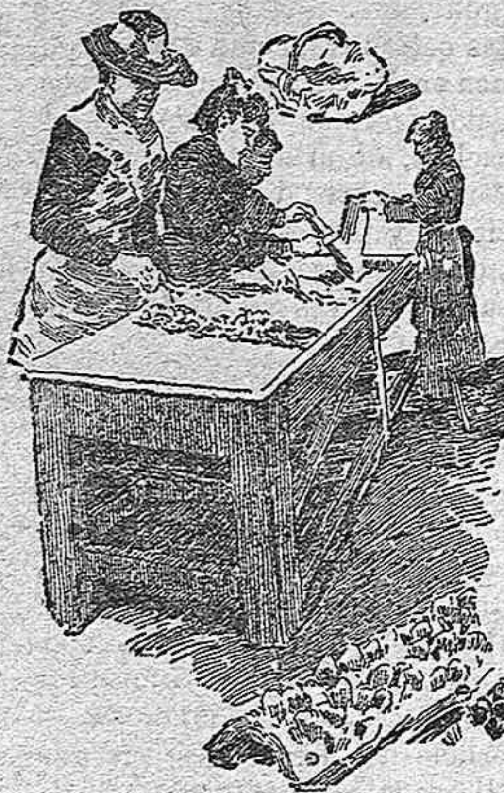
Quitando las ostras de las tejas.

Hecha esta selección y limpias las tejas para otro año, se echan las otras en jaulas de madera embreadas, de dos metros de largo y uno de ancho, que se fijan fuertemente al suelo del parque con sólidas estacas.