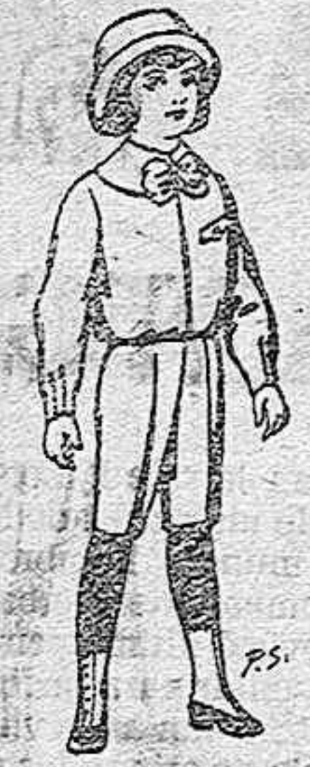
Trajes de patén para niños de 4 a 9 años. De ptas. 5 a 750