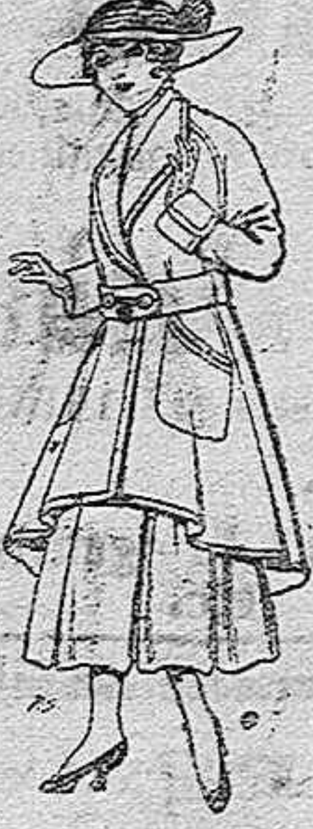
Abrigos de patén para jovencitas de 13 a 16 años. De pesetas 25 a 35.