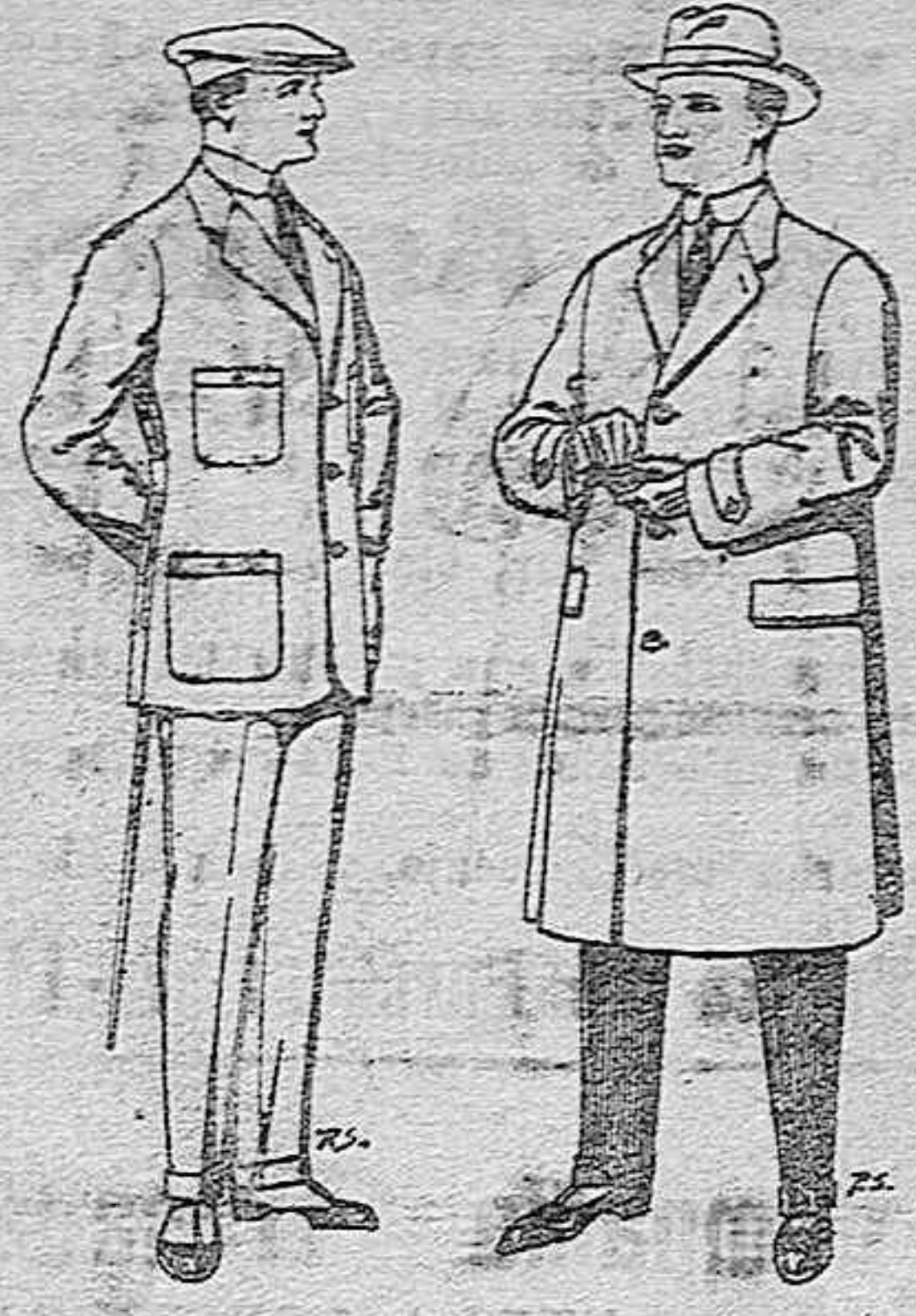
Trajes de chevioteor te elegante para "Sportman" De pesetas 35 a 50. Gabanes de tejido de pluma o ratina. De pesetas 30 a 100.