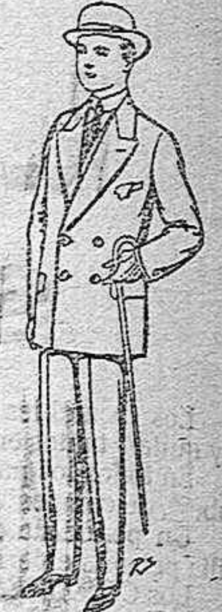
Trajes de patén vicuña etc. para niños de 10 a 16. De pts. 15 a 4