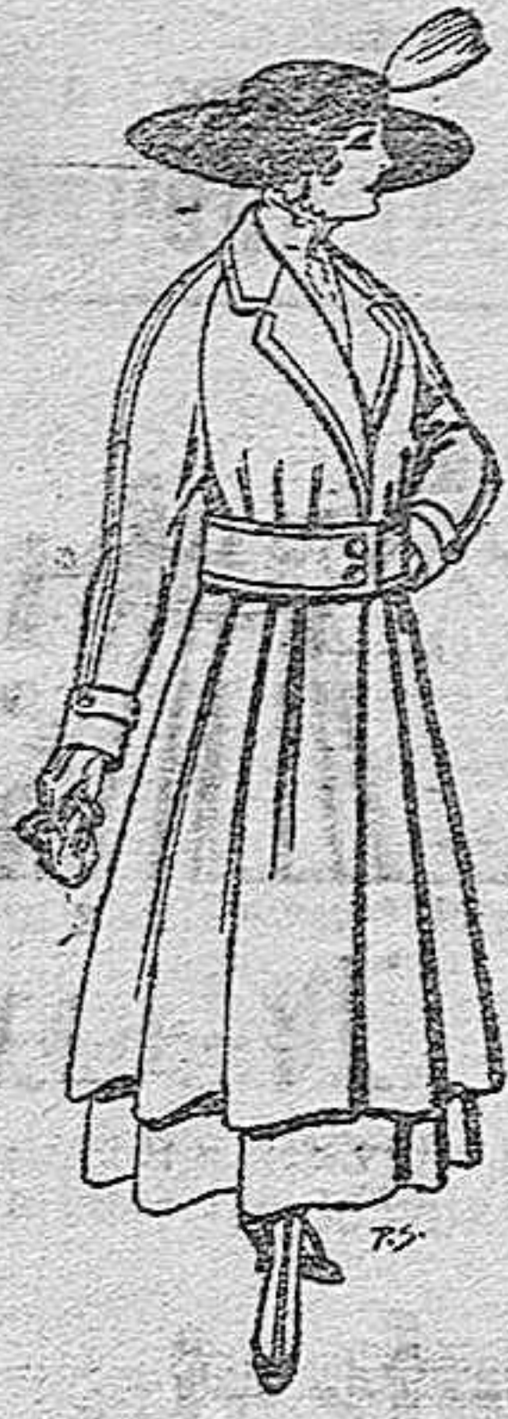
Abrigos de patén gran novedad, para señora. Apts. 53.