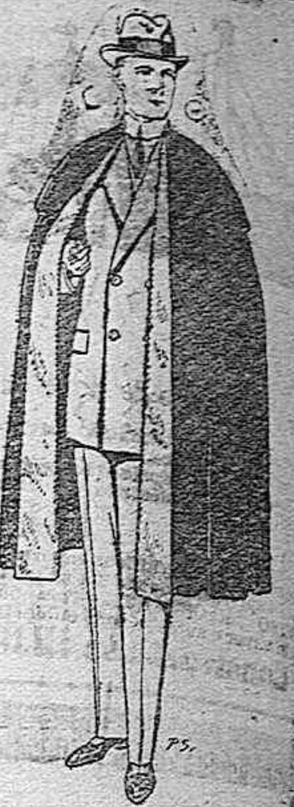
Capas (entieros) de paño. De pesetas 25 a 100.