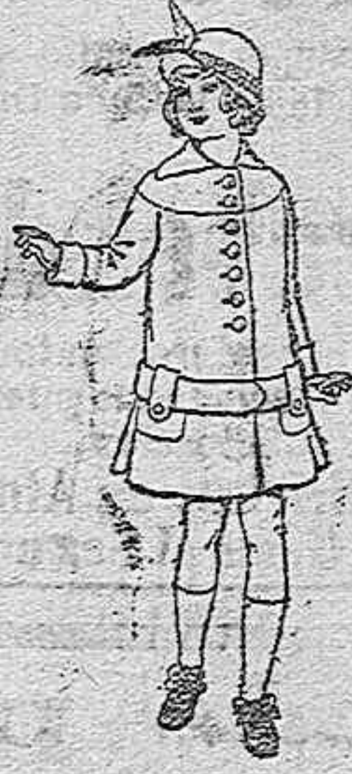
Abrigos de patén para niñas de 7 a 12 años. De pesetas 15 a 25.