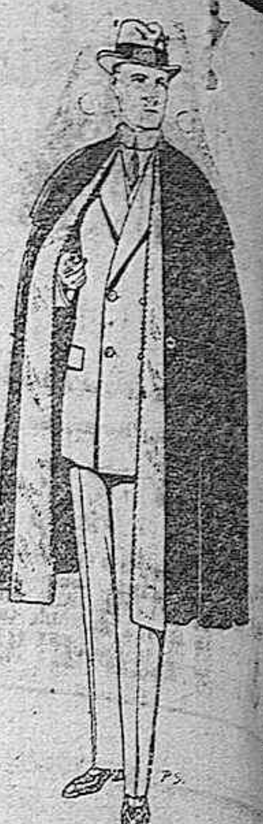
Capas (entras) de paño. De pesetas 25 a 100.