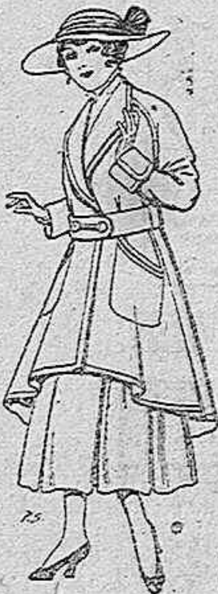
Abrigos de patén para jovencitas de 13 a 16 años. De pesetas 25 a 35.