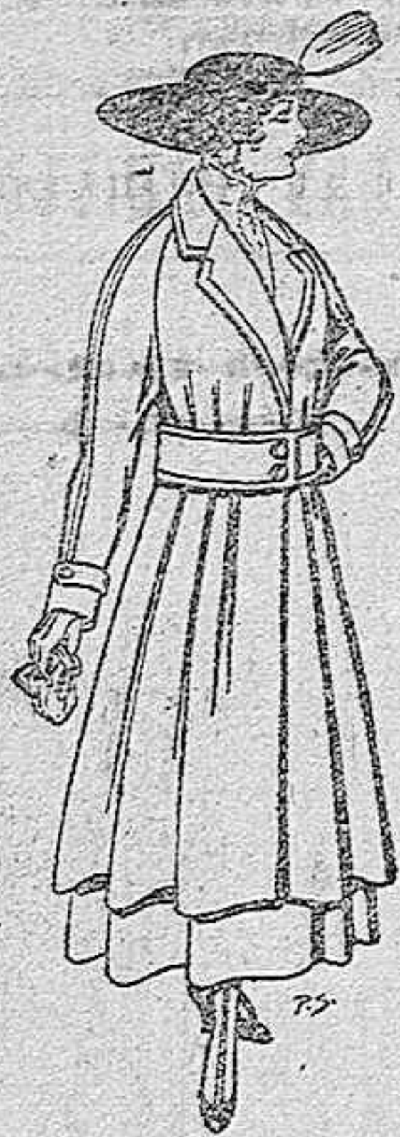
Abrigos de patén gran novedad, para señora. A pts. 53.