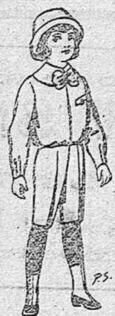
Trajes de patén para niños de 4 a 9 años. De pts. 5 a 7'50