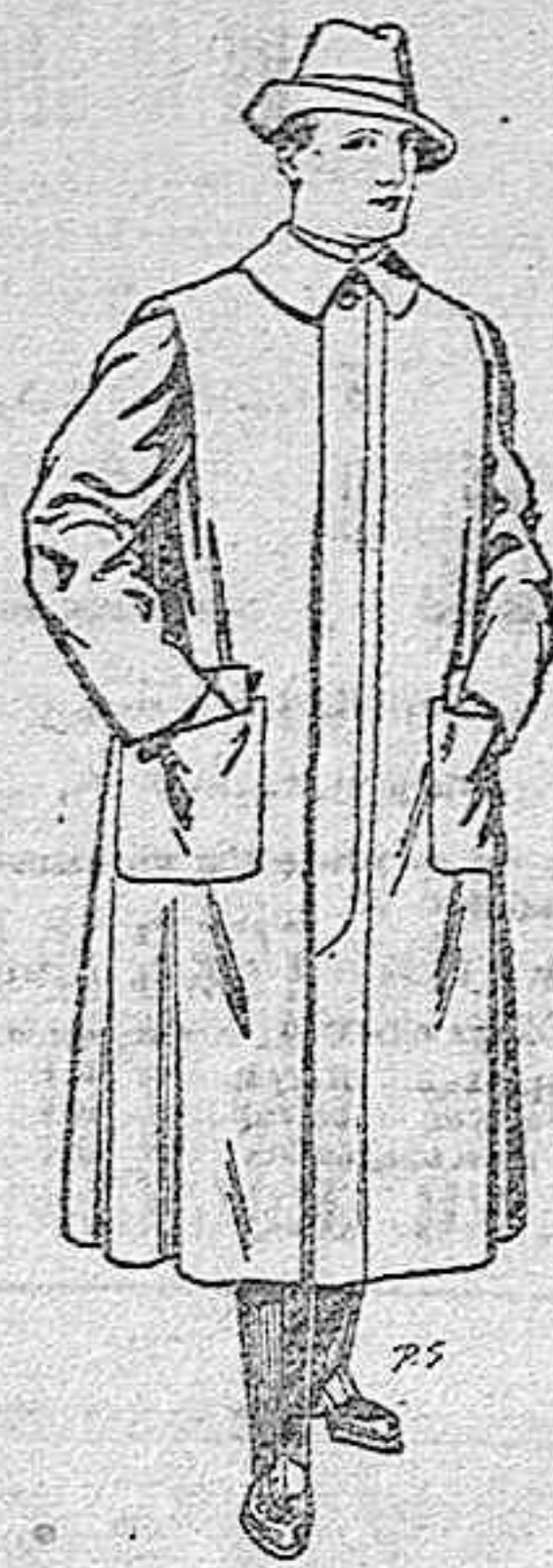
Impermeables para gabra gabán en color beige o gris. De pesetas 35 a 100.