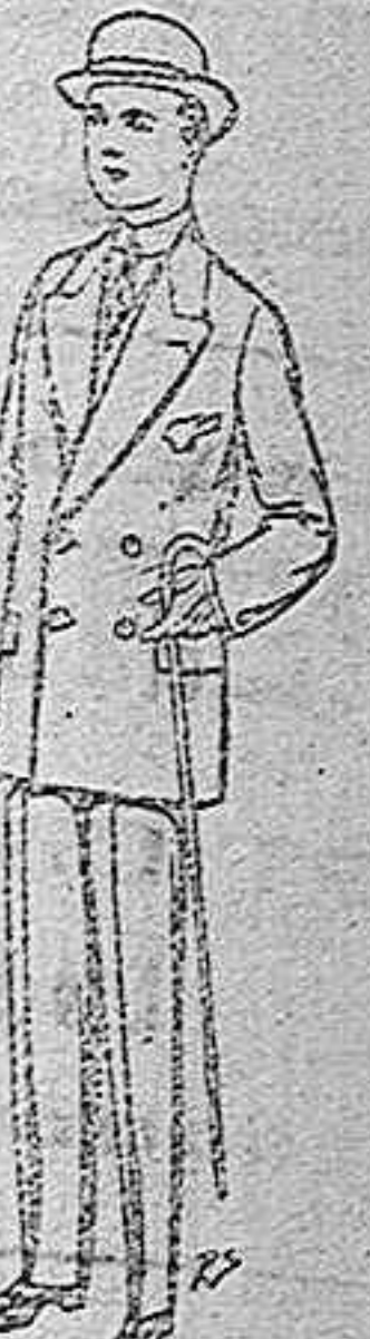
Trajes de patén vicuña etc. para niños de 10 a 16 años. De pts. 15 a 48.