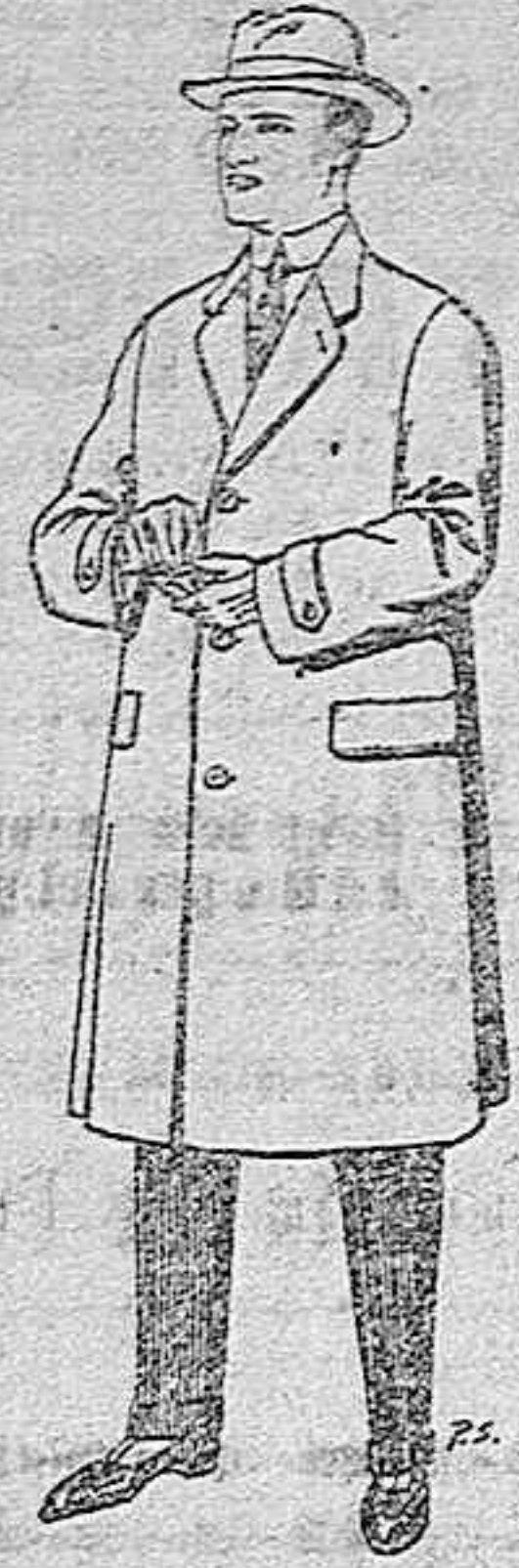
Gabanes de tejido de pluma o ratina. De pesetas 30 a 100.