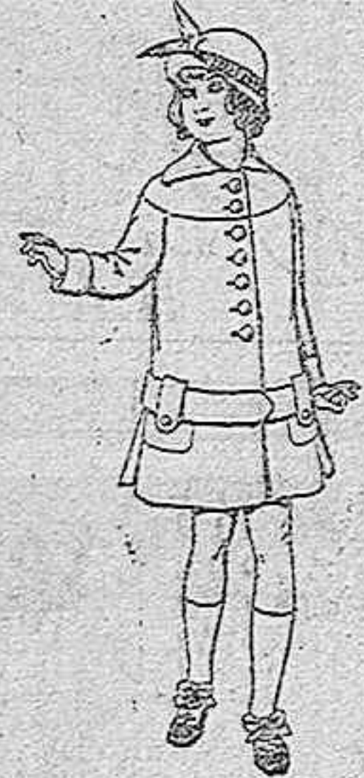
Abrigos de patén para niñas de 4 a 12 años. De pesetas 15 a 25.