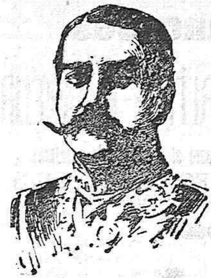
El duque de Tovar.

El duque de Tovar, entusiasta del Arte escultórico y no desafortunado cultivador de él, estuvo encargado del discurso de contestación.