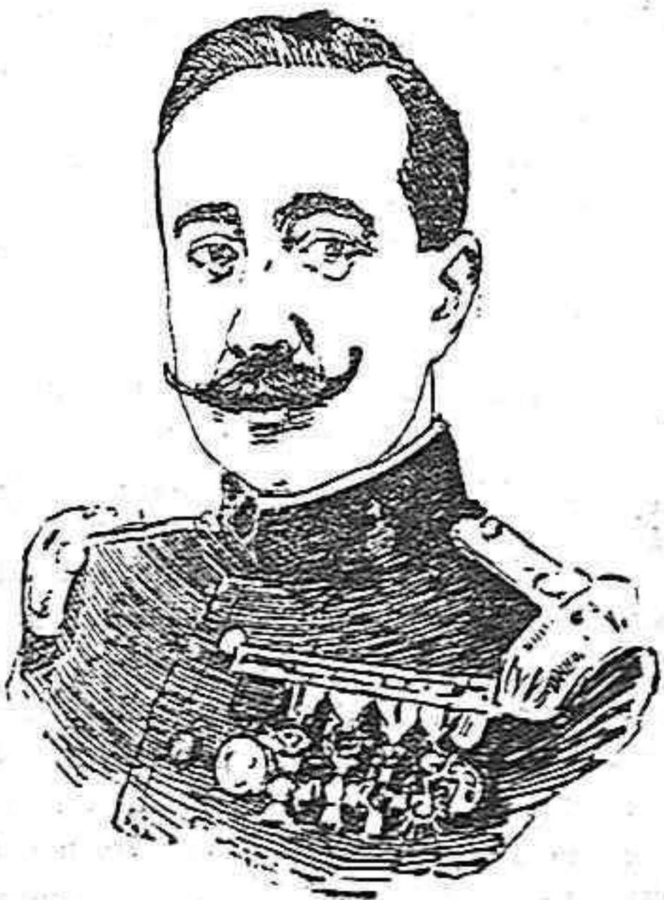
El marqués del Turia.

Con su Exposición, sin duda alguna la más bella, la más artística y la más original de cuantas hasta ahora se han celebrado en la vieja Iberia, se ha mostrado Valencia sobradamente acreedora