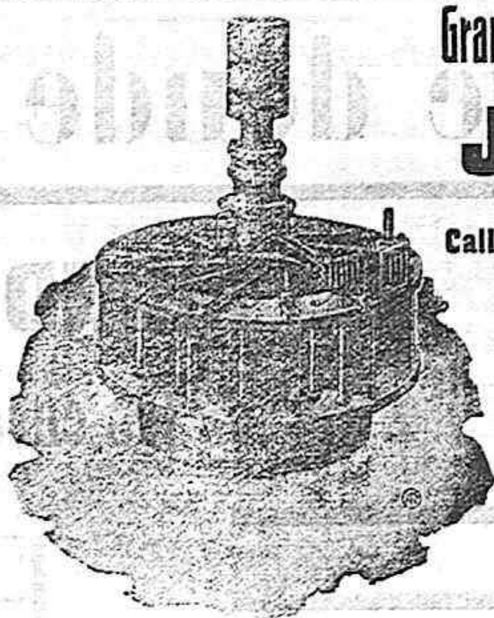
TURBINA SISTEMA LEFFEL A EJE VERTICAL