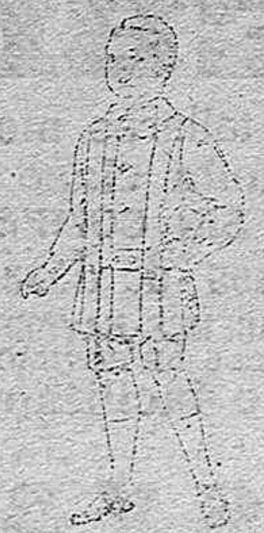
Trajes de lanilla para niños de 4 a 9 años. De pts. 12 a 31