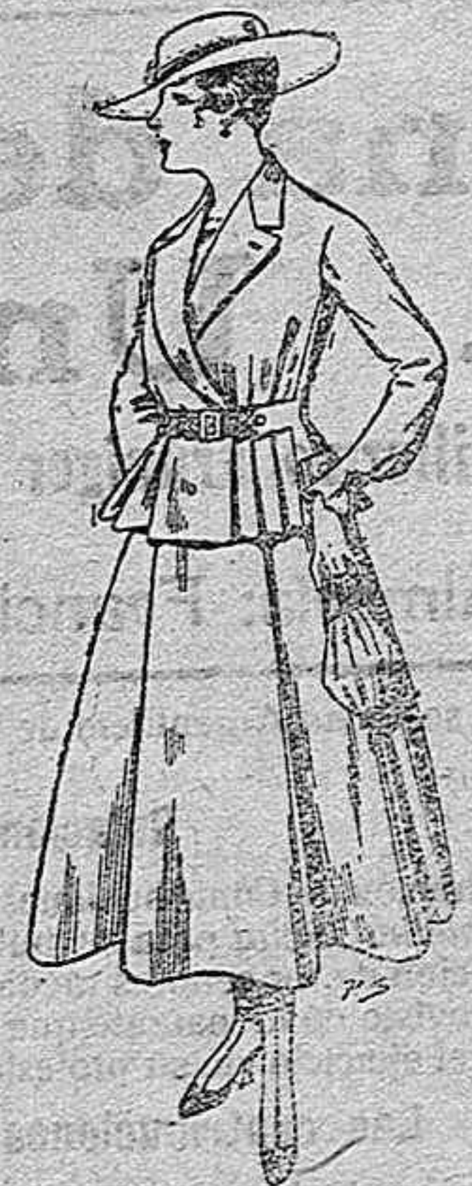
Trajes de lanilla para señora. A pesetas 70.