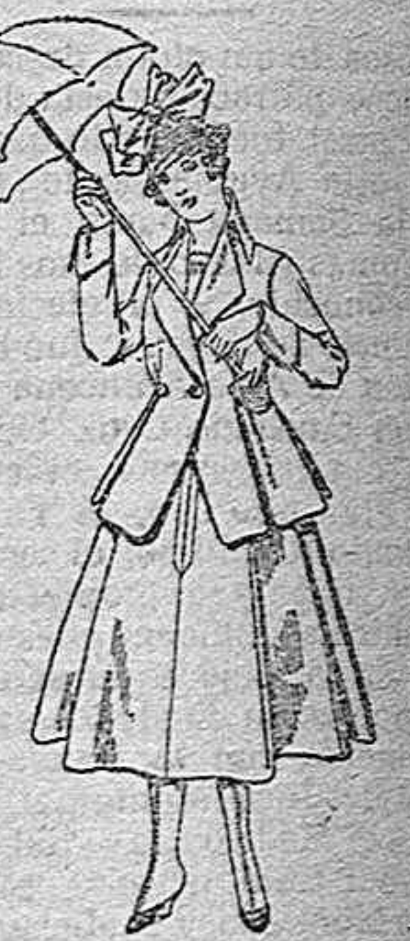
Trajes de lanilla para jovencitas de 13 a 16 años. De pesetas 53 a 55