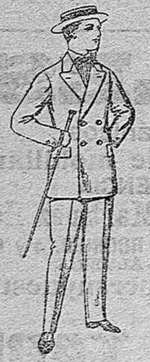
Trajes de lanilla para jovencitos de 10 a 16 años. De pts. 17 a 48.