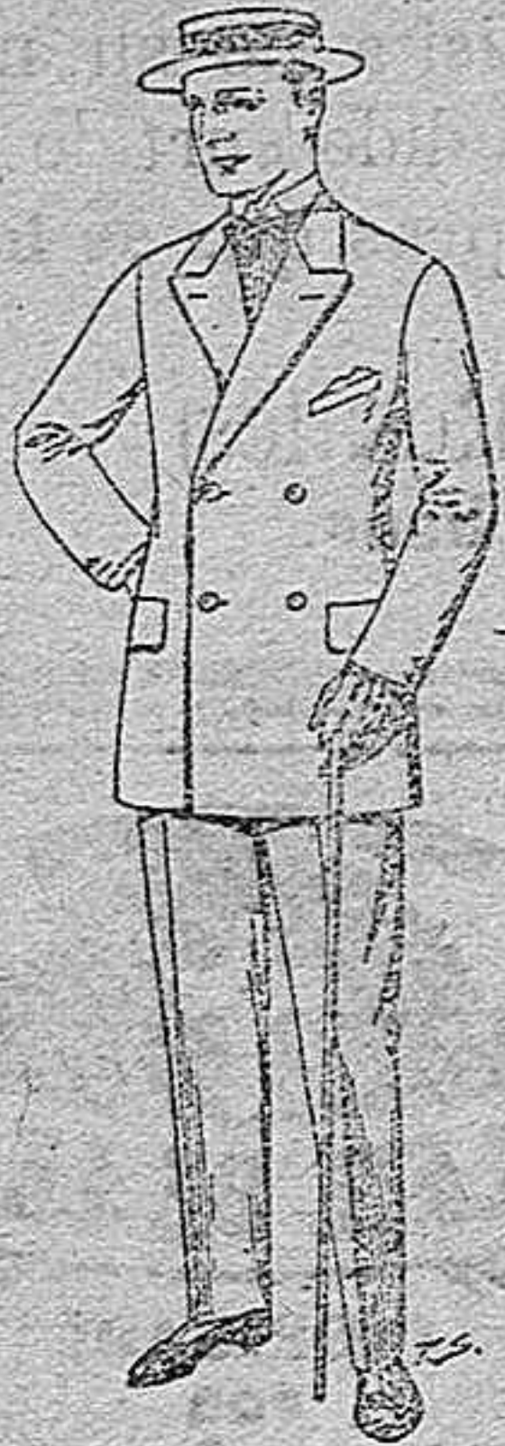
Trajes de vicuña o gerga negros y azules. De pts. 38 a 75.