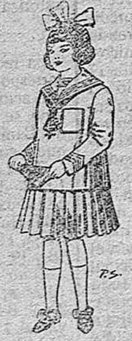
Trajes de lanilla para niñas de 4 a 12 años. De pts. 32 a 40.