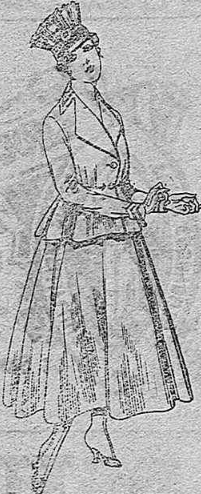
Trajes de lanilla para señora. A pesetas 80