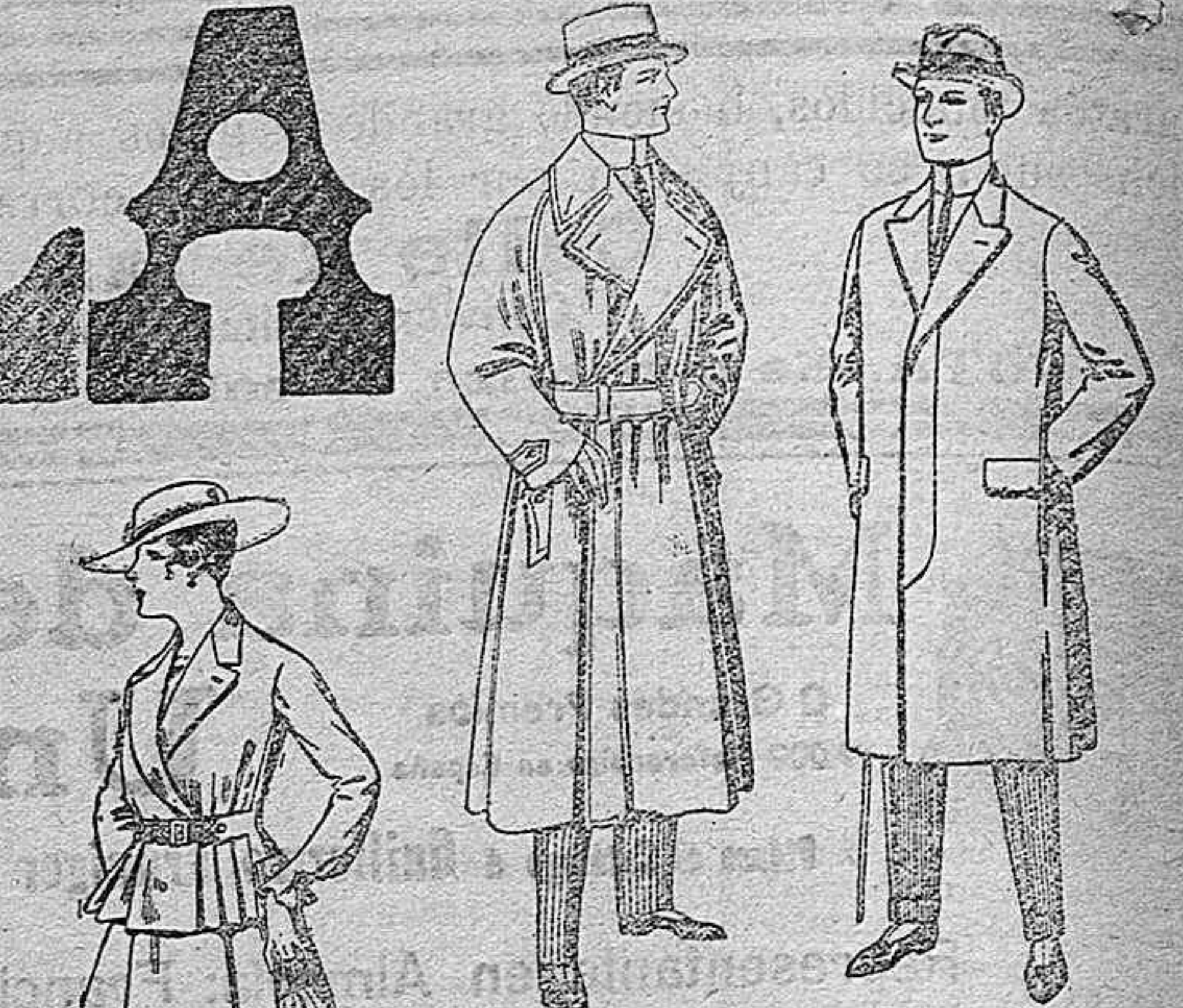
Gabanes impermeabilizados en color blige. De pts. 65 a 110