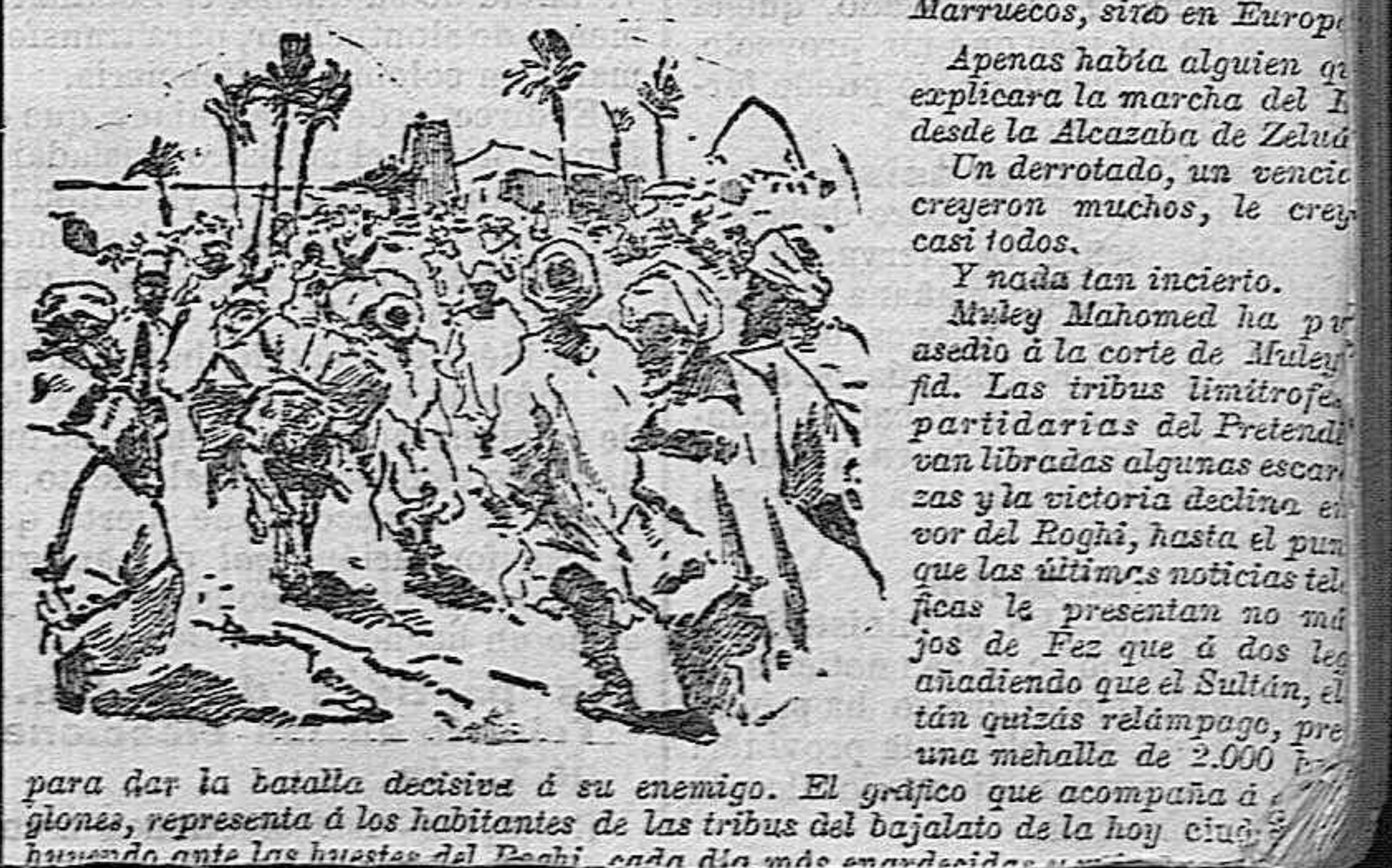
para dar la batalla decisiva a su enemigo. El gráfico que acompaña a la glosa, representa a los habitantes de las tribus del bajalato de la hoy ciudad de Marruecos, cada día más ensandecidos...

La información telegráfica de LA INDEPENDENCIA entera diariamente a sus lectores del estado, cada vez más crítico, por que atraviesa el imperio del Moghreb. Los recientes hechos de armas han producido impresión grandísima, no sólo en Marruecos, sino en Europa.