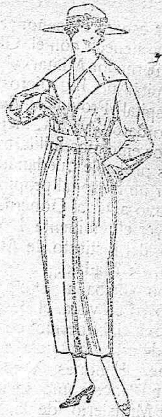
Guardapolvos de gabardina, dril y alpaca, colores beige, k. k. g. is, etc. de ptas. 22 a 55