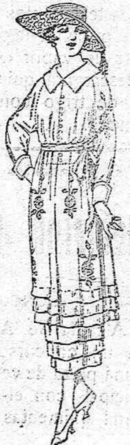
Vestidos de etamín blanco, azul y color, adornos bordados. de ptas. 50 a 68