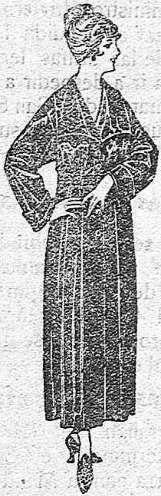
Batas de crespón, esterilla, etc. de ptas. 32 a 46

Camisería, Géneros de punto, Corbatería Sombrerería, Zapatería, Guantería, Paraguas, Bastones, Peletería y artículos de Viaje.