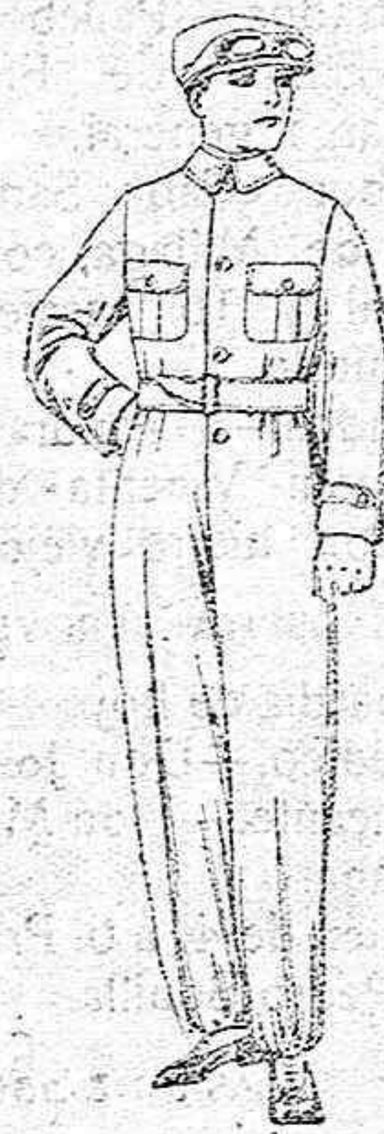
Trajes de dril azul, beige, kaki, etc., para aviador, motociclista, mecánico, etc. de ptas. 18 a 25.