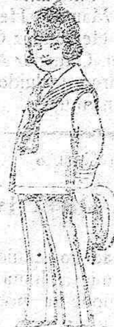
Trajes modelo Marinera inglesa de viuña o estambre azul y negro niños de 3 a 9. de 26 a 45

Ropas confeccionadas para Caballero, Señora, Niño y Niña