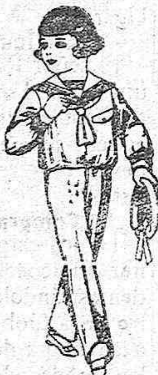
Trajes modelo «Marinera» de dril otomán blanco para niños de 3 a 9 años. de ptas. 14 a 22.

Ropas confeccionadas para Caballero, Señora, Niño y Niña