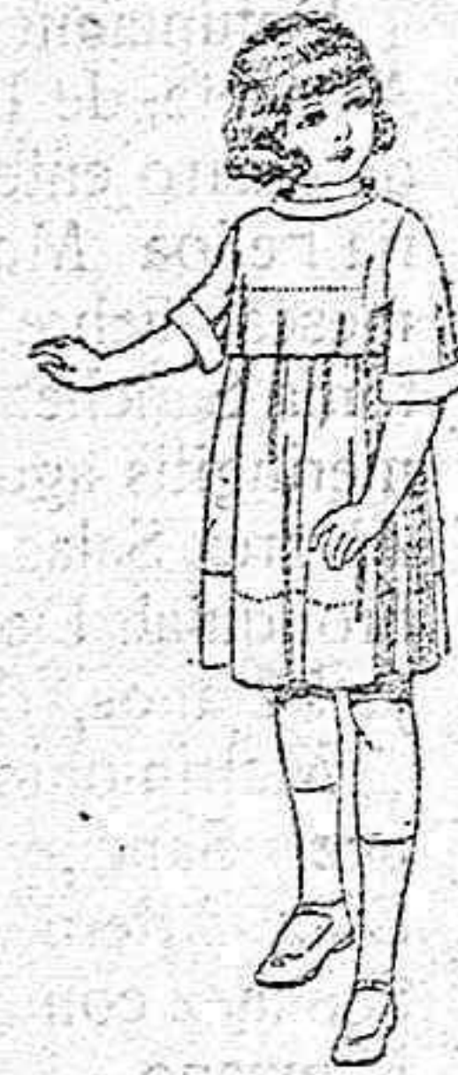
Vestidos de seda liberty pongée, etc. para niñas de 7 a 12 años. de ptas 30 a 38