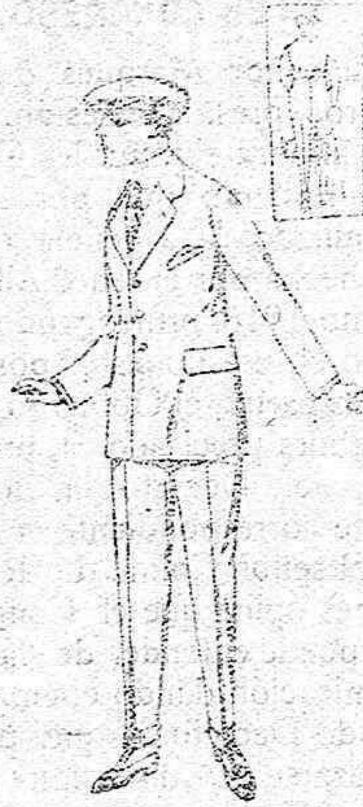
Trajes modelo Sport de lanilla melón, etc. para jóvenes de 10 a 16 años. de ptas 27 a 60