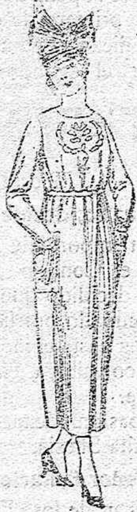
Vestidos de tricot de lana, en azul y colores, bordados a mano a ptas. 112