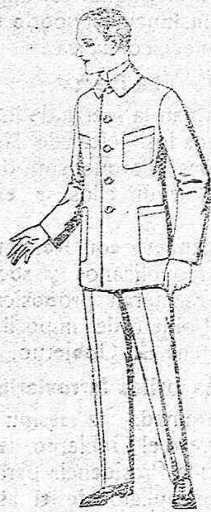
Trajes de dril azul, para mecánicos. de ptas. 17 a 25