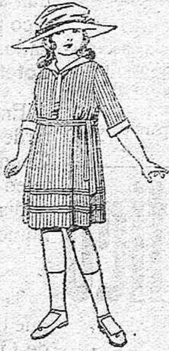
Vestidos de voile, listados, adornos blancos, para niñas de 4 a 9 años. de ptas. 22 a 32